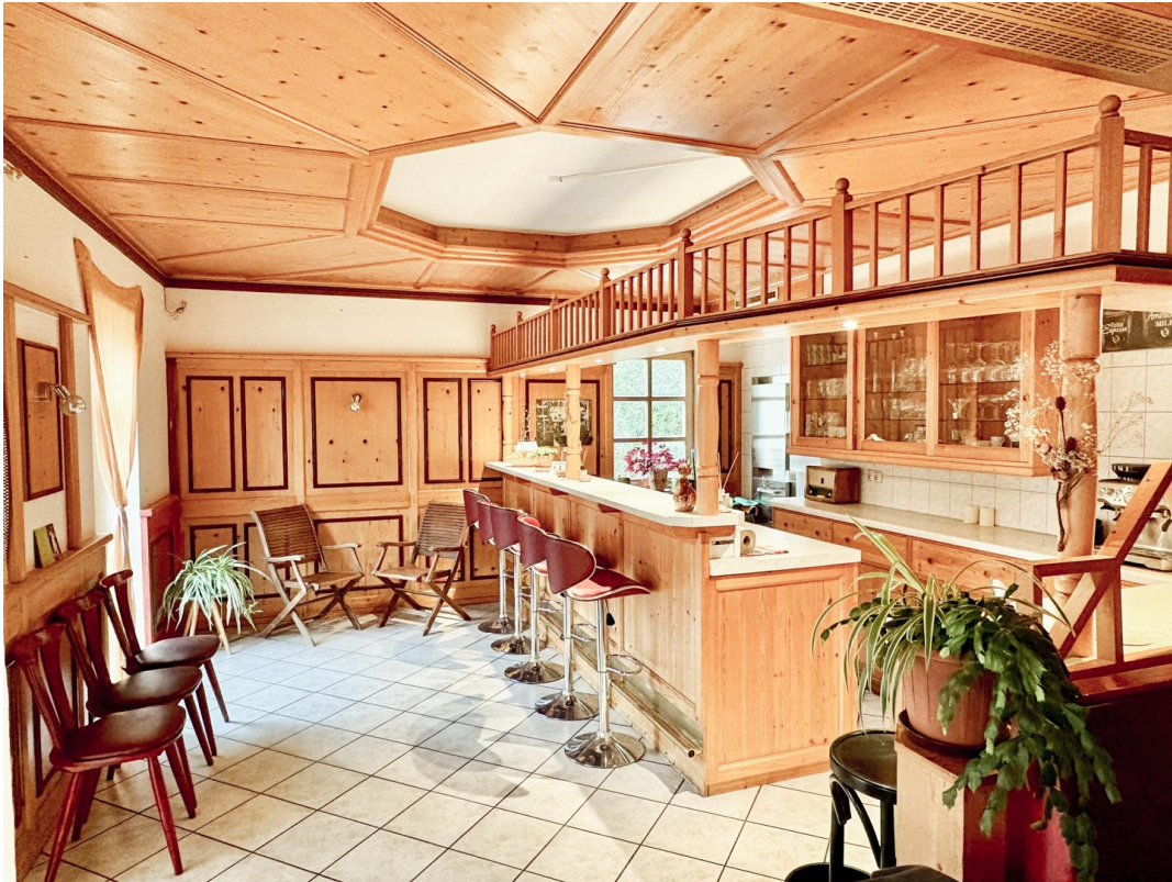
ProjektCafeAtelier 2 EG