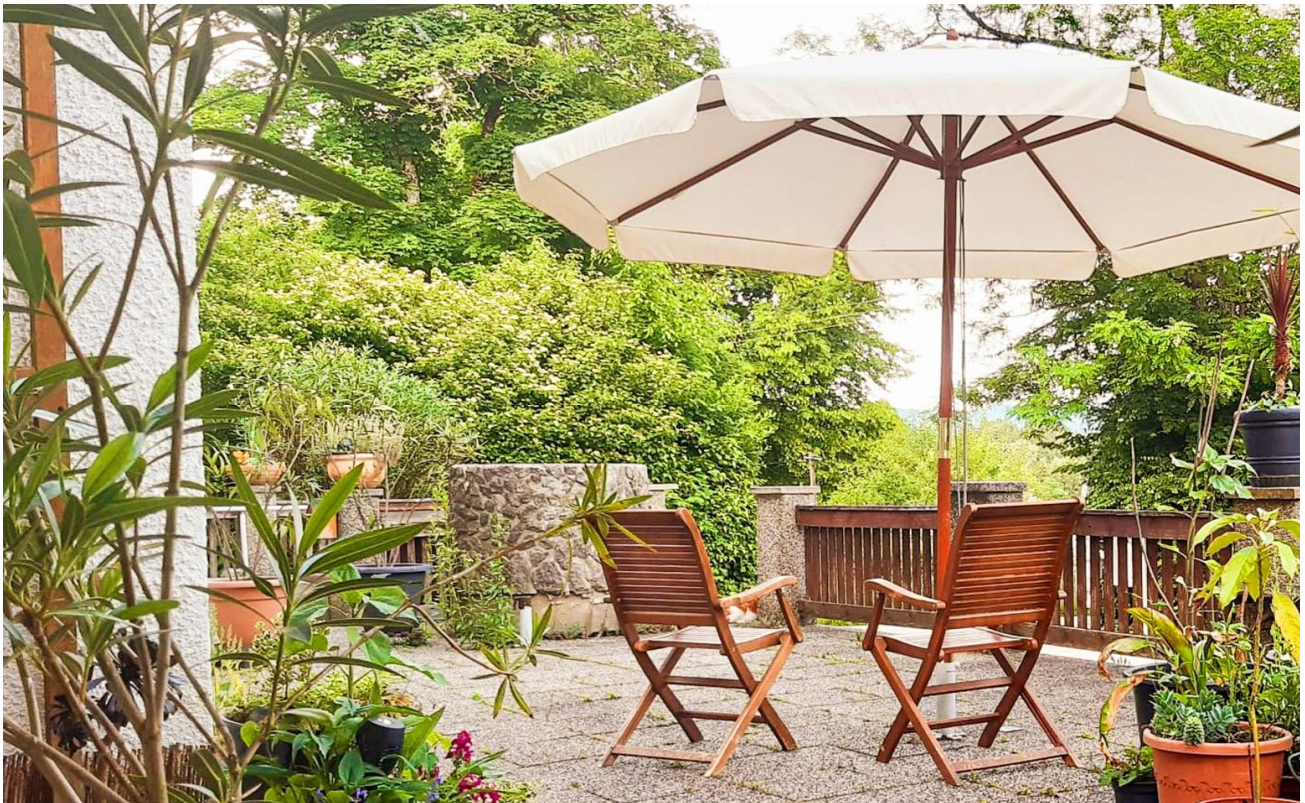
Sonnen Terrasse EG