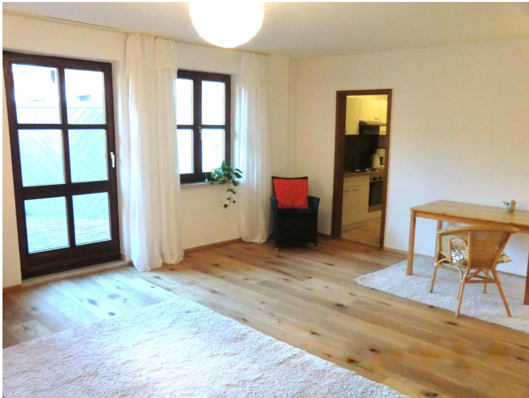
Wohnen zur Küche