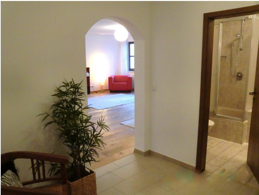
Diele zu Bad