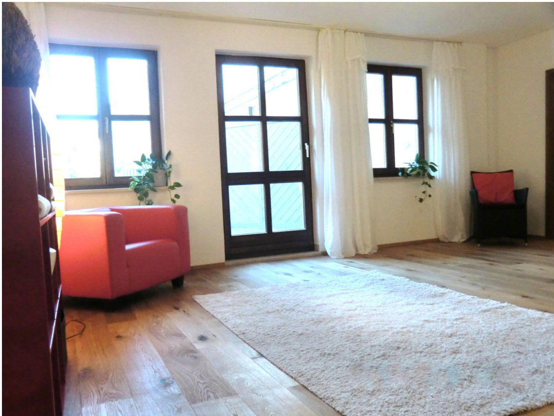
Wohnen zur Terrasse