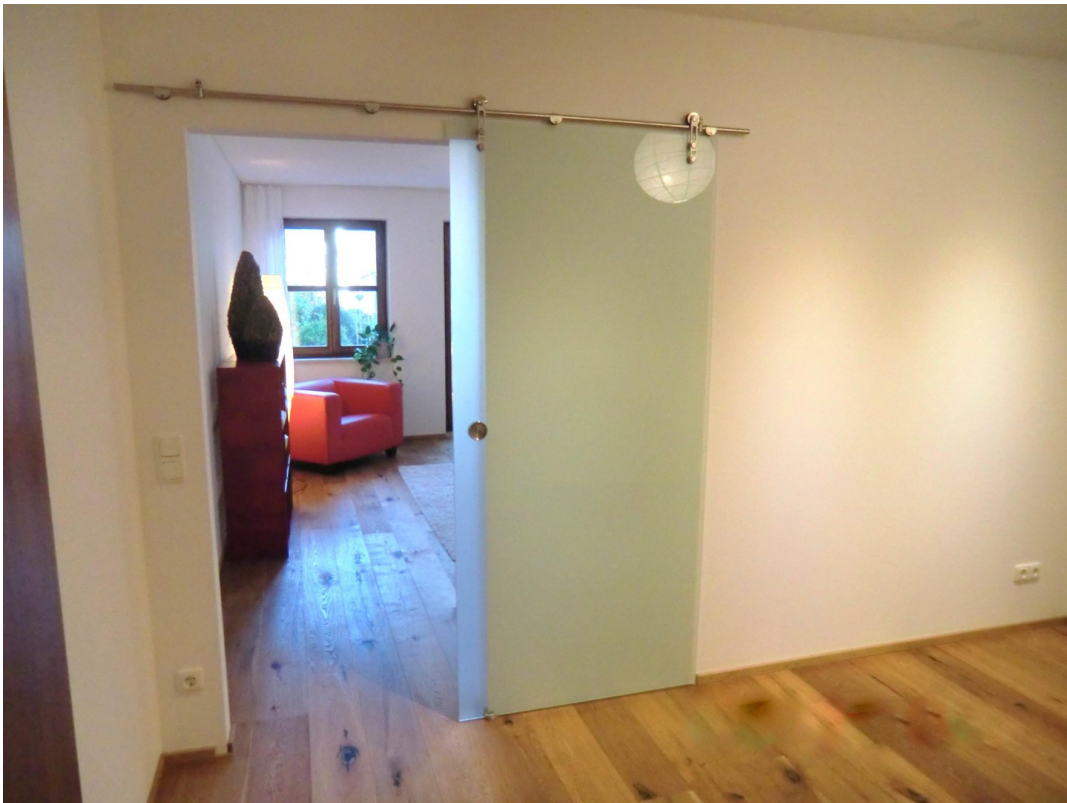
Schlafen zu Wohnen