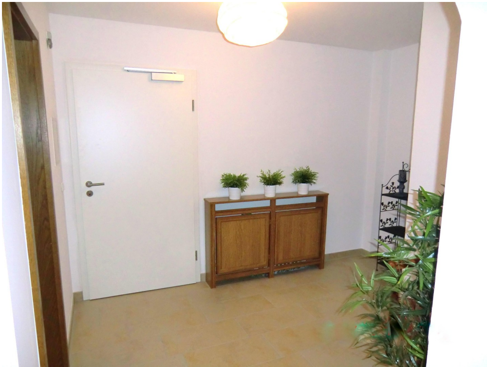
Diele zu Eingang