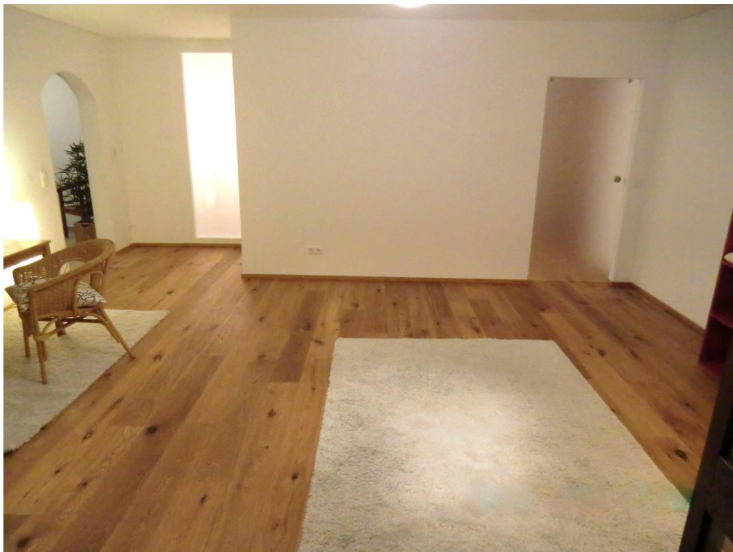
Wohnen zum Schlafzimmer