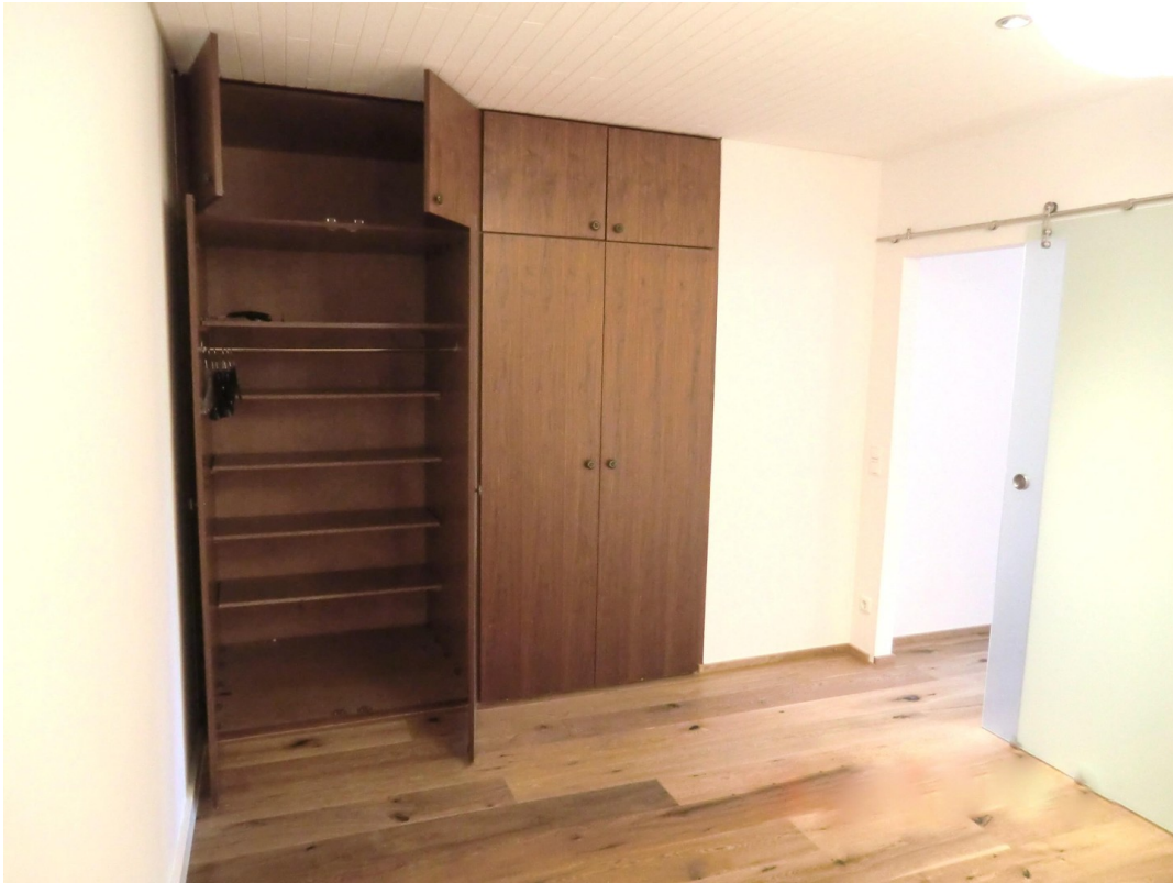
großer Einbauschränk 2tlg