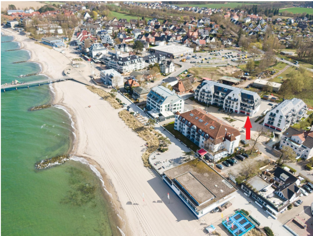
Luftbild mit Markierung