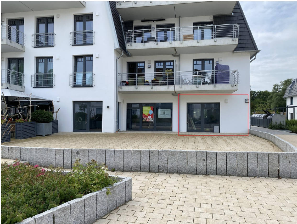
Außenansicht mit Markierung 2