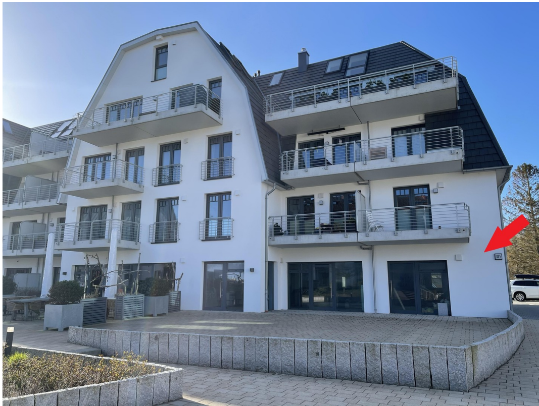
Außenansicht mit Markierung 1