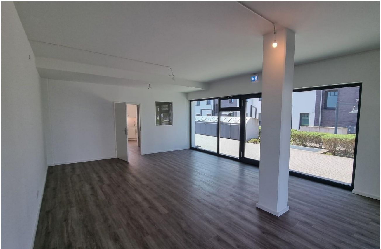
Verkaufsfläche - Bild 2