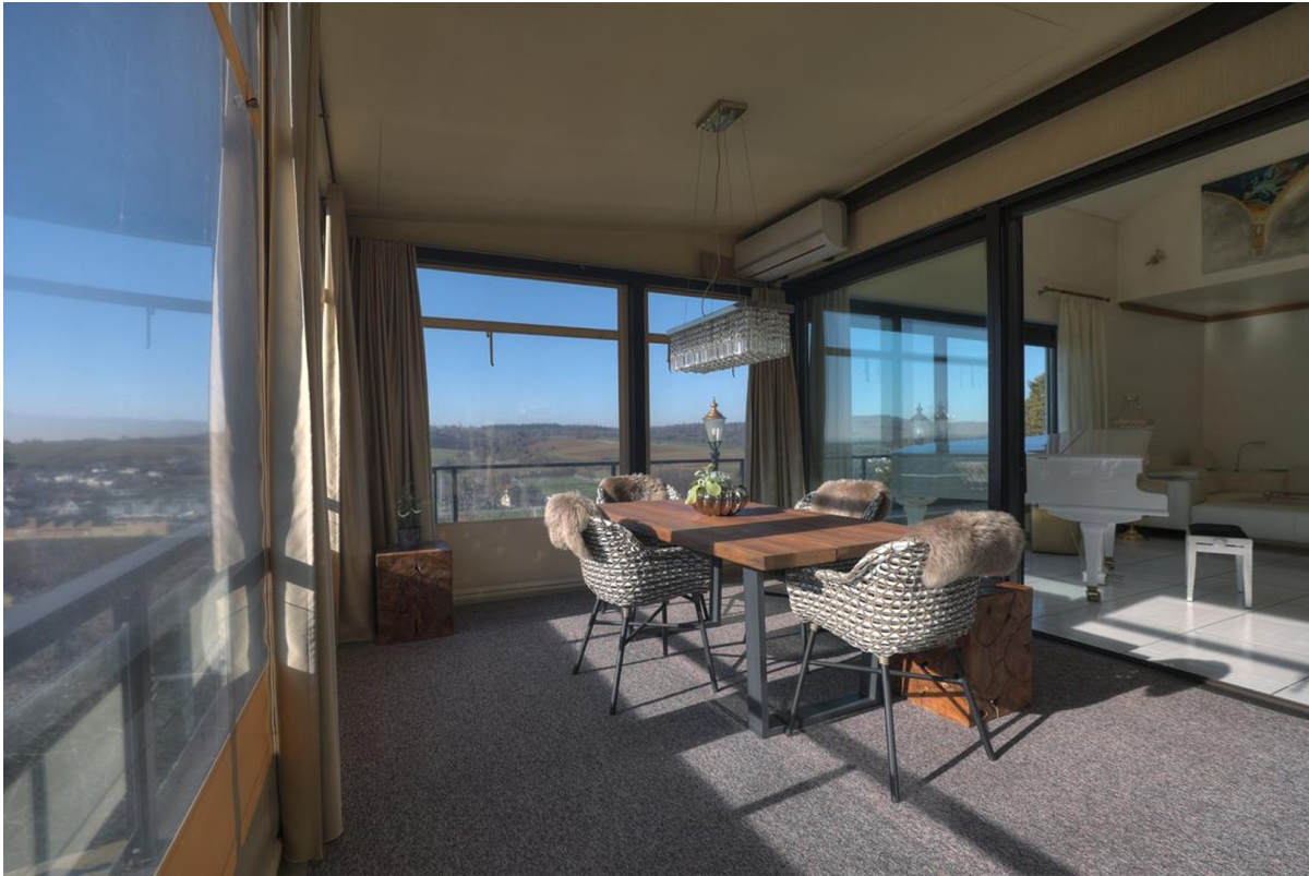
Wintergarten - Erdgeschoss