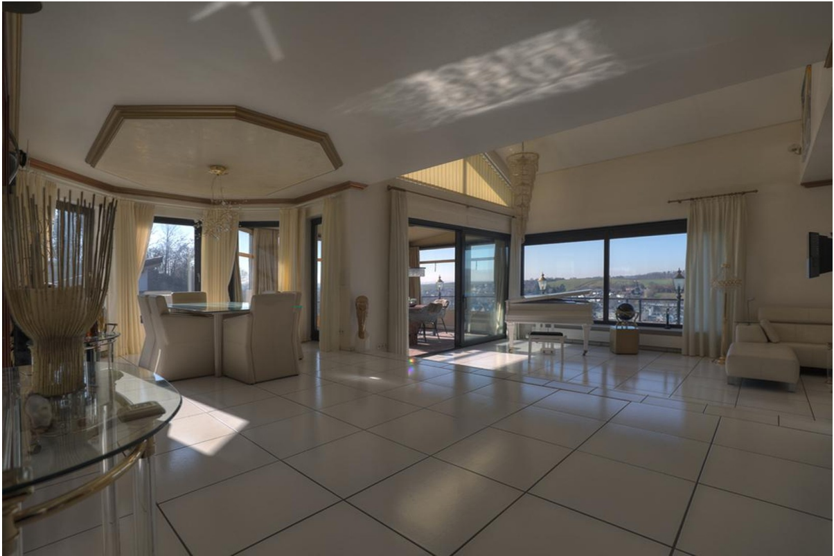
Wohn- Essbereich - Erdgeschoss