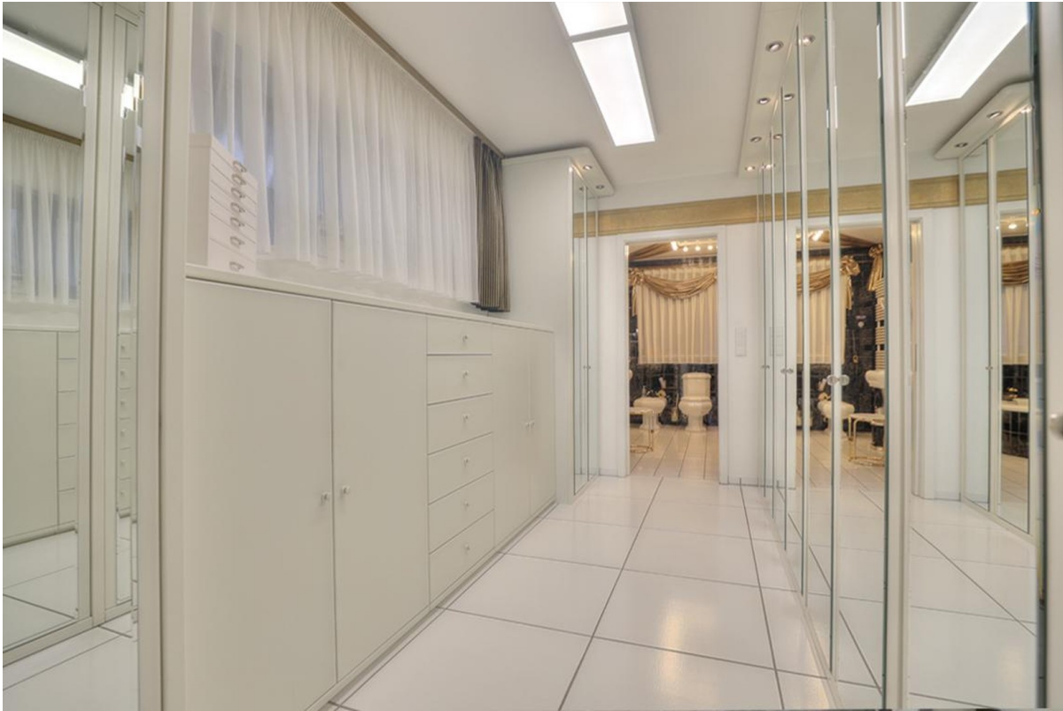
Ankleide - Erdgeschoss