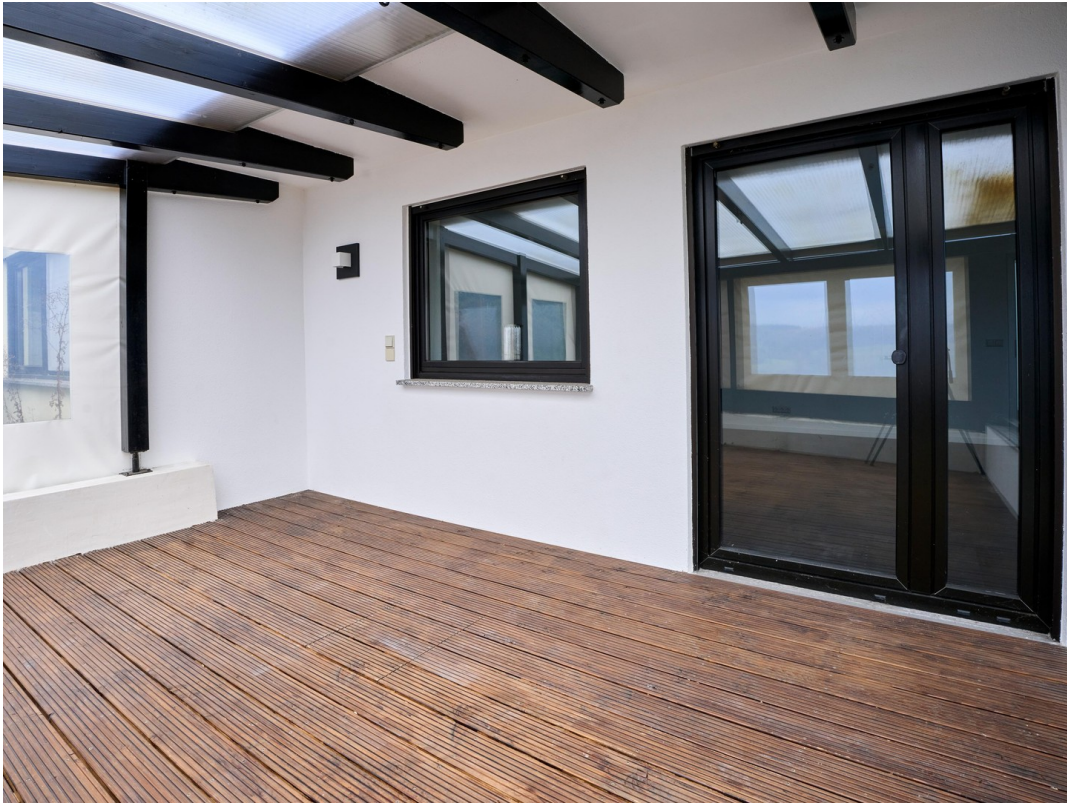
Wintergarte - Einliegerwohnung