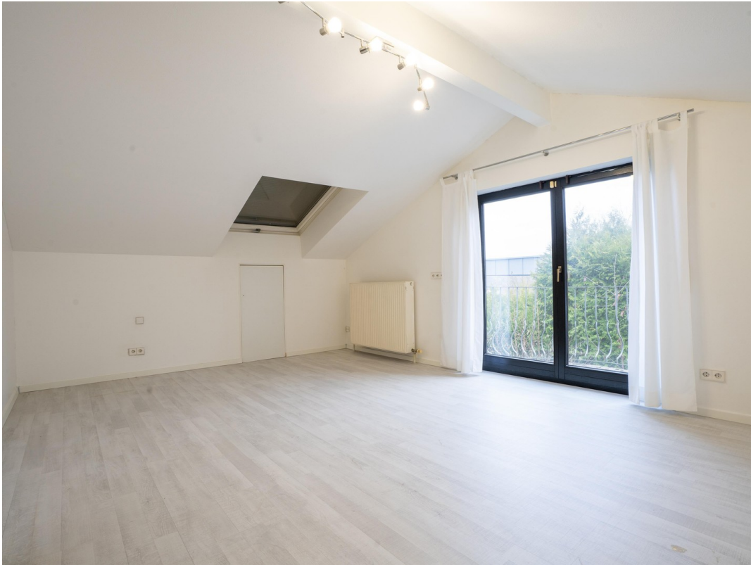
Schlafzimmer - Dachgeschoss