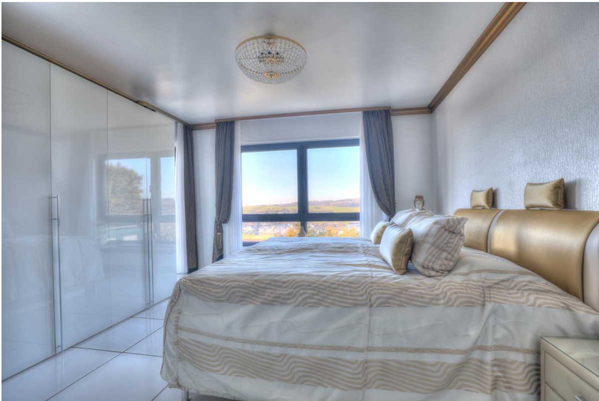
Schlafzimmer - Erdgeschoss