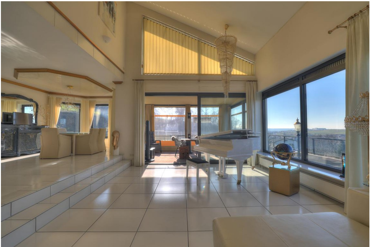
Wohnbereich - Erdgeschoss