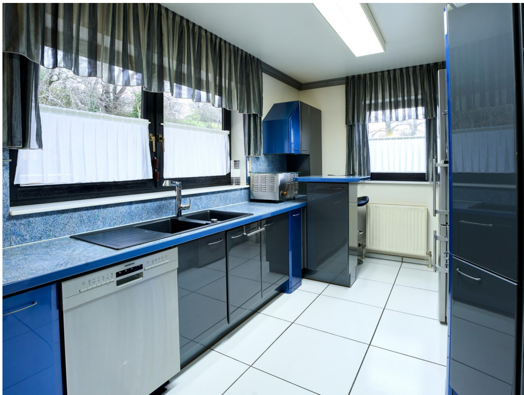
Küche - Erdgeschoss