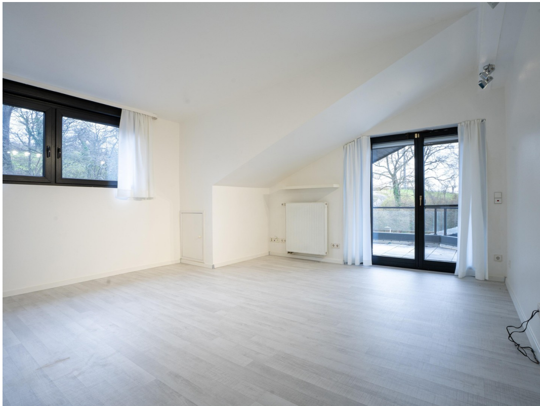
Wohnzimmer - Dachgeschoss