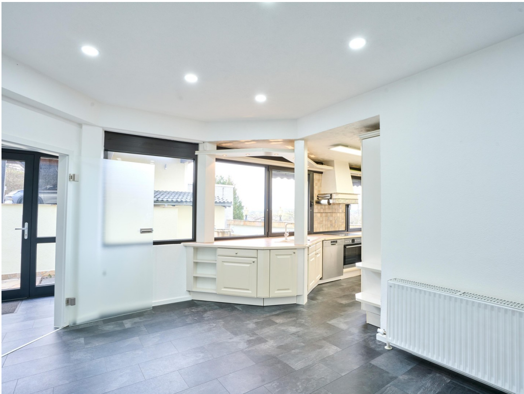
Vorraum - Einliegerwohnung