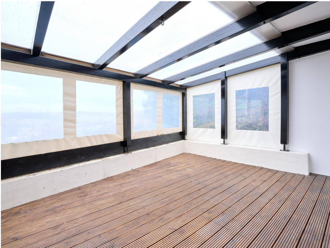
Wintergarte - Einliegerwohnung