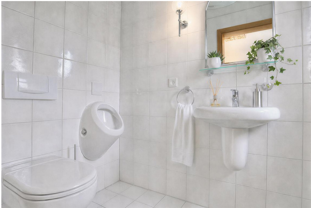
Gäste-WC - Erdgeschoss