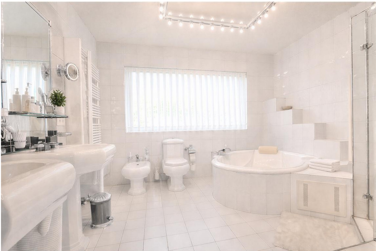
Badezimmer - Erdgeschoss