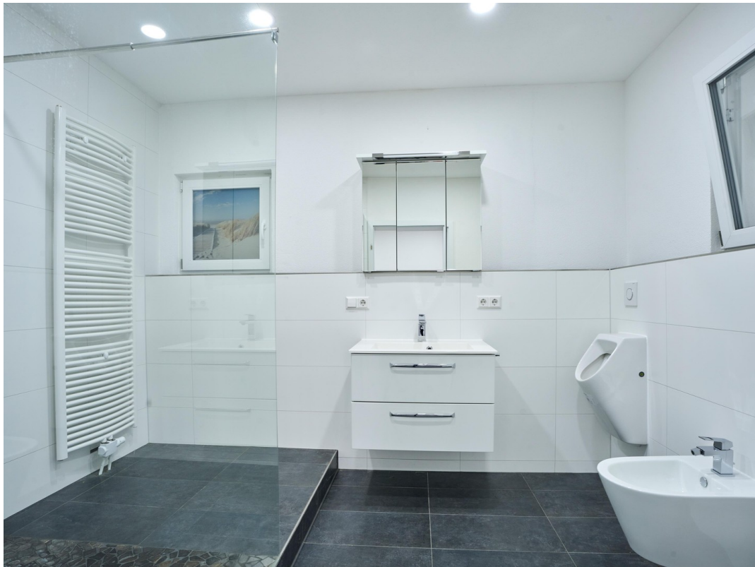
Badezimmer - Einliegerwohnung