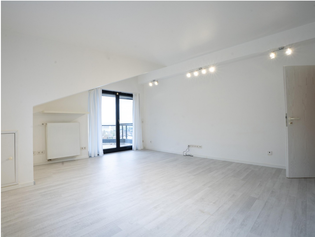
Wohnzimmer - Dachgeschoss