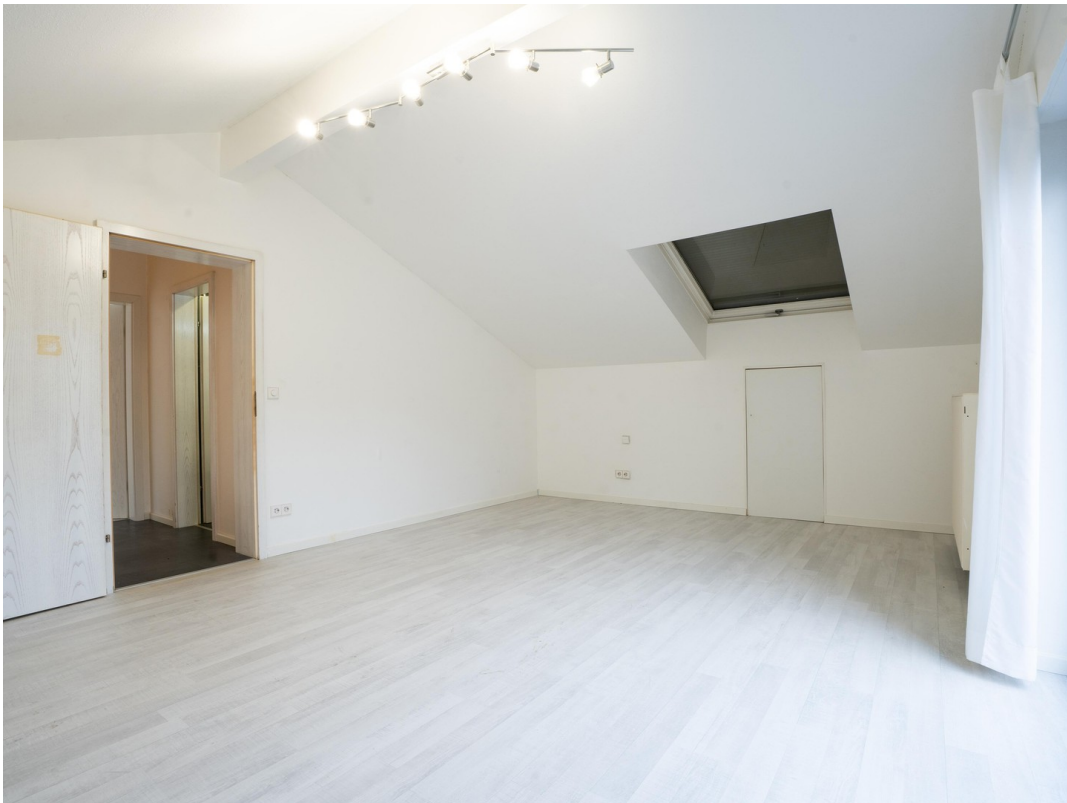
Schlafzimmer - Dachgeschoss