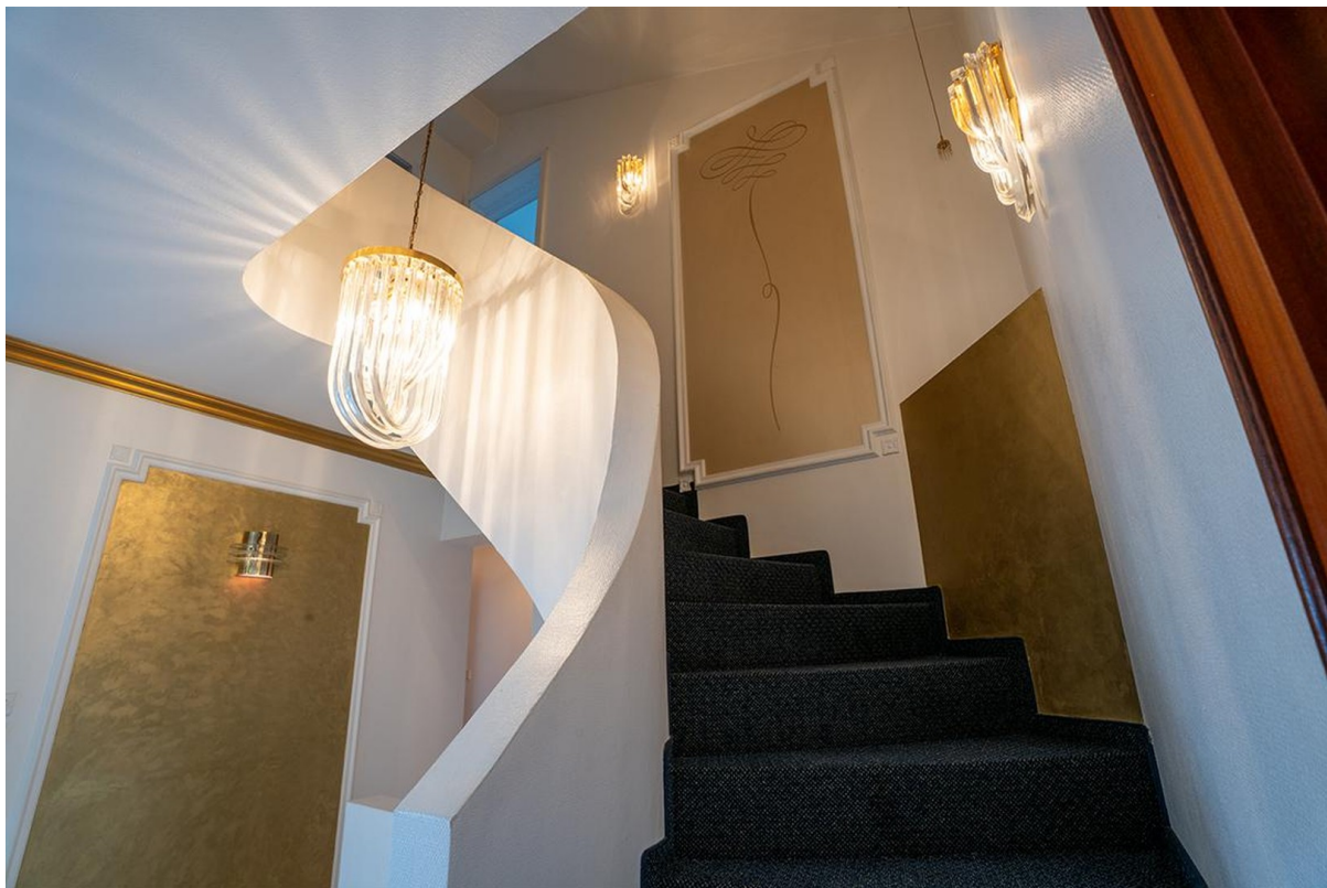
Treppenaufgang - Erdgeschoss