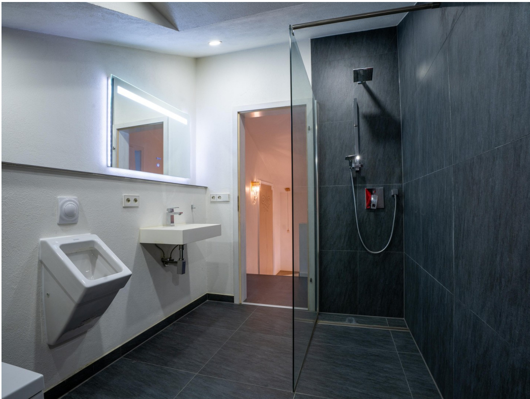
Badezimmer - Dachgeschoss