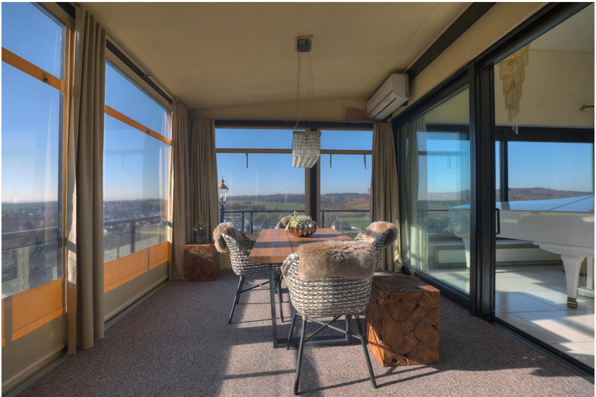
Wintergarten - Erdgeschoss