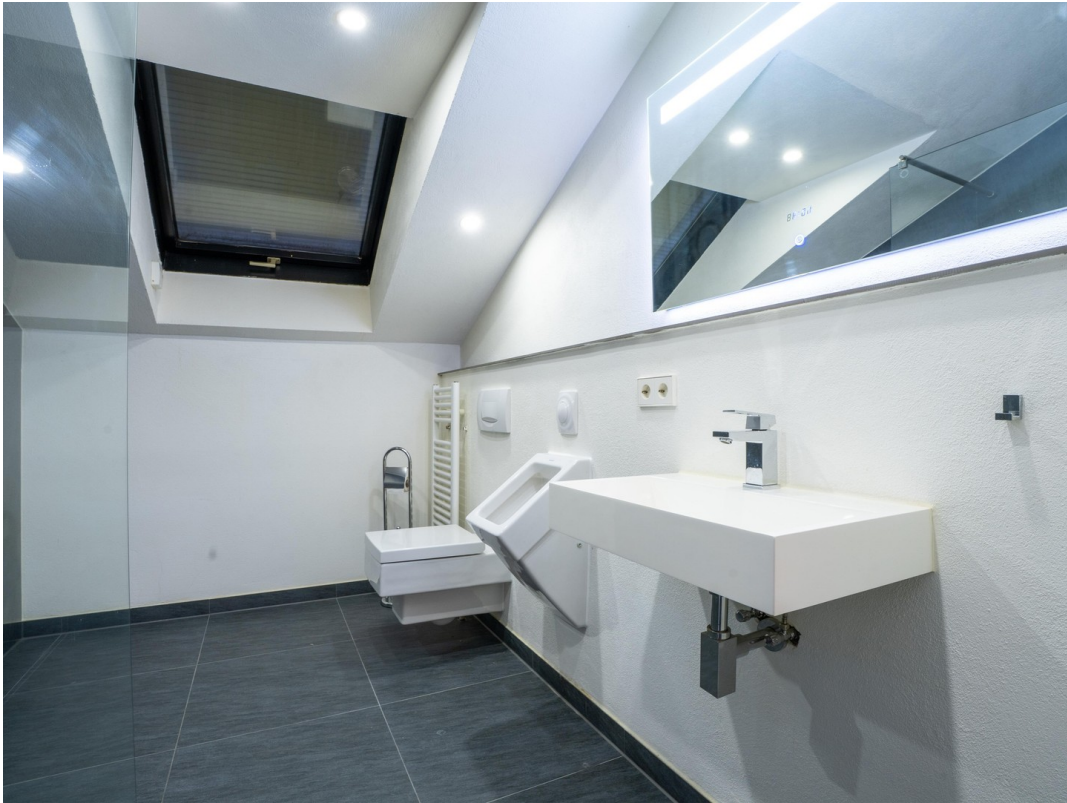
Badezimmer - Dachgeschoss