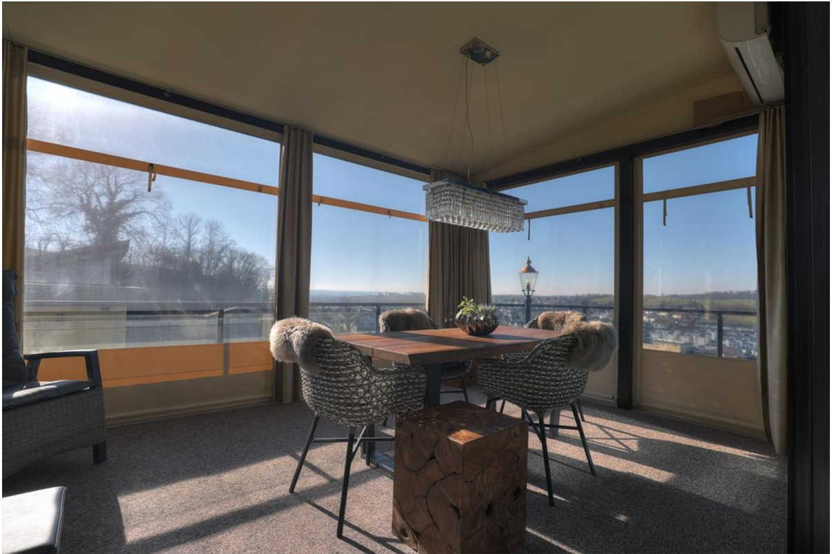
Wintergarten - Erdgeschoss