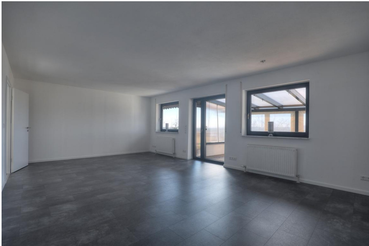
Wohnzimmer - Einliegerwohnung