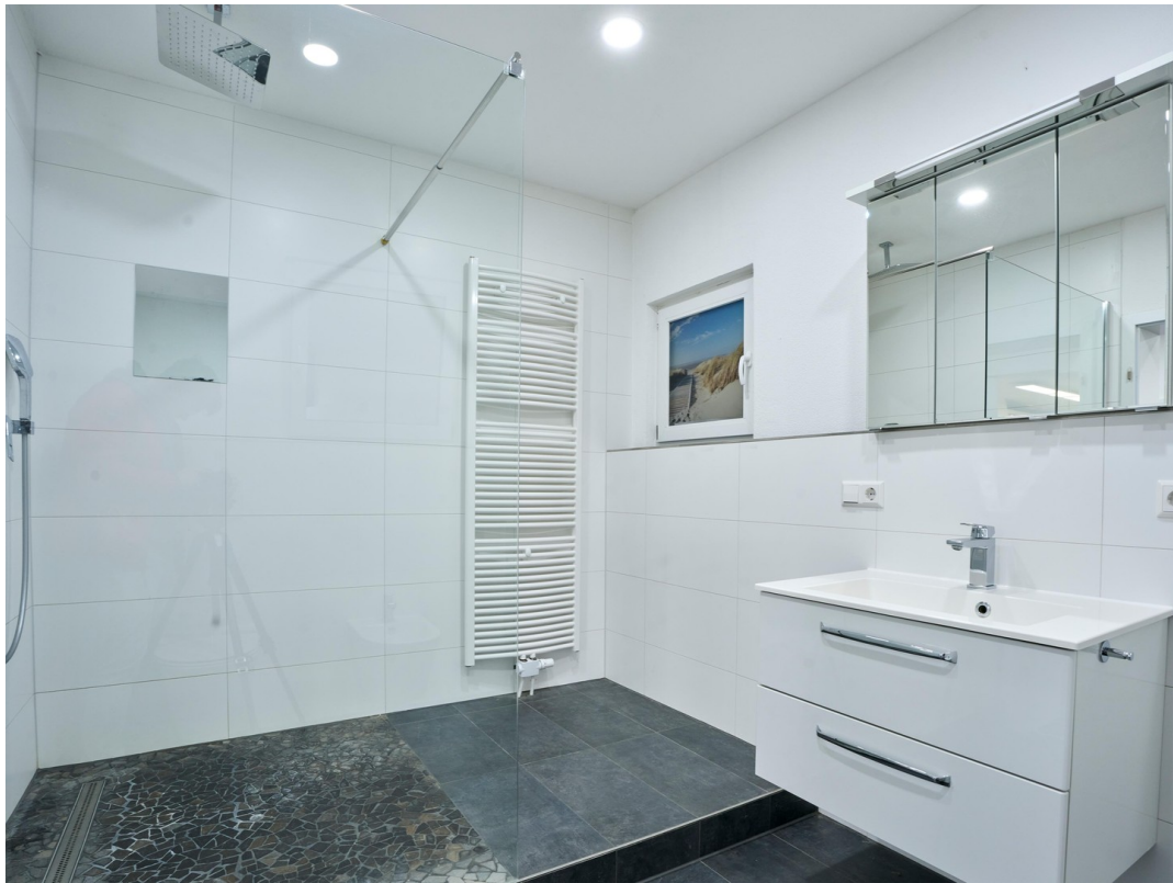
Badezimmer - Einliegerwohnung