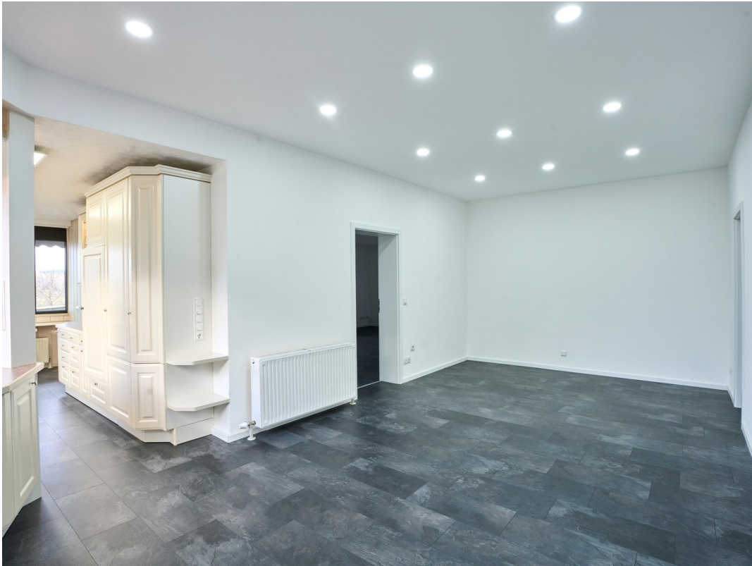
Vorraum - Einliegerwohnung