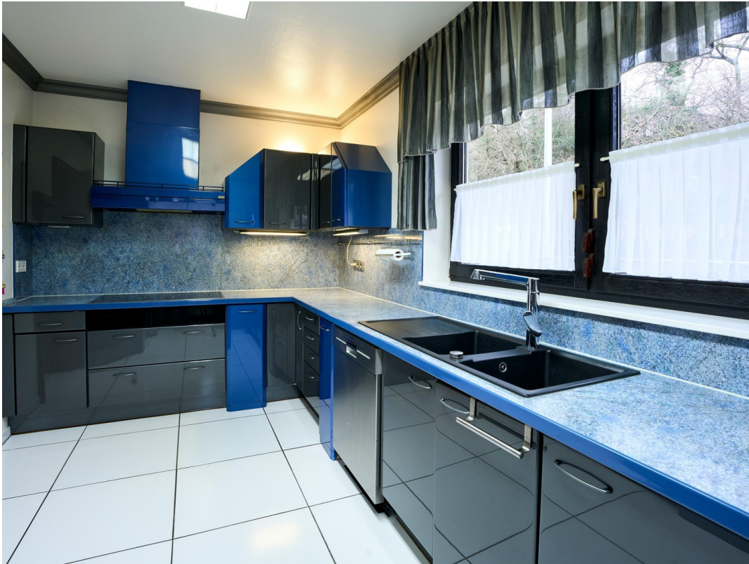
Küche - Erdgeschoss