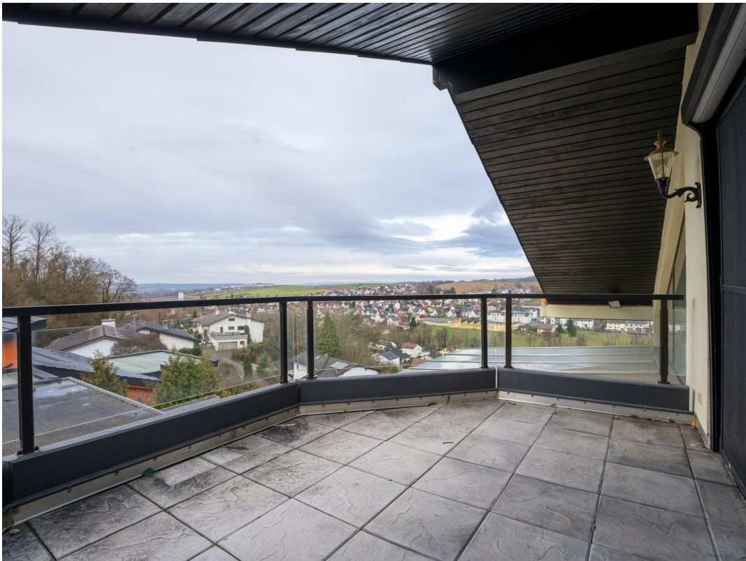
Balkon - Dachgeschoss