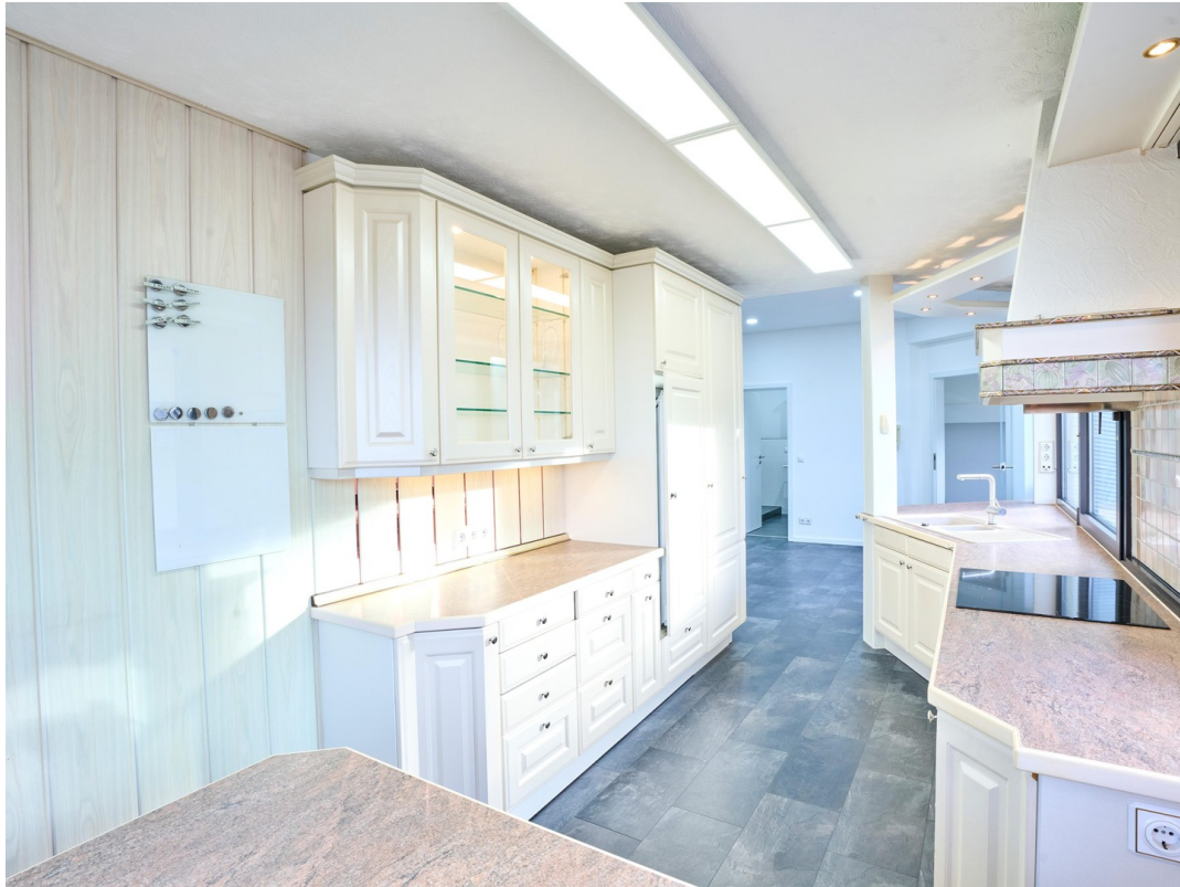
Küche - Einliegerwohnung