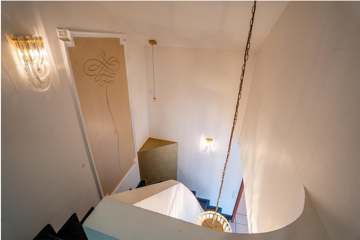
Treppenabgang - Dachgeschoss