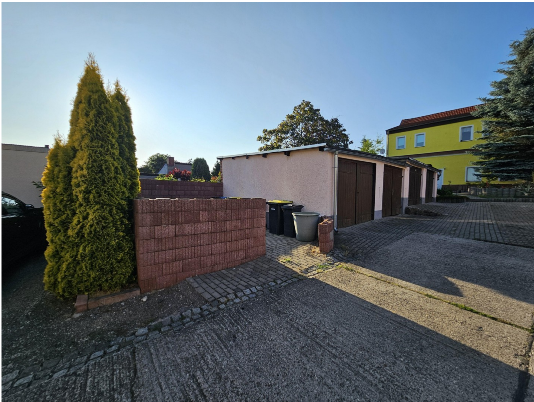
Garagen und Mülltonnenplatz