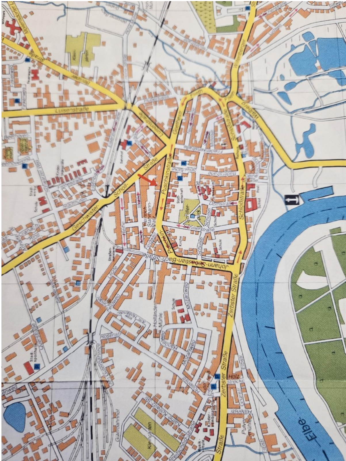
Immobilienlage im Ort