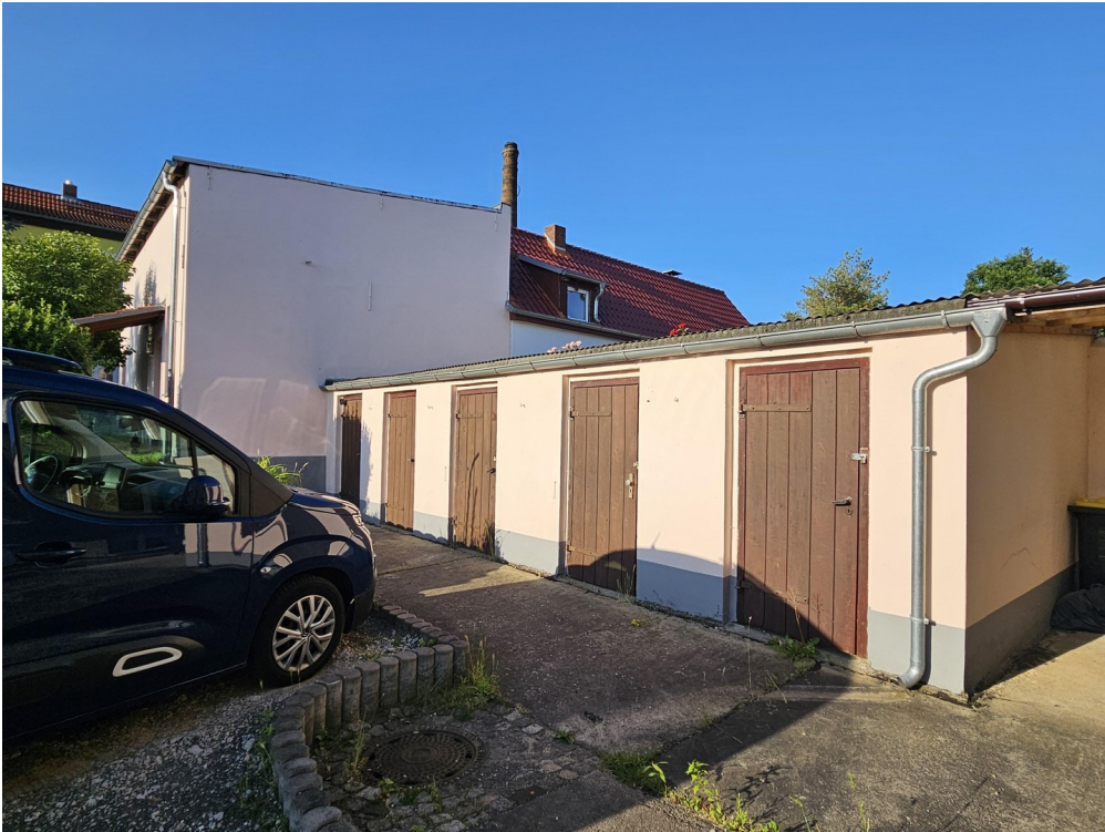
Abstellräume für Mieter