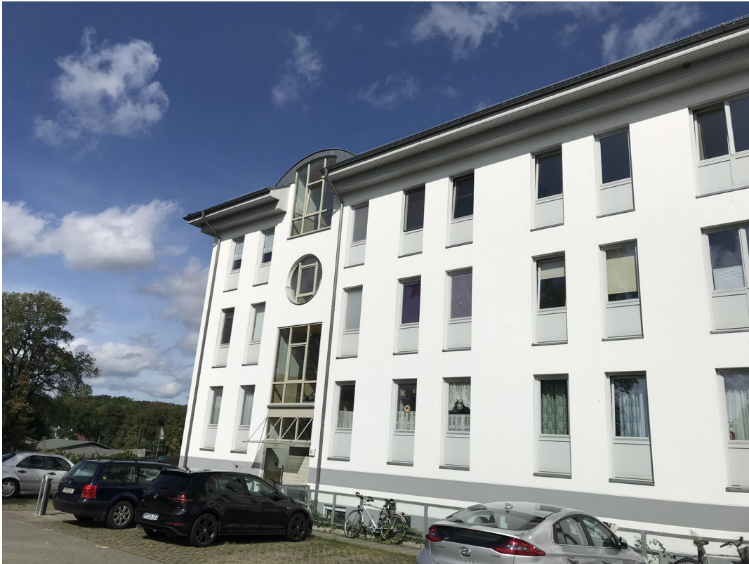
Haus von der Straße aus