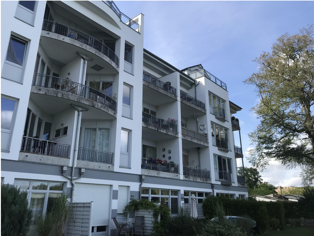
Haus vom Steg aus