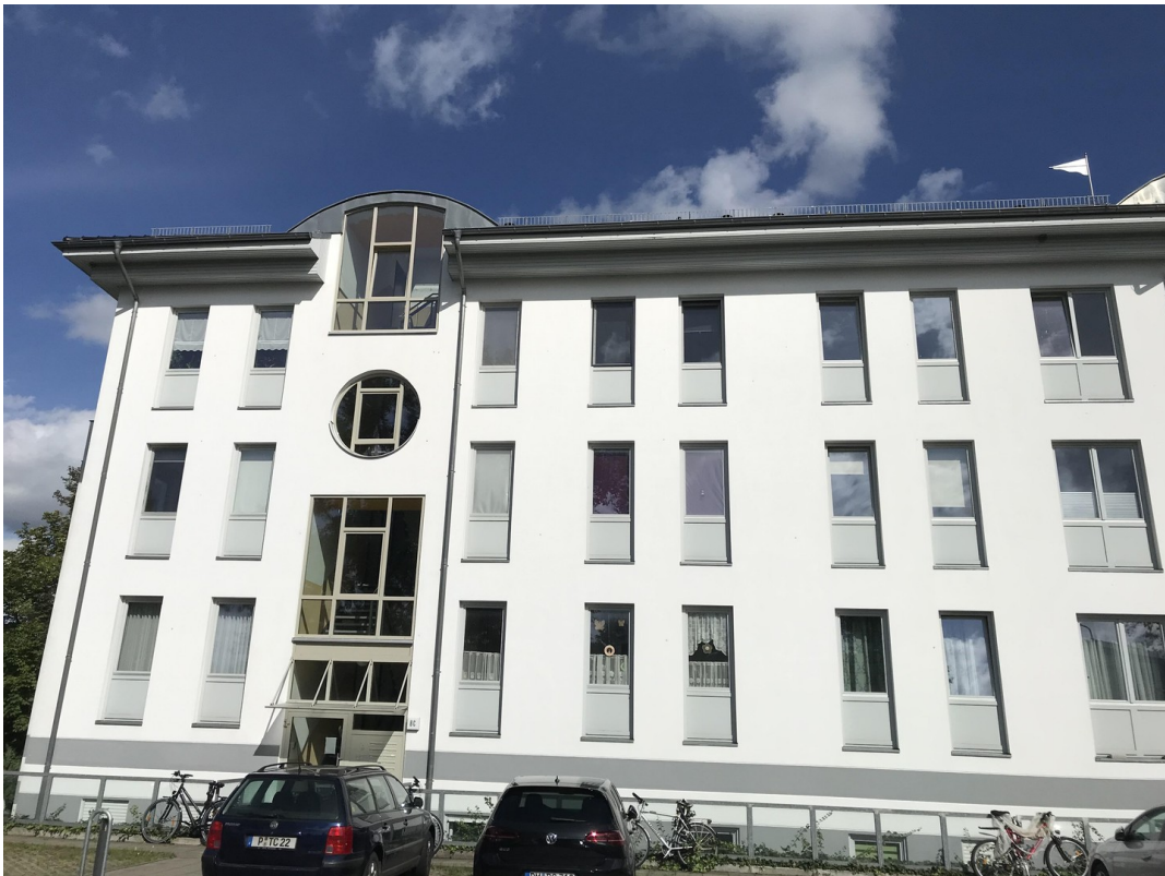
Haus von der Straße aus