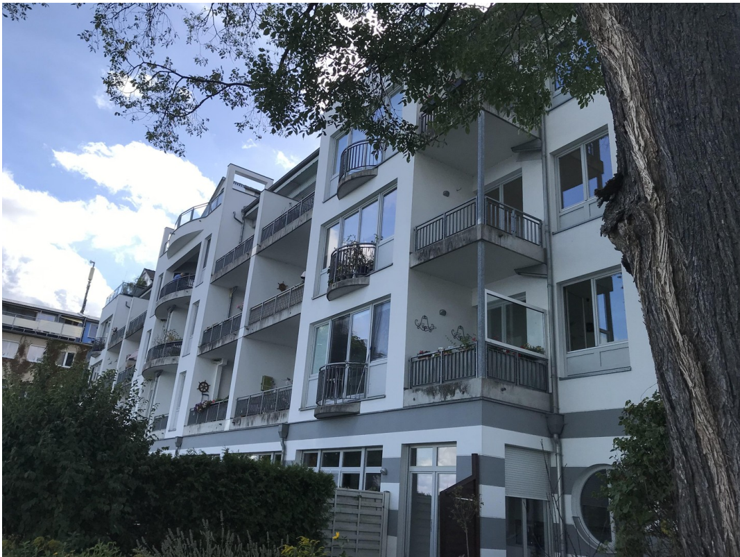
Haus vom Steg aus