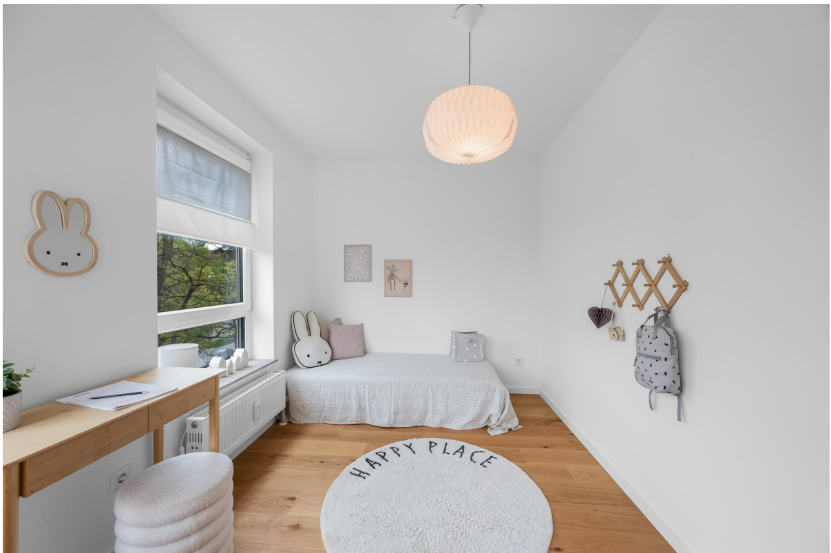
Viel Platz für die Kleinen