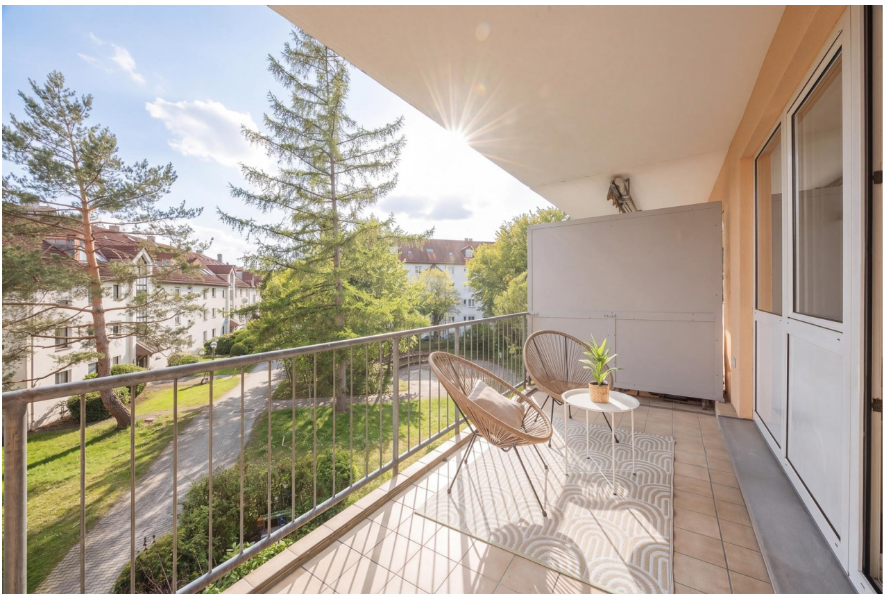
Balkon mit Süd-West Sonne