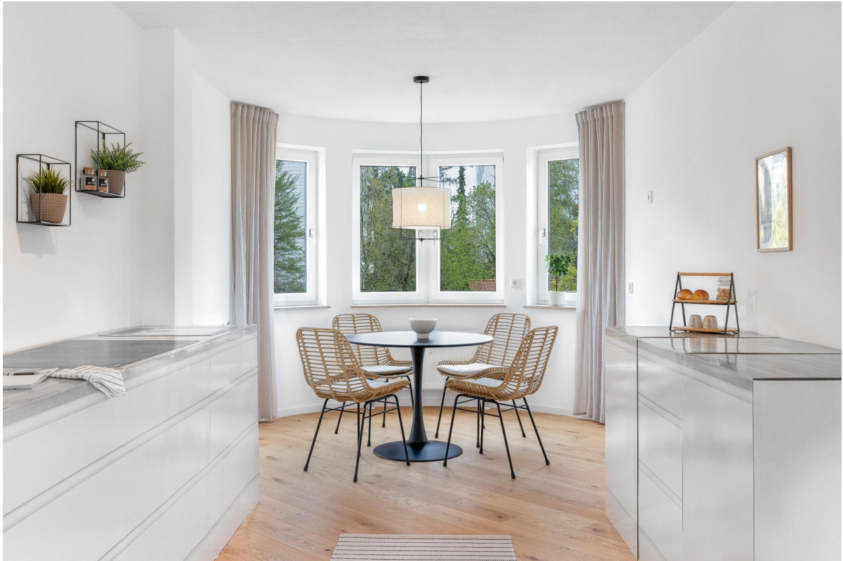
Essen im Erker