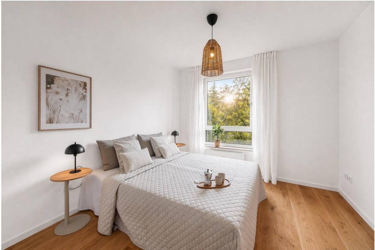
Schlafen mit Blick ins Grüne