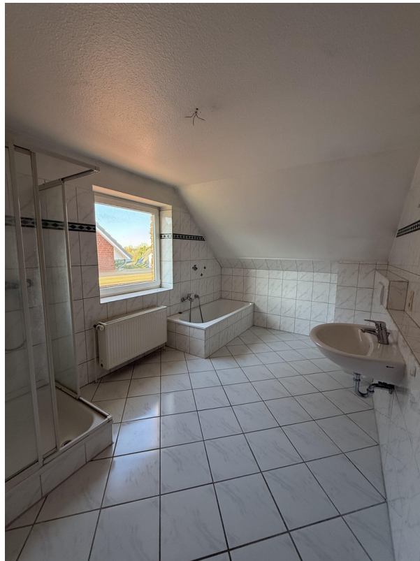
Vollbad im Obergeschoss