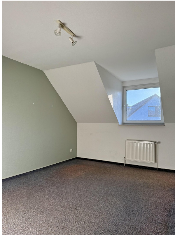
Zimmer 1 im Obergeschoss