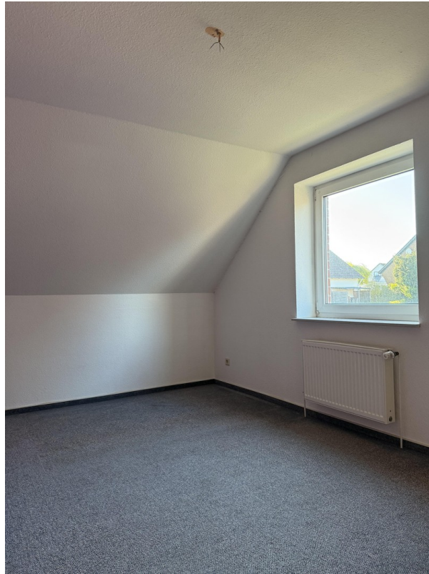
Zimmer 3 im Obergeschoss