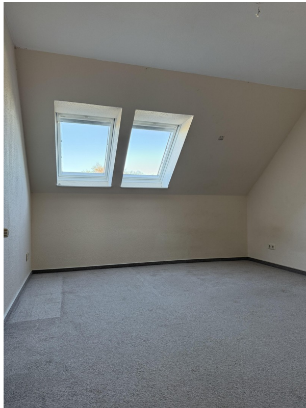
Zimmer 2 im Obergeschoss