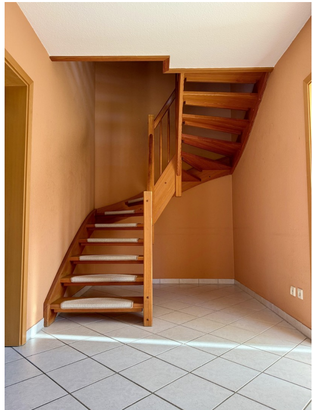
Treppe im Erdgeschoss