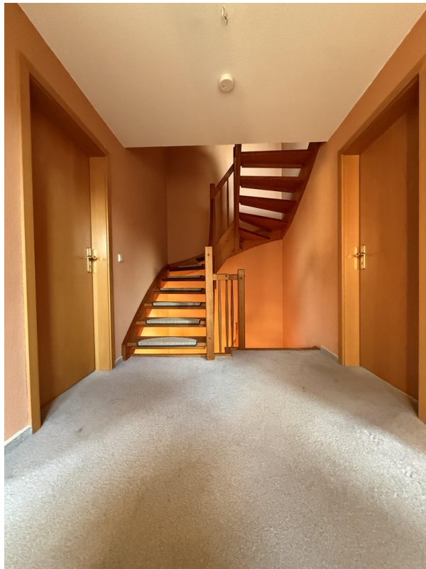
Treppe zum Spitzboden