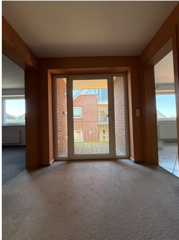
Blick zum Balkon