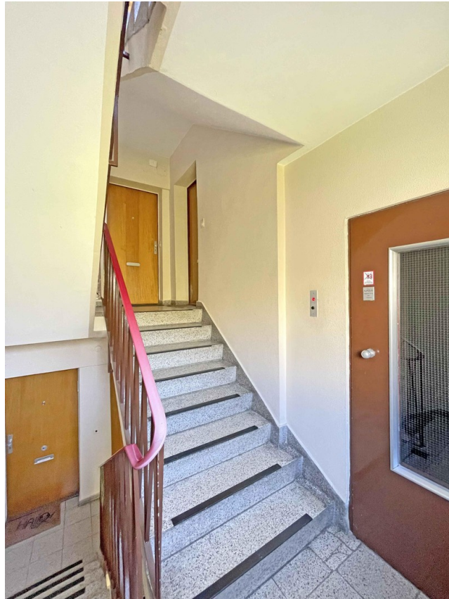
Treppenhaus mit Aufzug