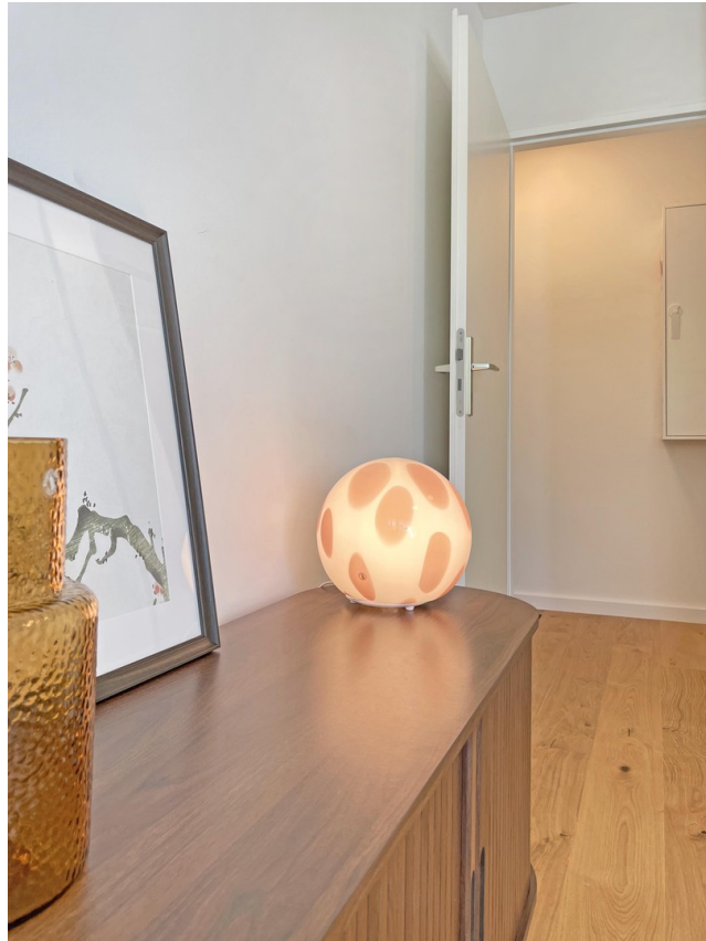
Wohnzimmer und Flur