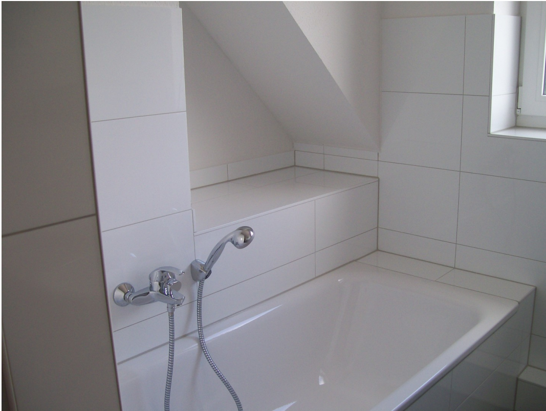
Badewanne mit Abseite