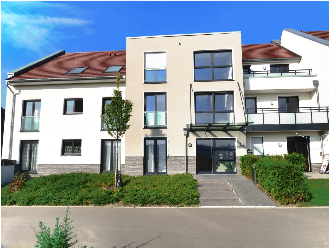
Hauseingang Haus 2d