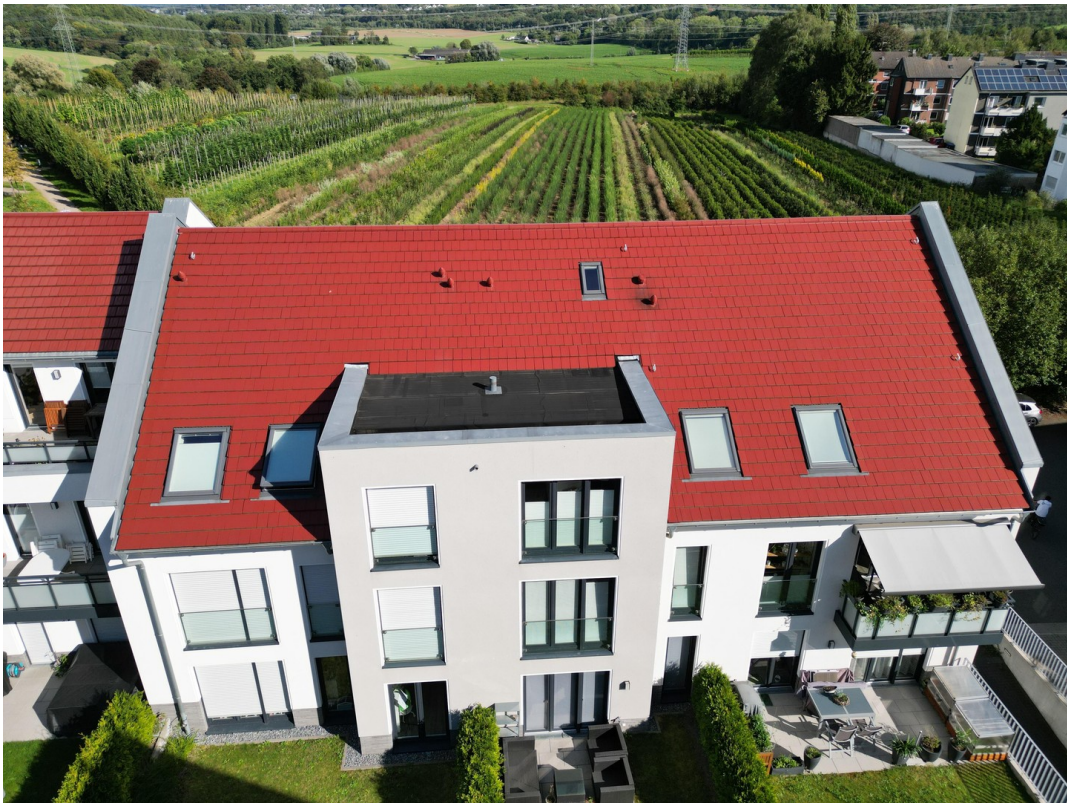
Rückseite Haus 2d