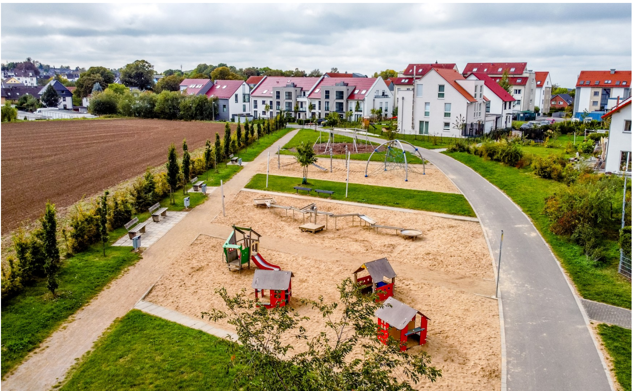
Spielplatz in Sichtnähe