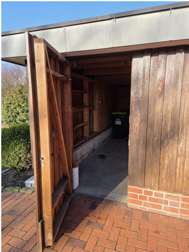
Abstellraum neben dem Carport