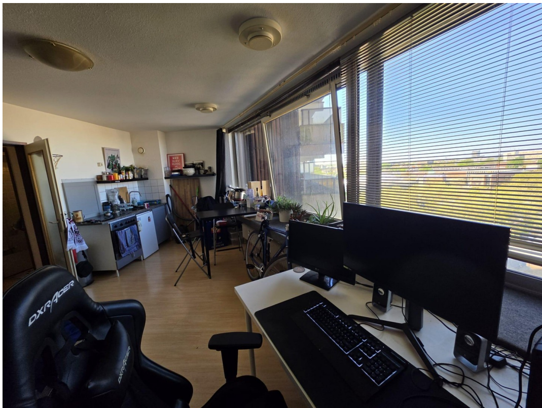
Wohnbereich mit Küchenzeile