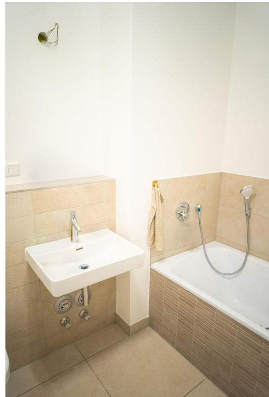
Bad 1 / Badewanne