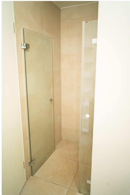
Bad 2 / Dusche