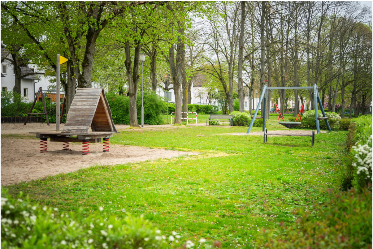
Spielplatz vor der Tür