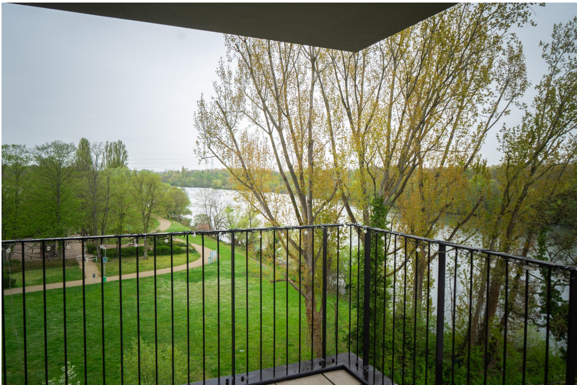
Balkon / Main-Blick