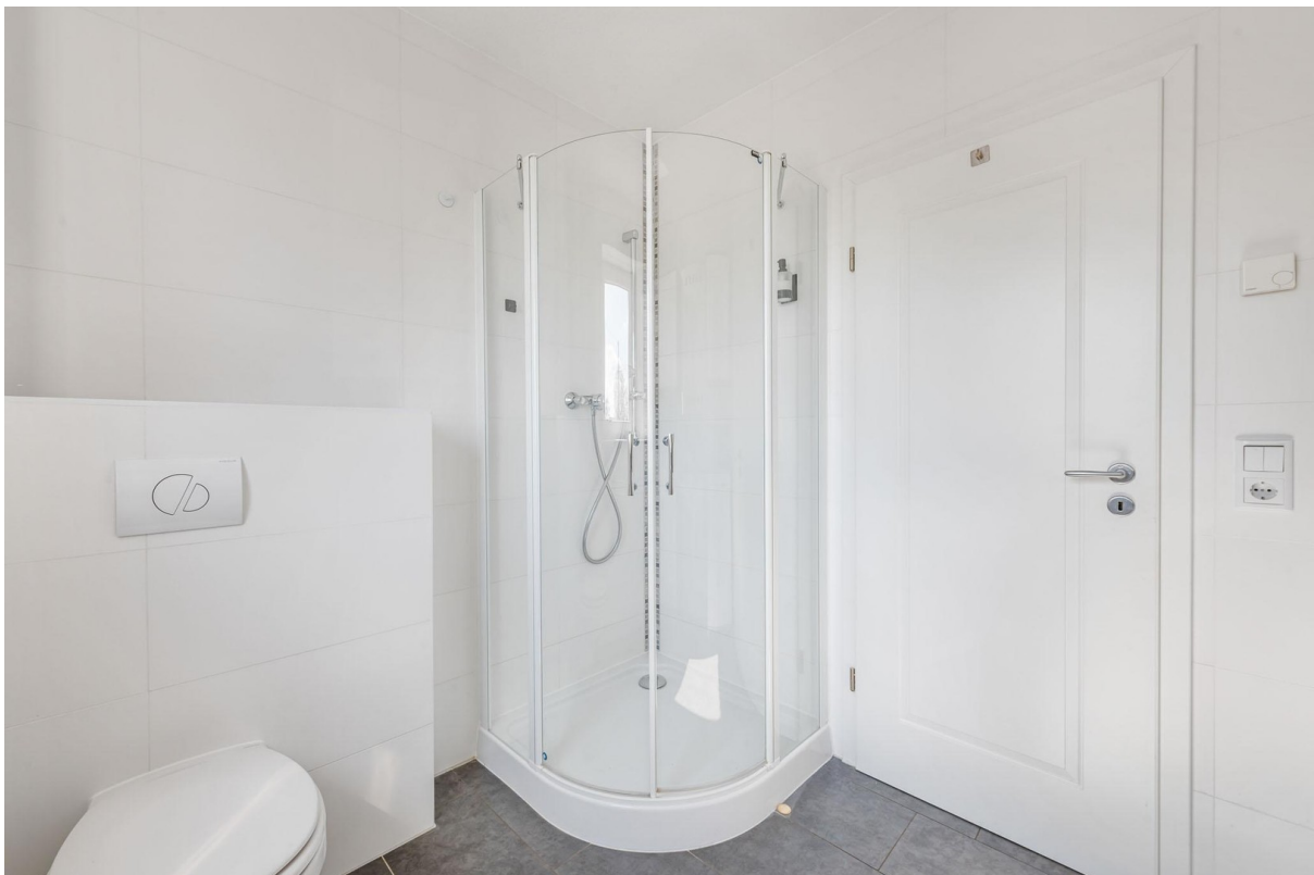
Duschbad Erdgeschoss Bild 2