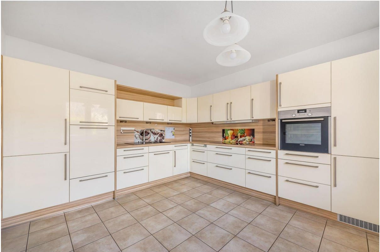
Einbauküche mit allen Geräten