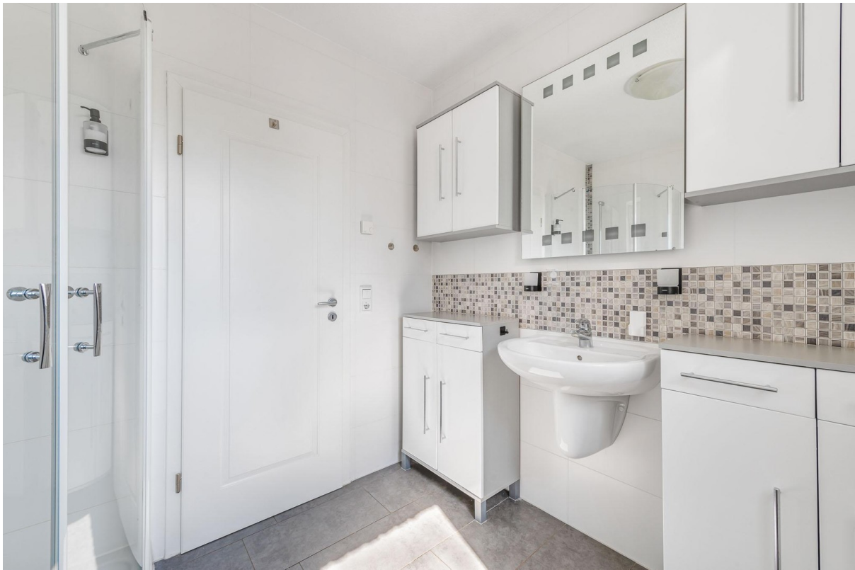
Duschbad Erdgeschoss Bild 1