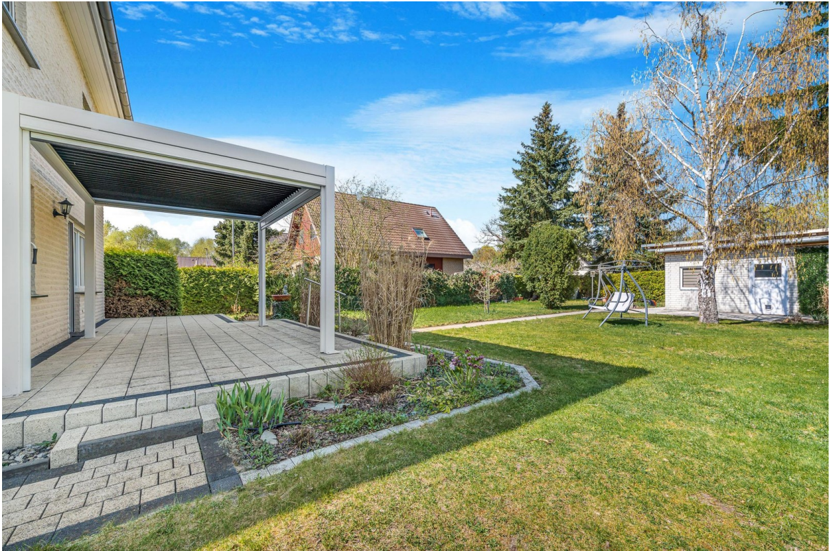
Garten und Gartenhaus