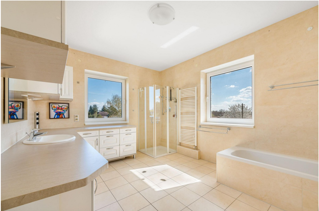
Vollbad im Obergeschoss