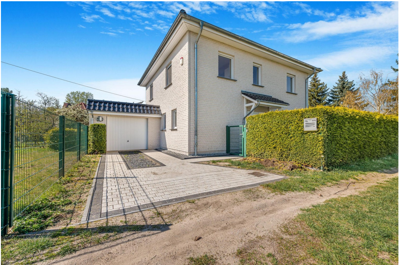
Hausansicht Eingang / Garage