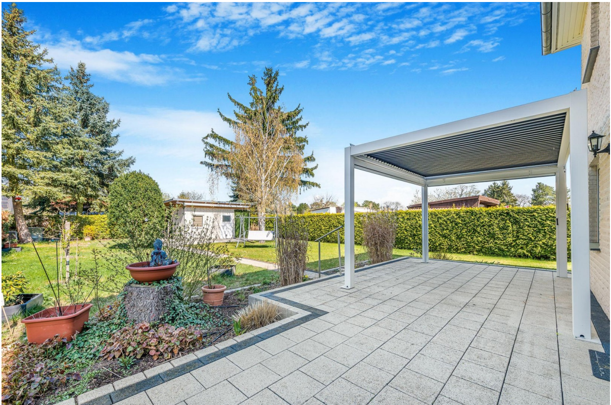
Terrasse mit Überdachung