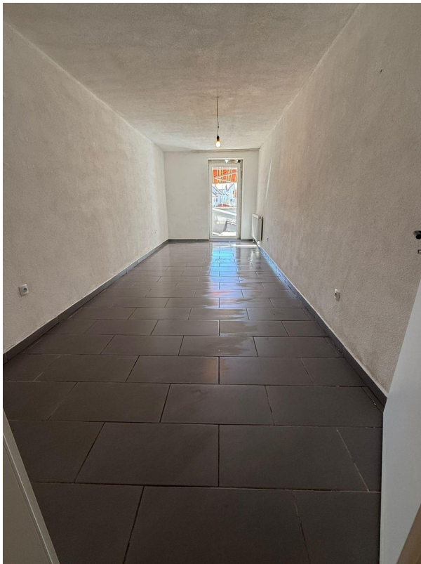
Schlafzimmer 1 mit Terrasse