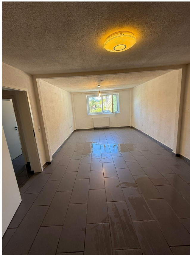
Küche / Wohnbereich