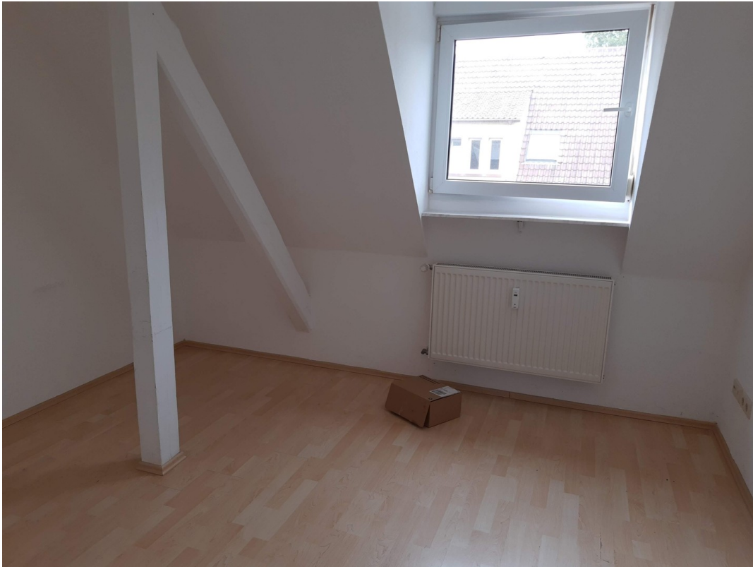
Zimmer vorne links