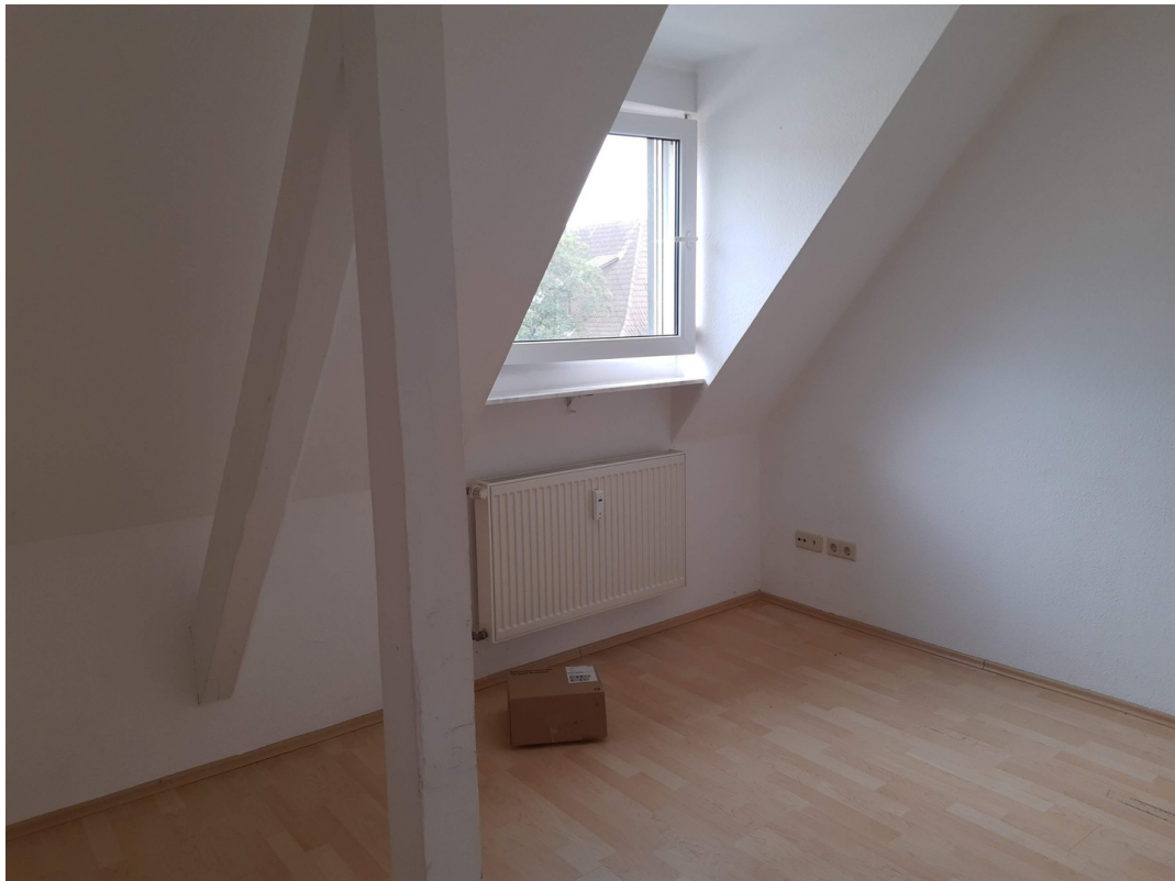
Zimmer vorne links