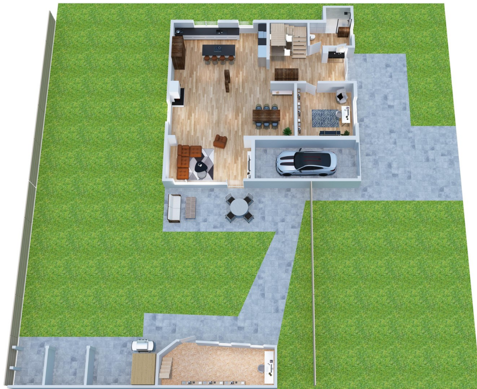
Gesamtgrundstück + Tonstudio