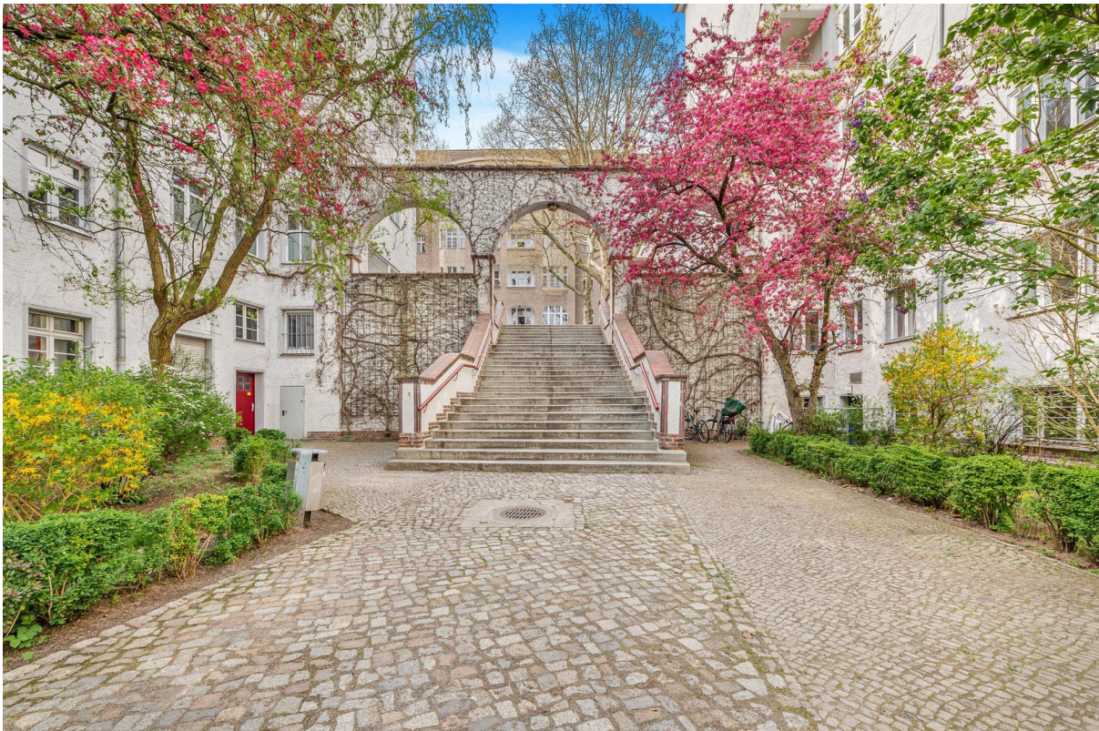
Zugang zum Hauseingang