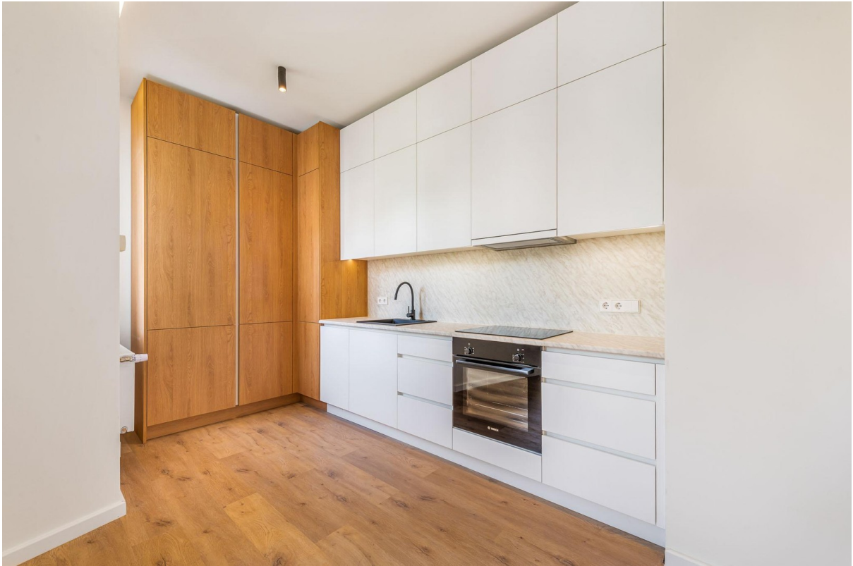
Einbauküche / -schränke