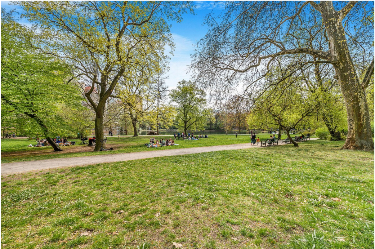
Lietensee / - park