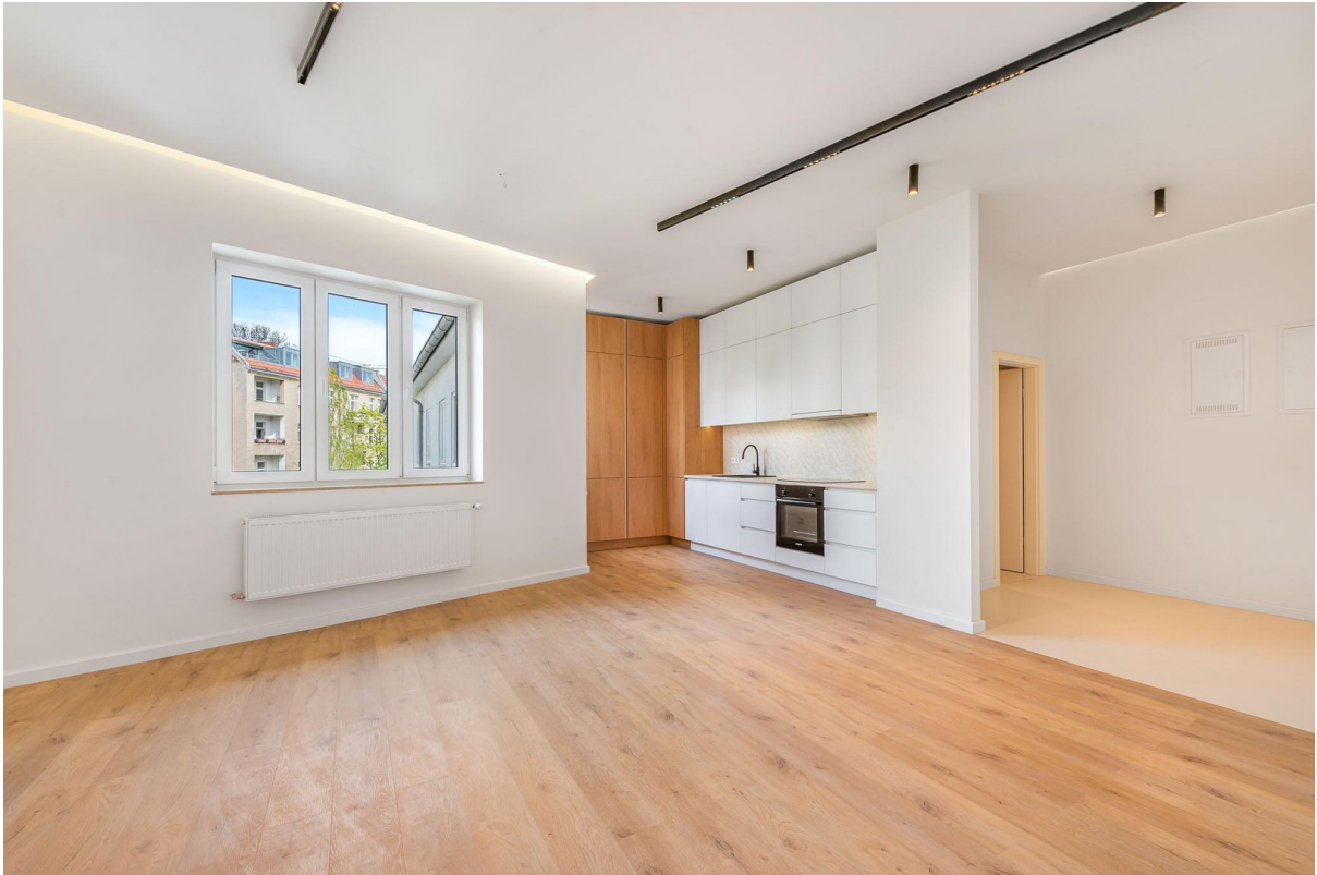
wohnen / Flur