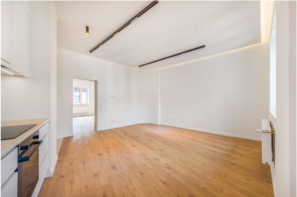
wohnen / essen