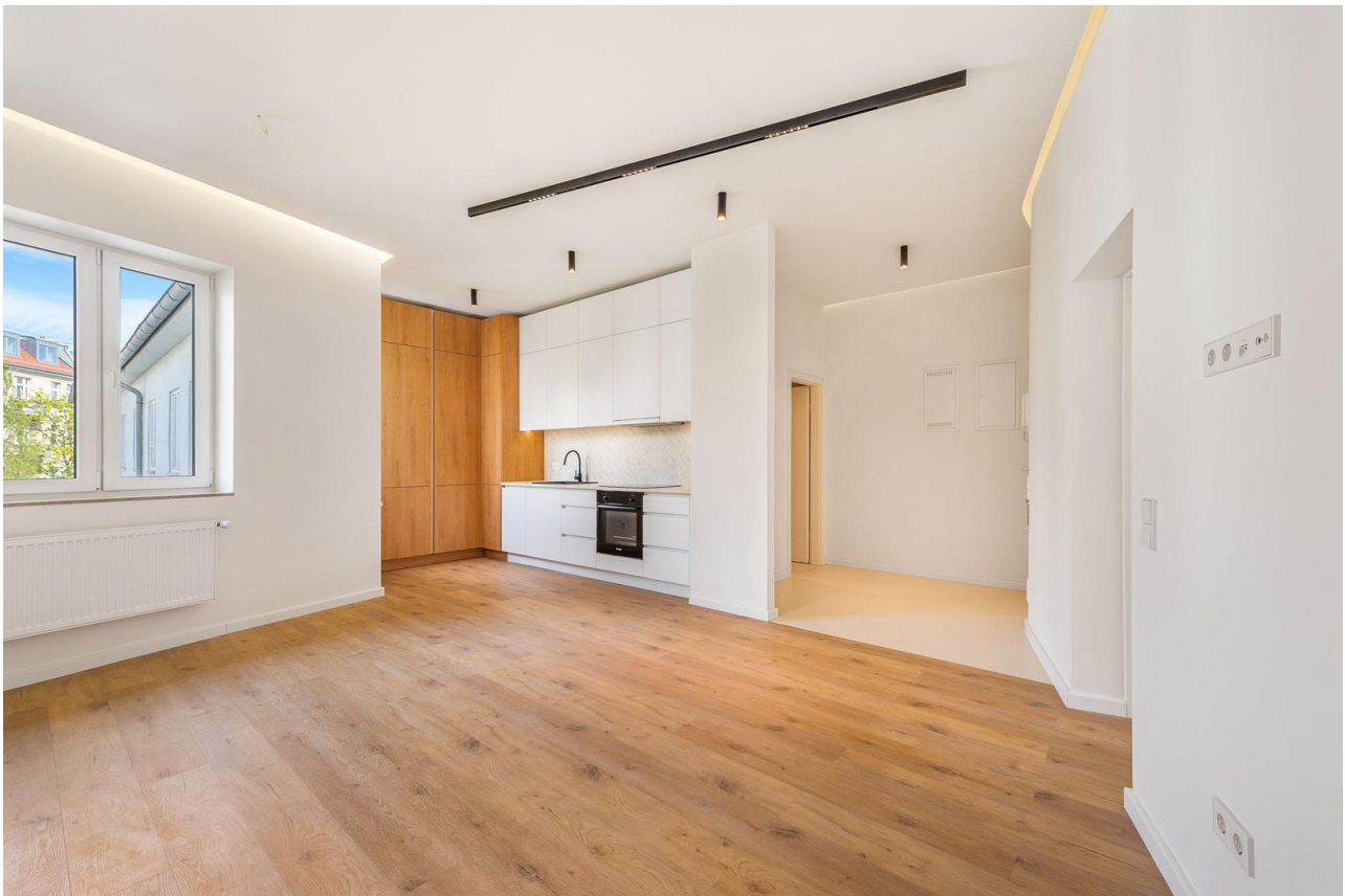
Küche / wohnen