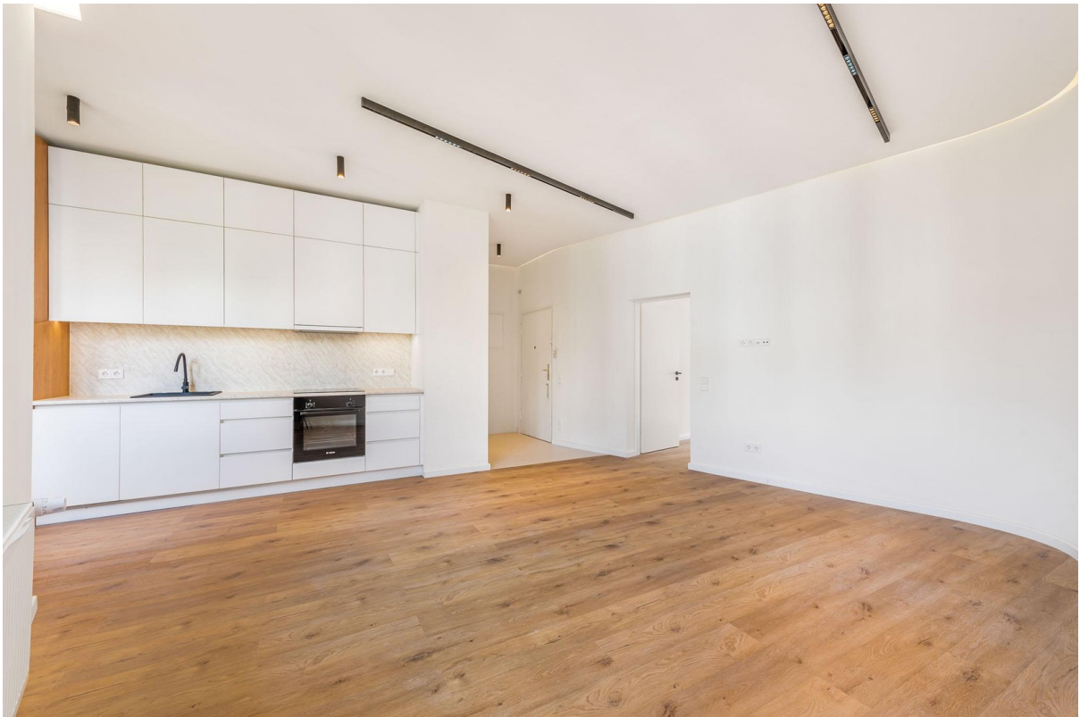
essen / wohnen