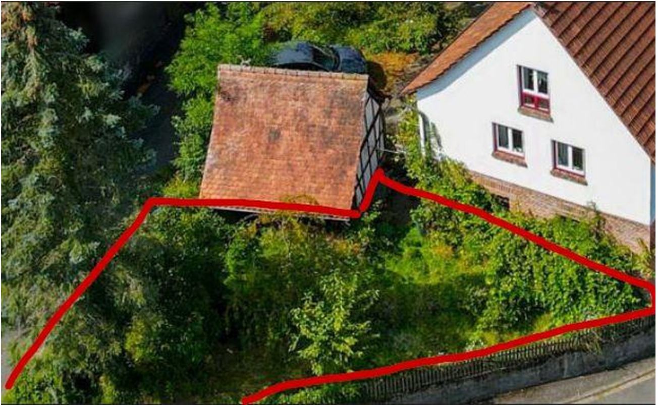
Reihendhaus mit Garten