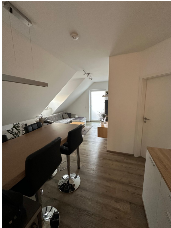
Ess- und Wohnzimmer