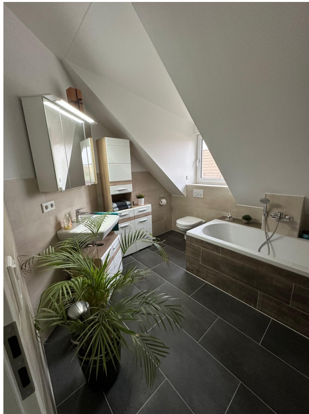
Badezimmer mit Wanne & Dusche