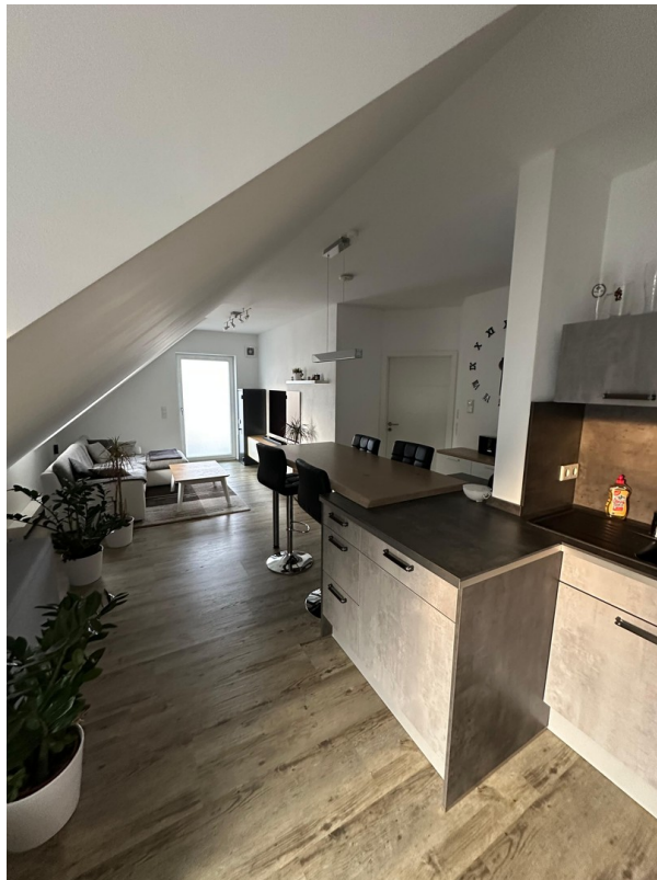
Ess- und Wohnzimmer