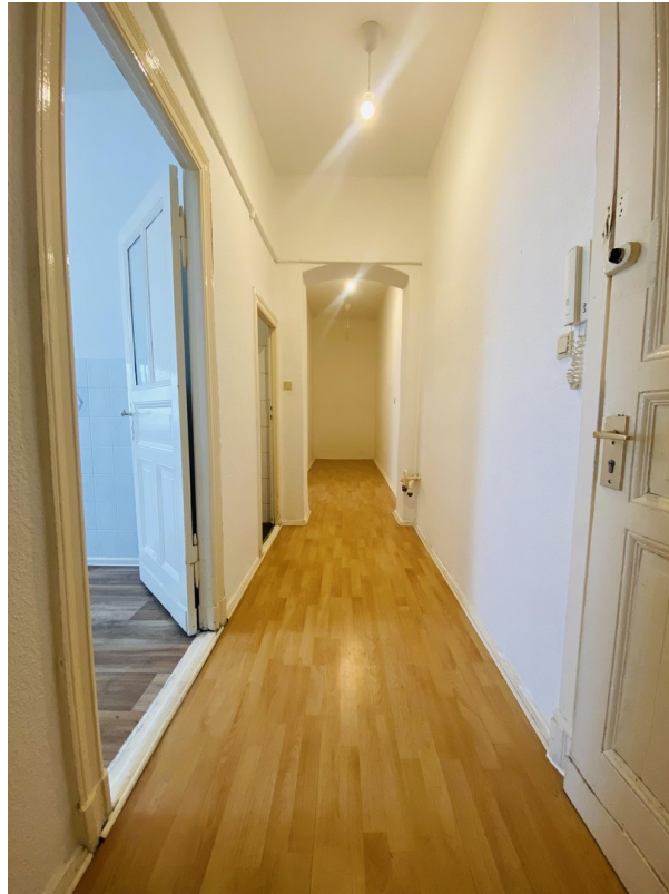
Flur mit Abstellkammer