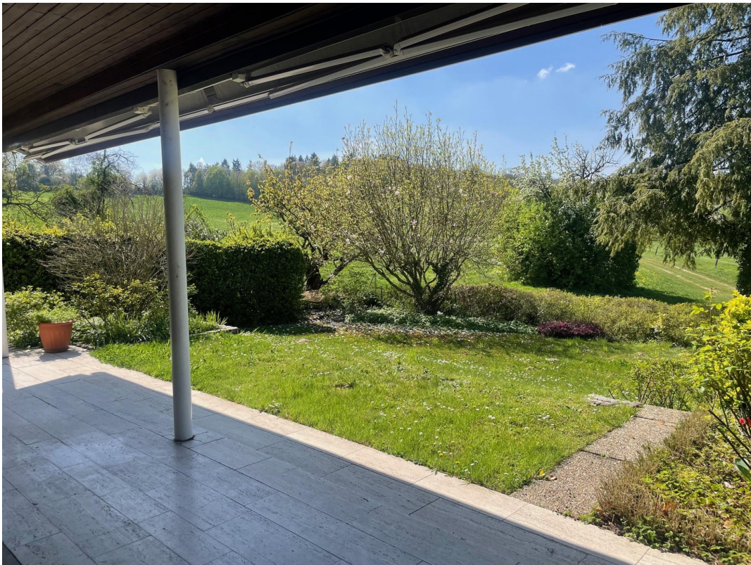
Blick von Terrasse in Garten