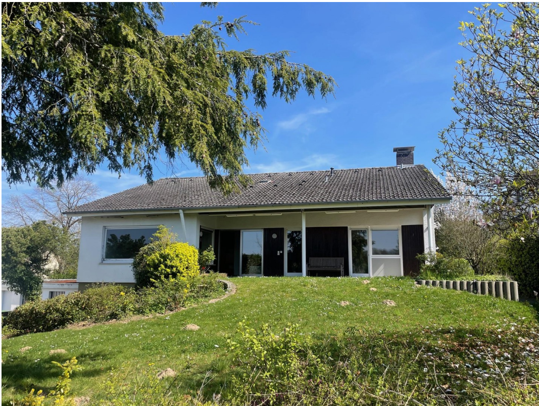
Ansicht Gartenseite West