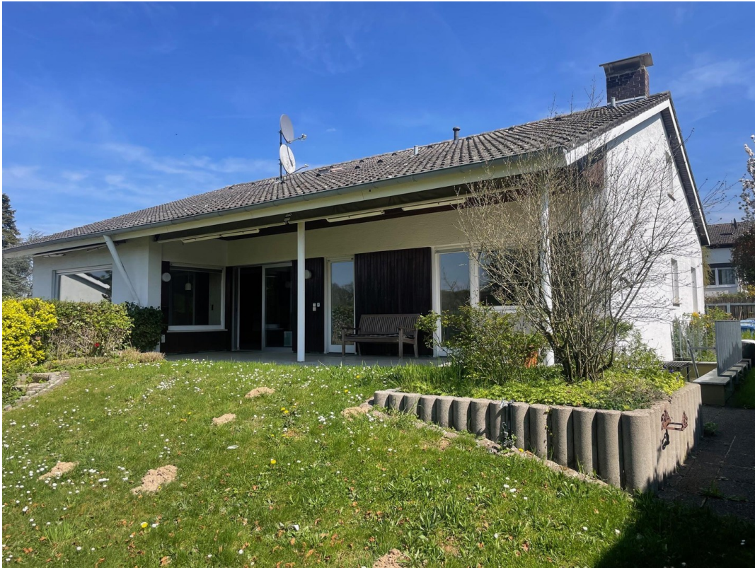
Ansicht Gartenseite Süd-West