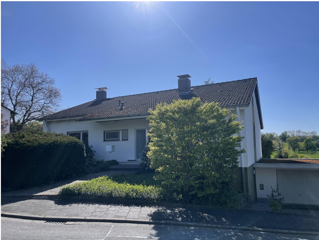
Ansicht zum Eingang Ostseite