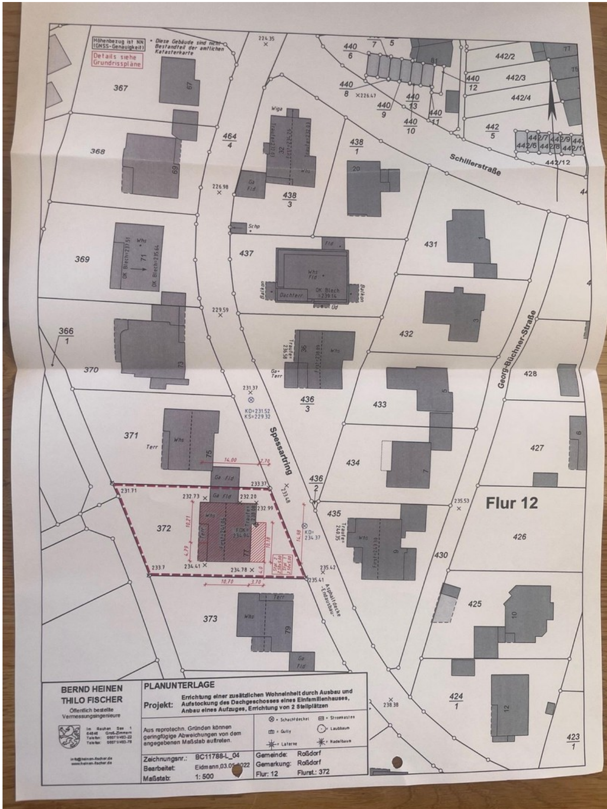
Flurkarte mit Ausbauplan