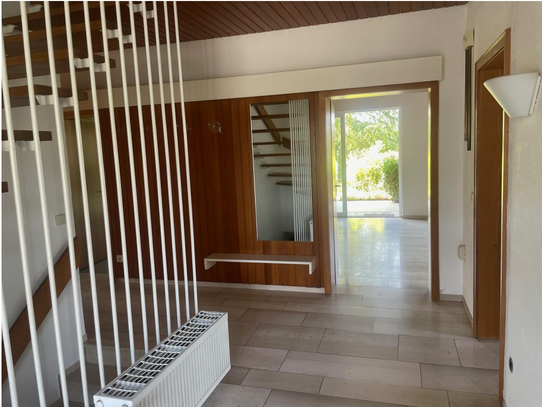
Flur (Blick von Hauseingang)