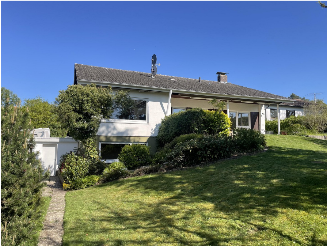
Ansicht Gartenseite West