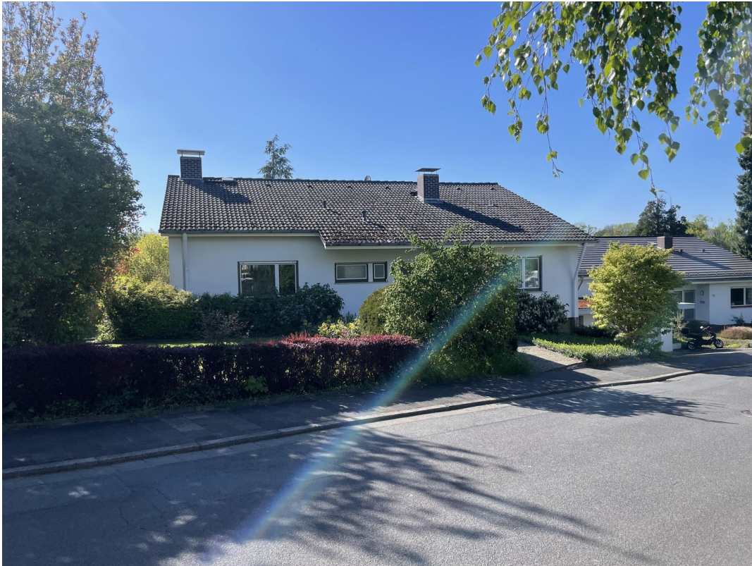
Ansicht Vorgarten Ostseite