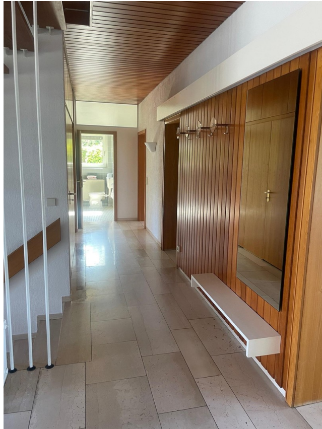
Flur (mit Blick zum Bad)