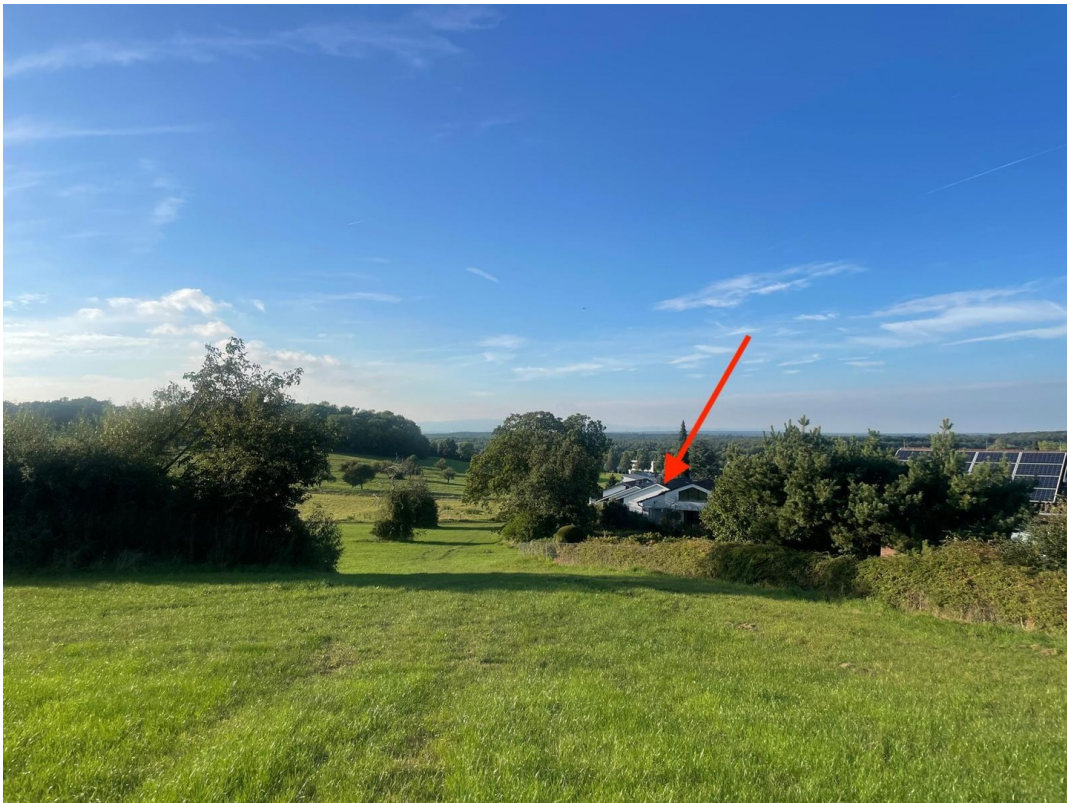
Lagefoto mit Markierung