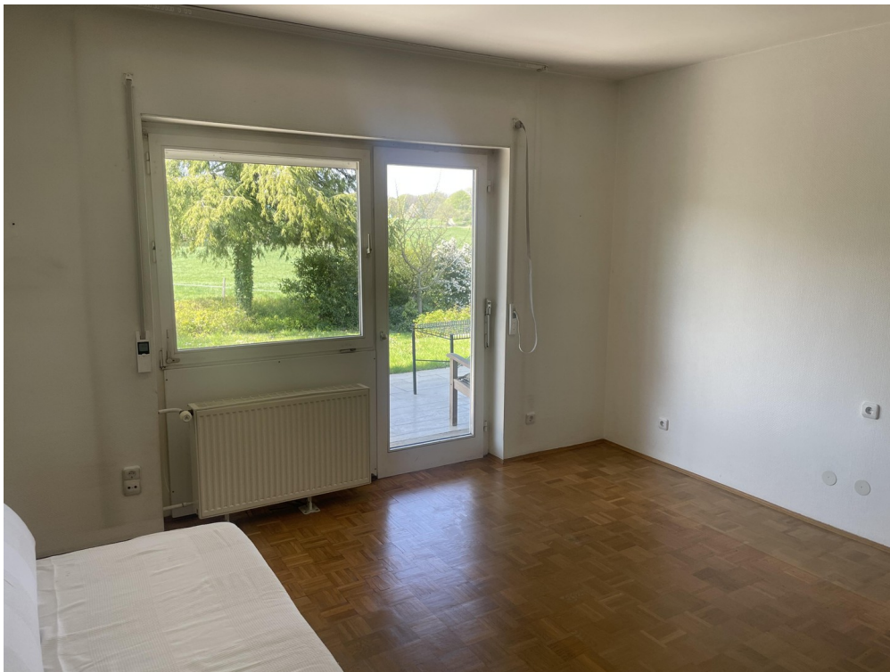
Schlafzimmer zur Terrasse