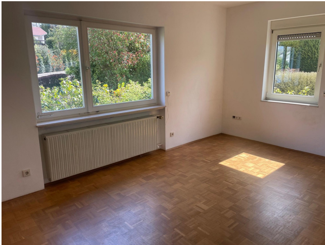
ein Arbeits- / Kinderzimmer