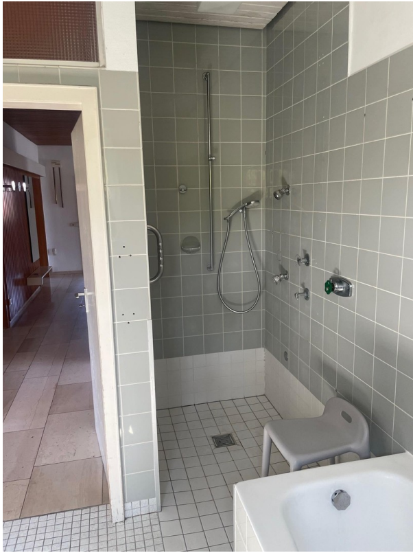
Bad - Dusche