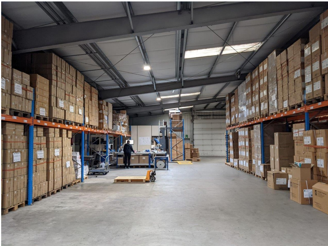
Lager - Wareneingang