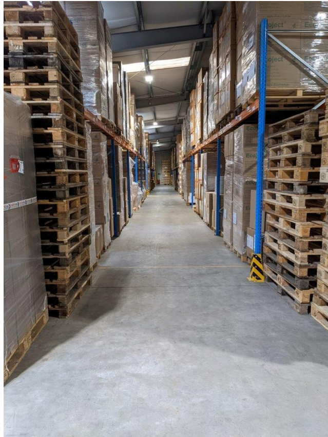
Lager - Regalreihen