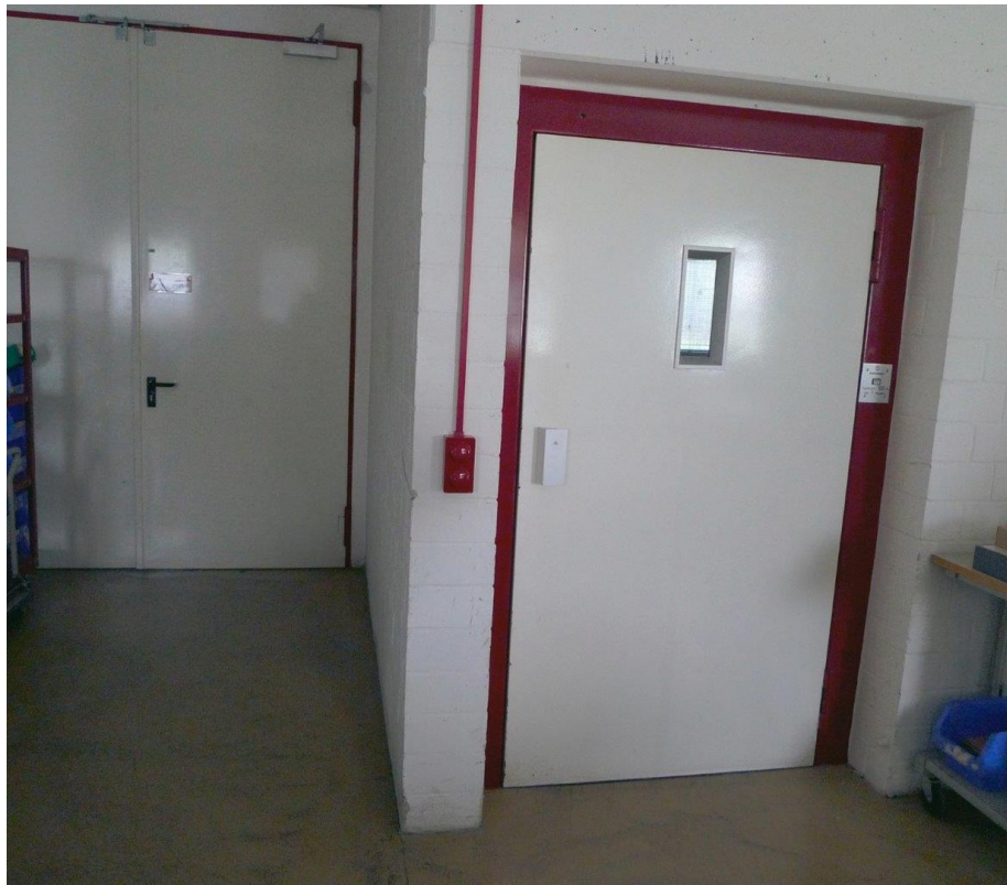
Lastenaufzug 1 t / 11 Pers.