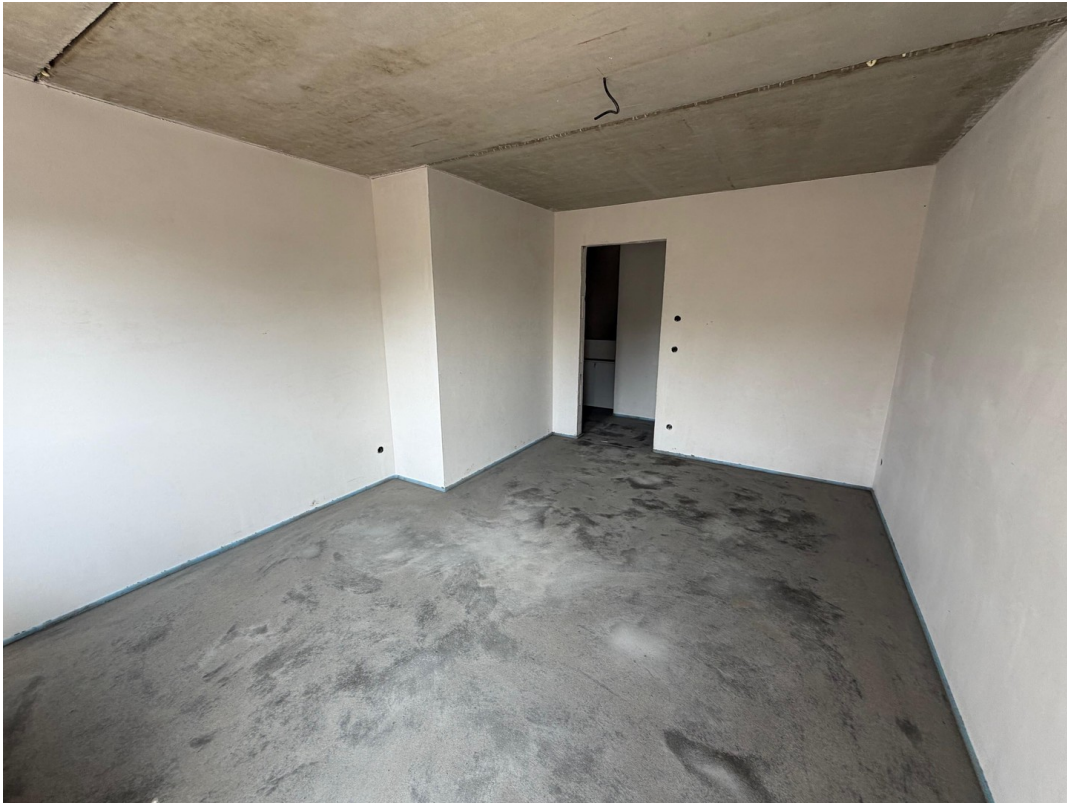
1. OG Schlafzimmer