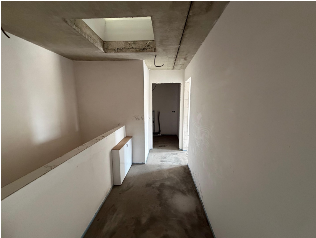
1. OG Flur