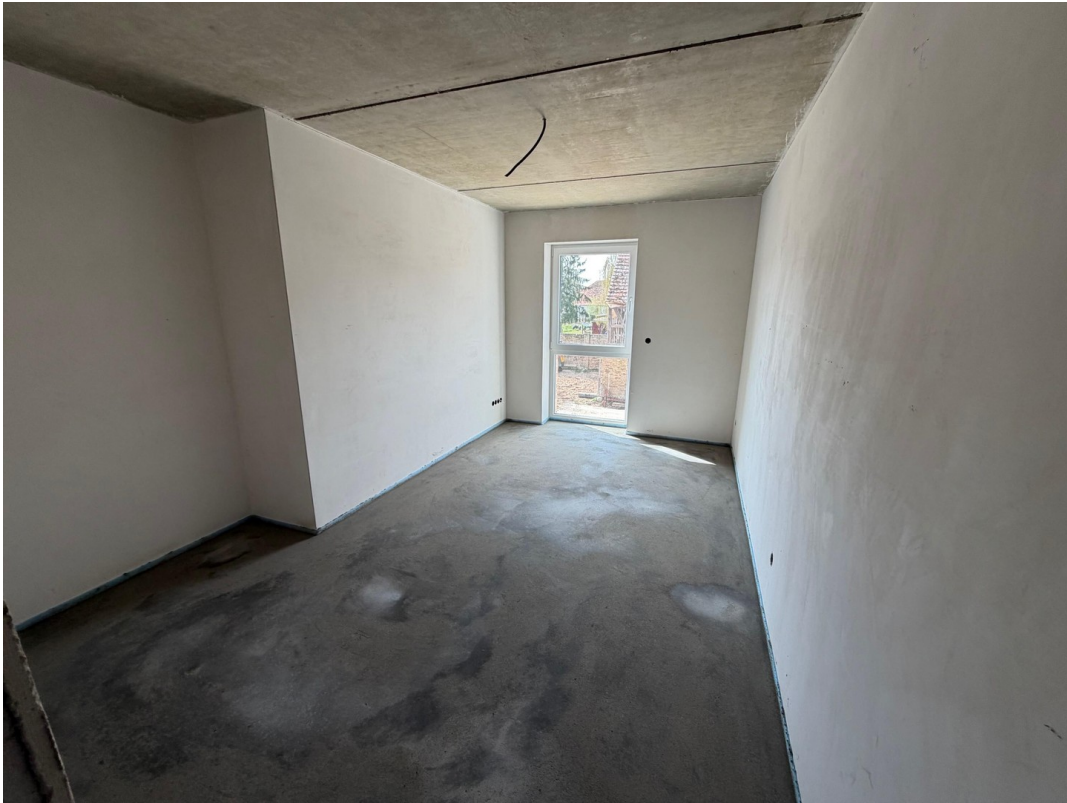
1. OG Kinderzimmer