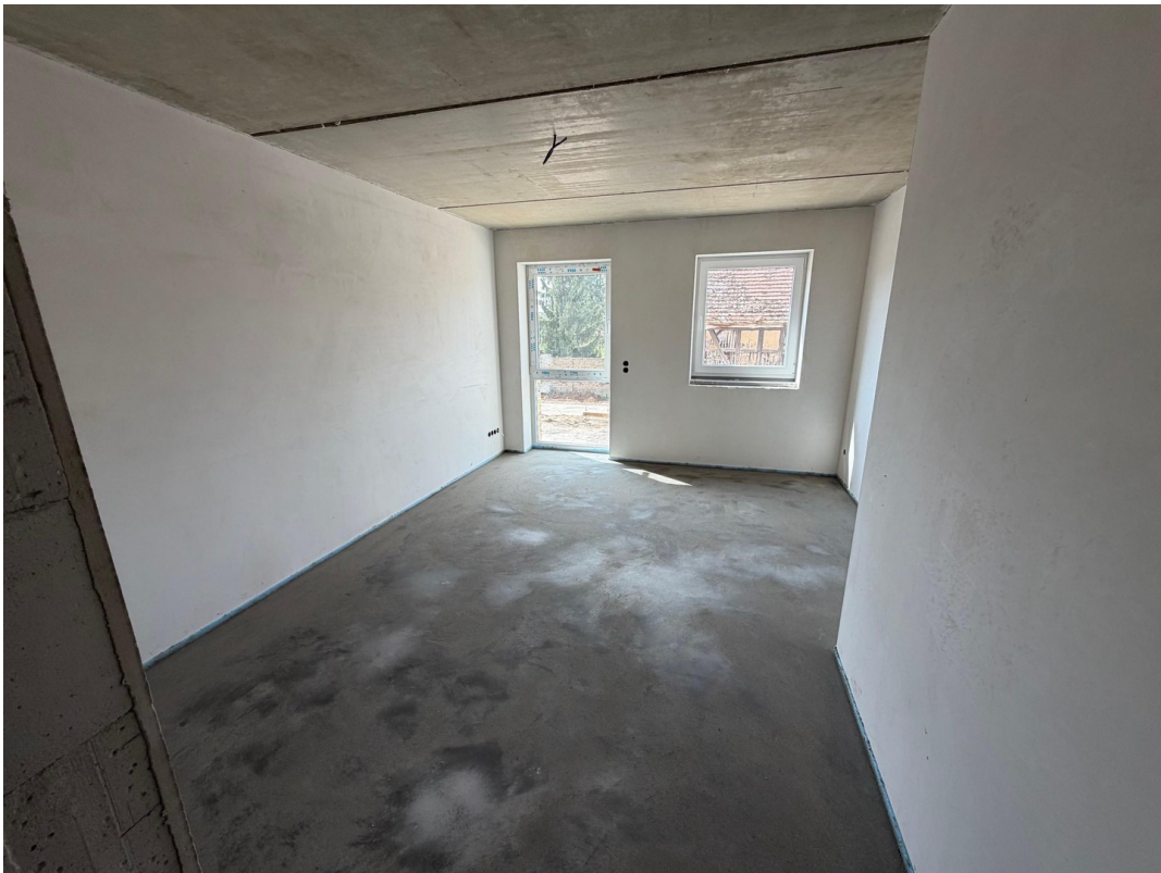
1. OG Schlafzimmer