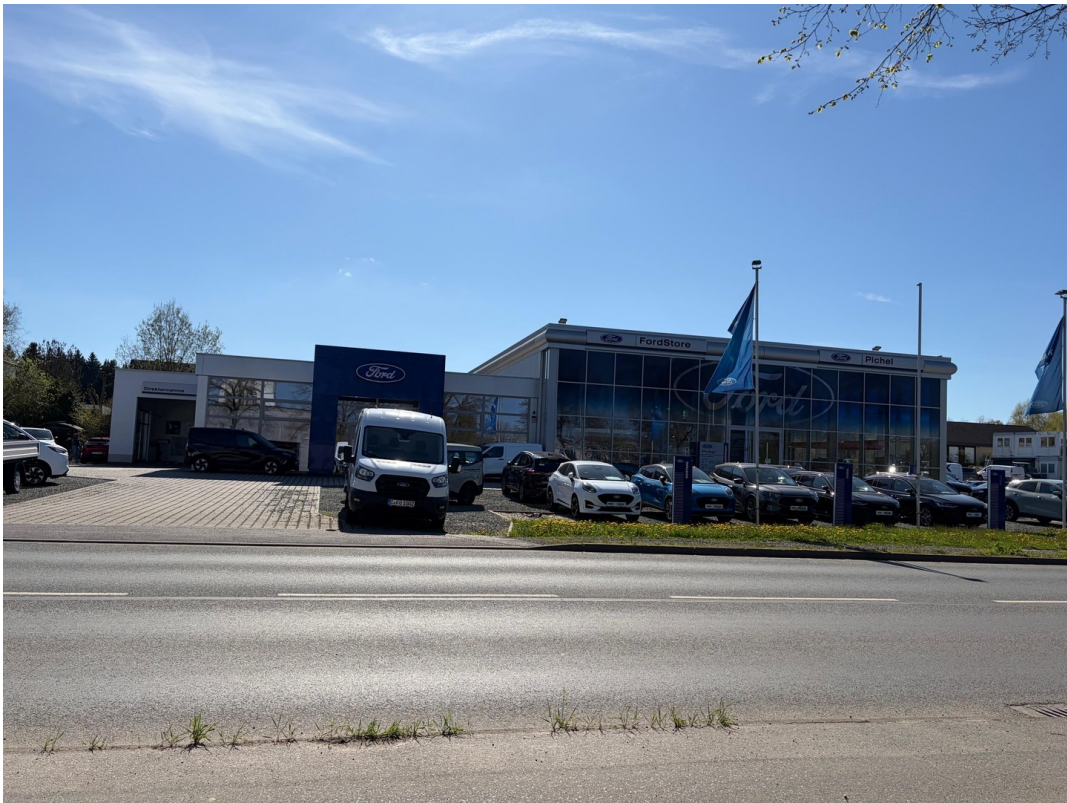
Ansicht von links