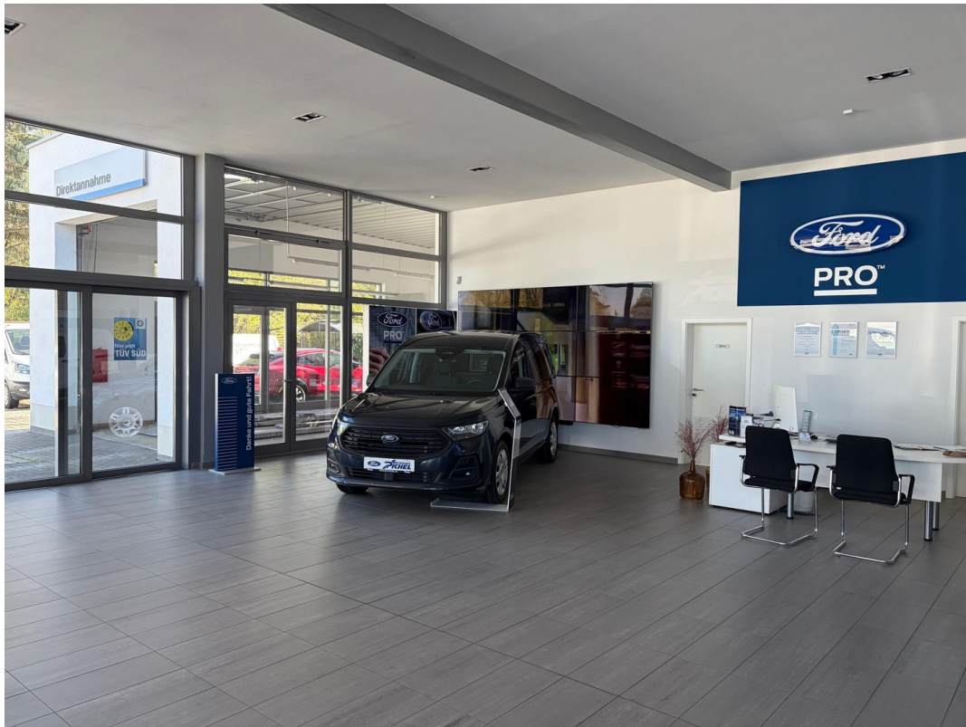
Ausstellung mit Direktannahme