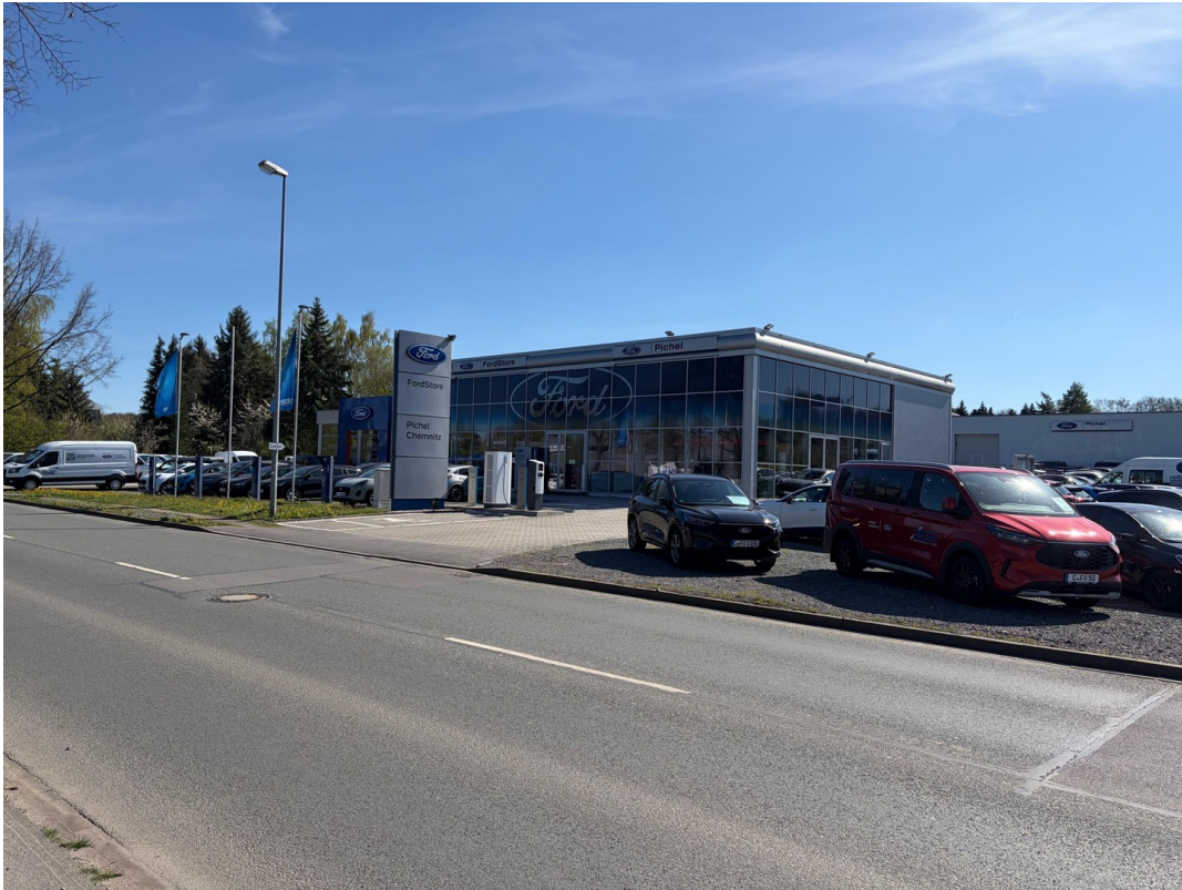
Ansicht von rechts 1