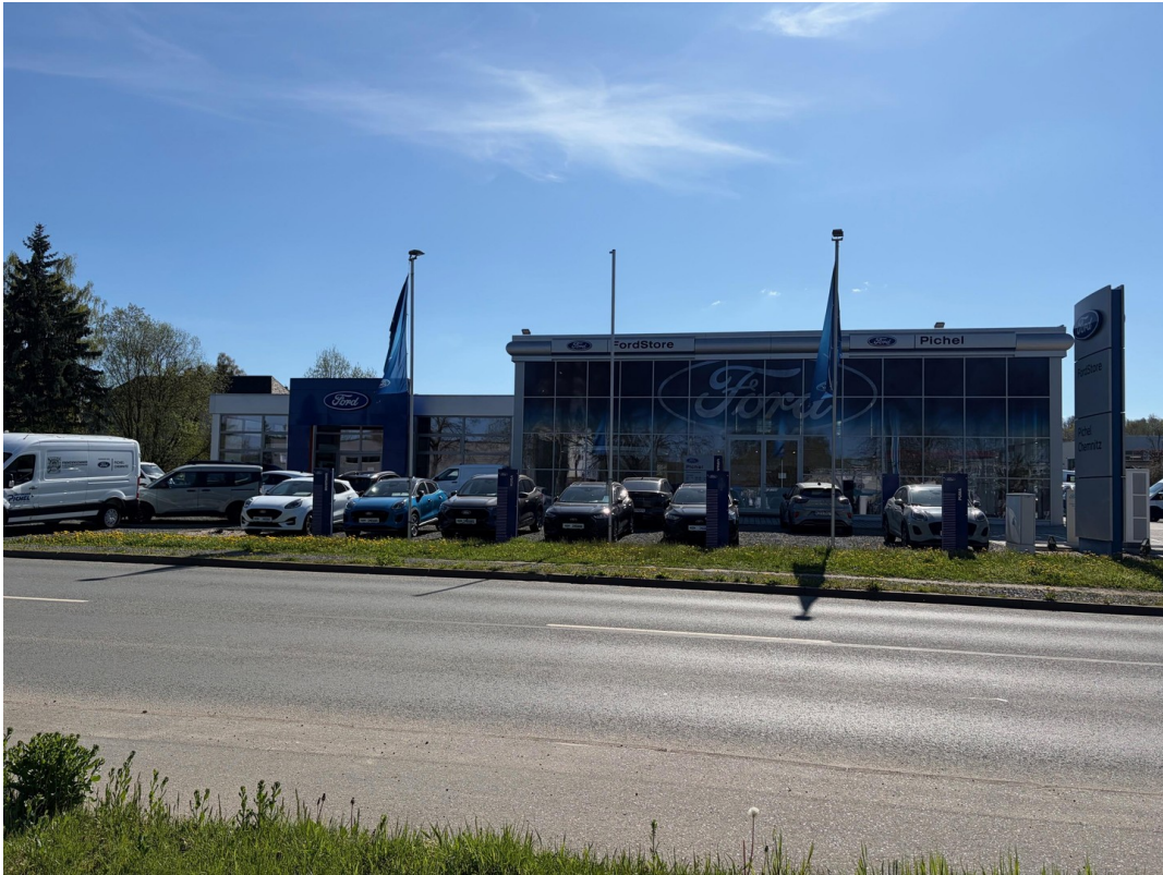
Ansicht von vorne 2