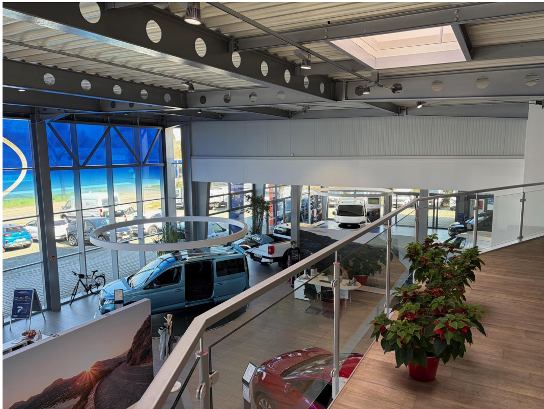
Ansicht von Empore nach rechts