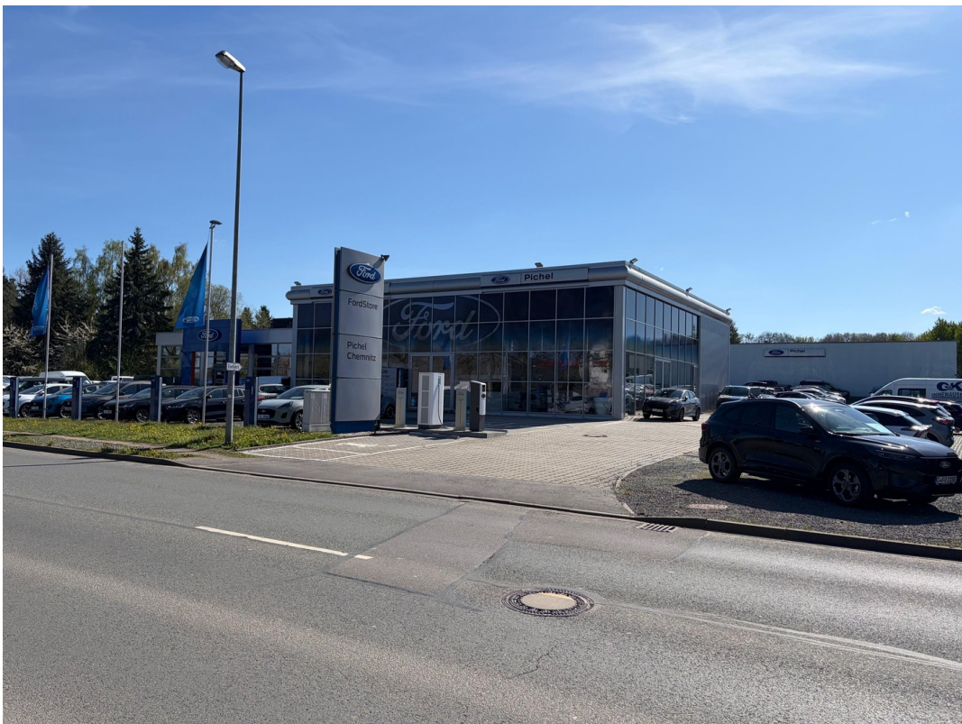
Ansicht von rechts 2