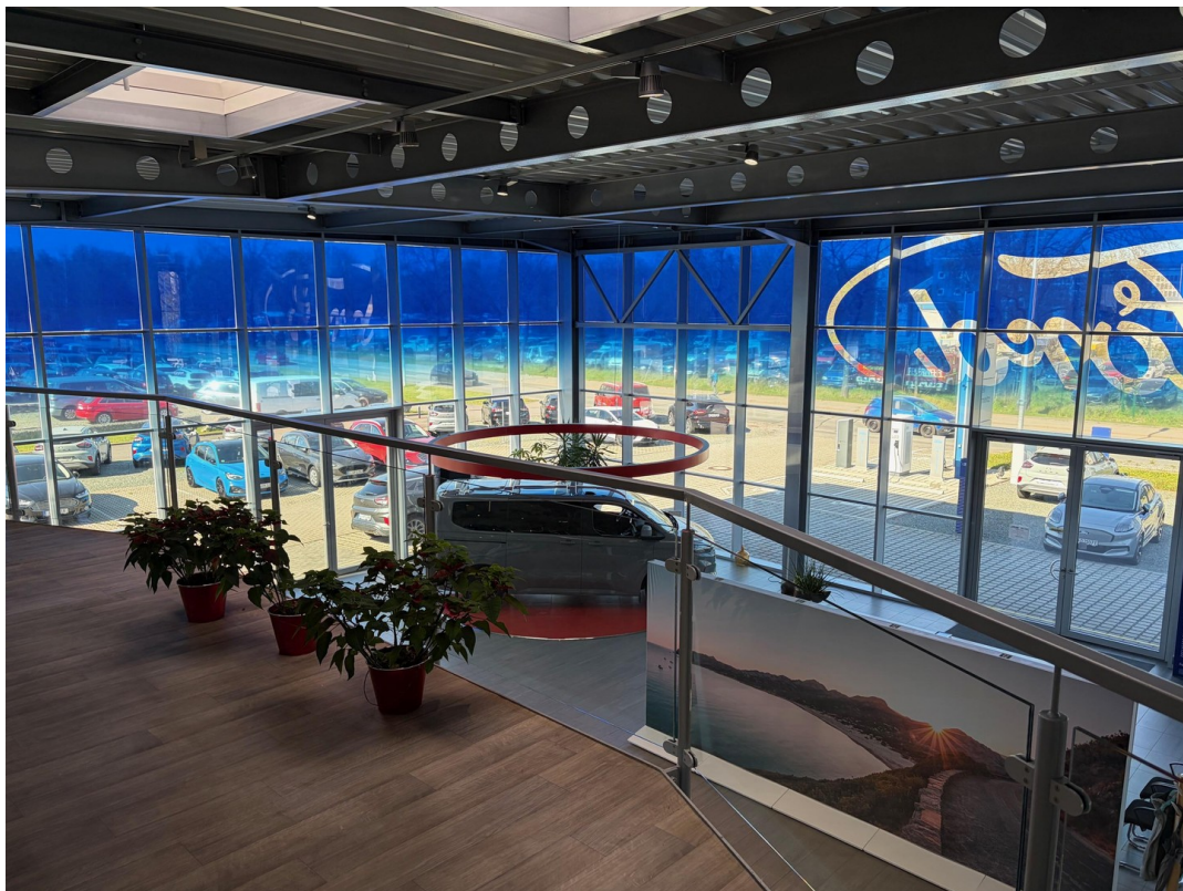
Ansicht von Empore nach links