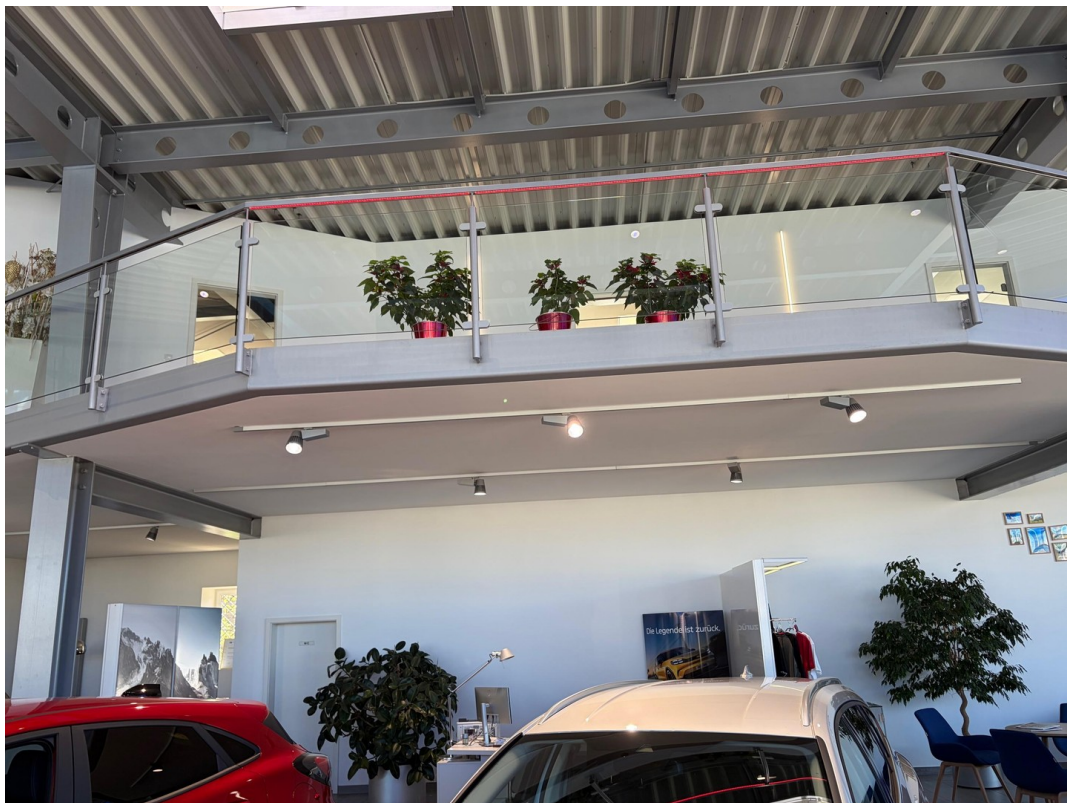
Ansicht auf Empore