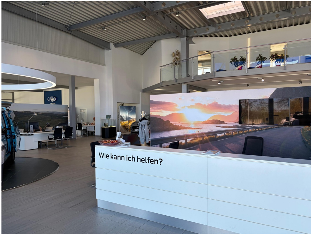
Ansicht innen Empfang