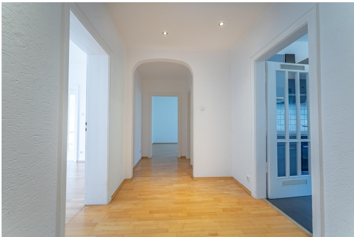
Zugang zu Küche & Wohnbereich