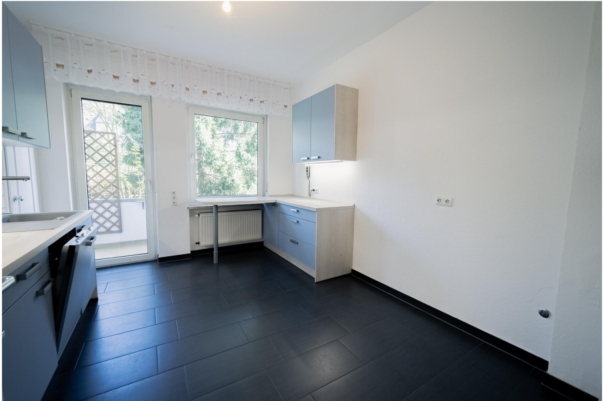
Küche 2 - Zugang zu Balkon