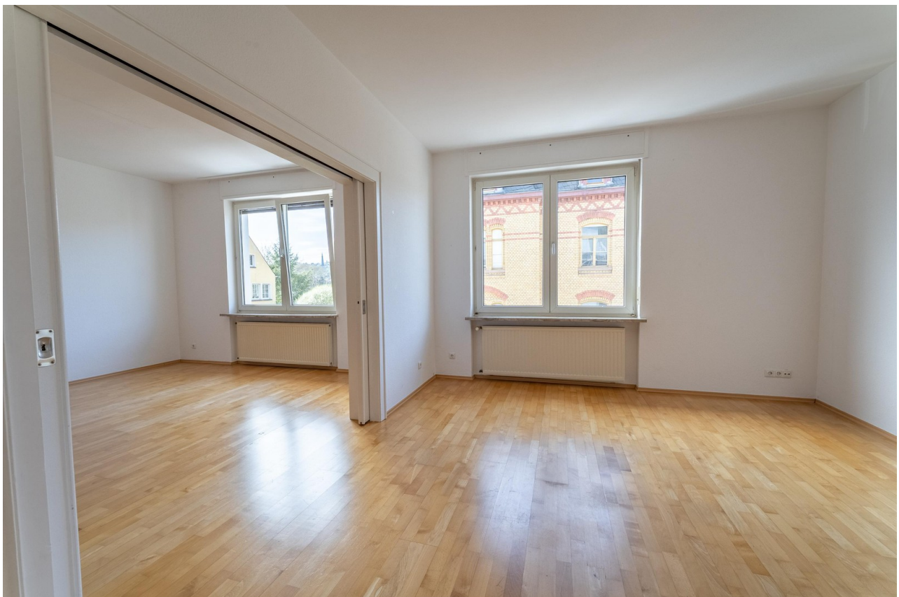
Wohn- & Esszimmer 2