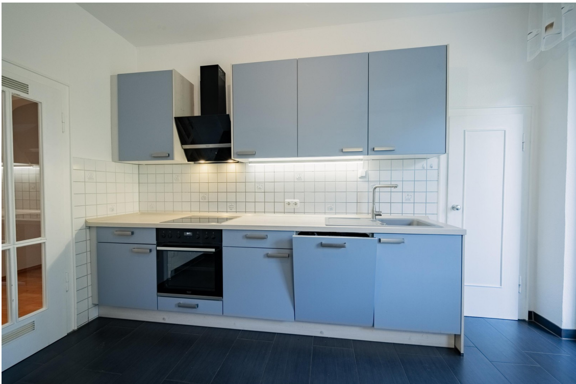
Küche 1 - optional