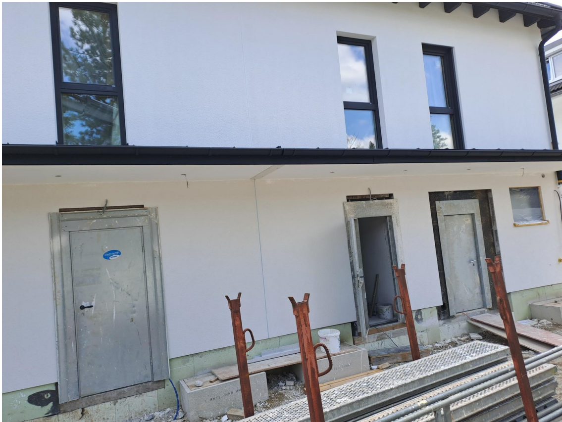
Gebäude-Nordseite in Ausbau