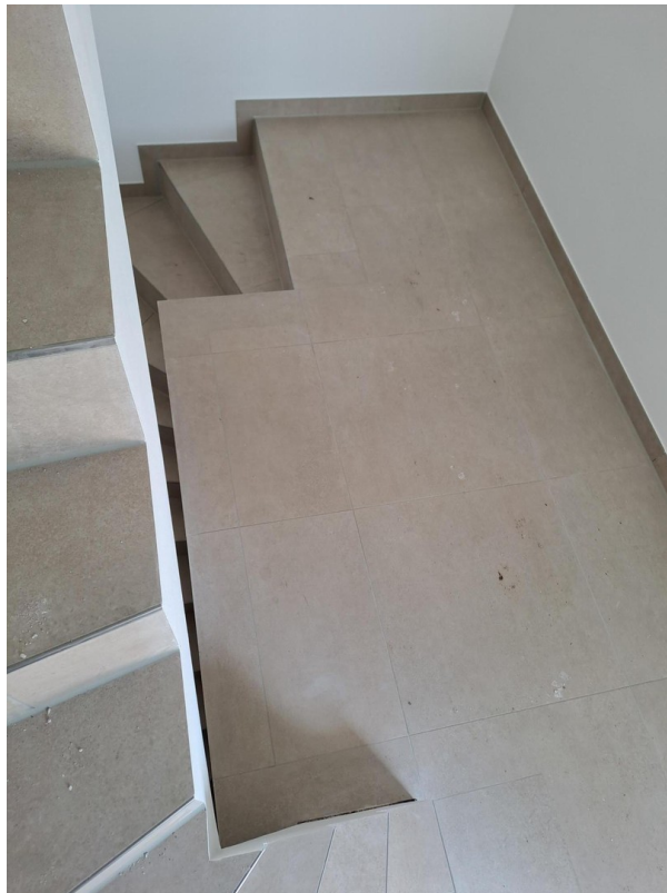
Eingang in Ausbauphase_2