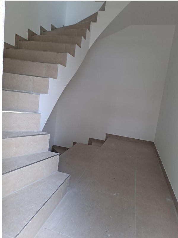
Hauseingang in Ausbauphase