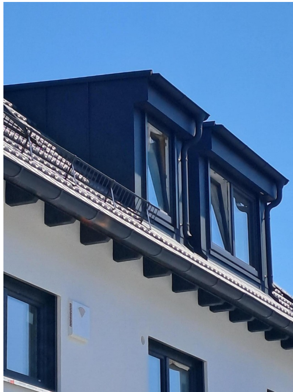
Gaiben Bad u. Wohnzimmer West