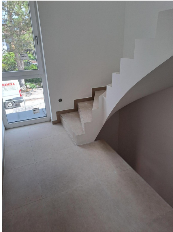
Eingang 1. OG_Ausbauphase