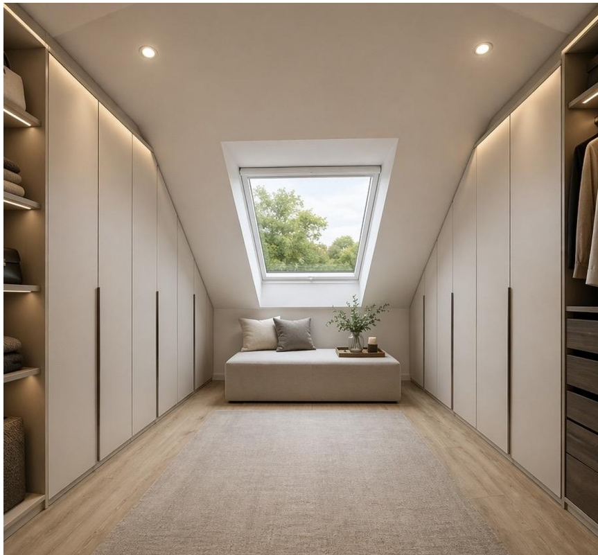
Ankleide - Vorschlag