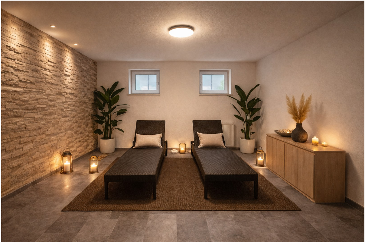
Ruheraum - Vorschlag