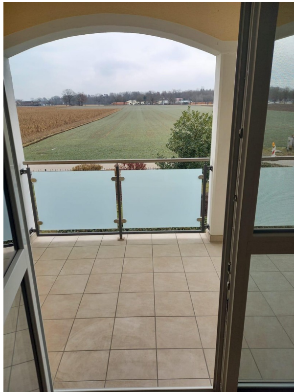
Zugang zur Loggia