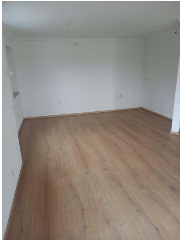
Bereich für Küchenzeile