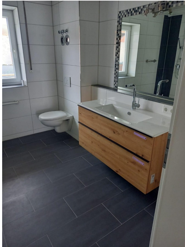
Waschbereich und Toilette