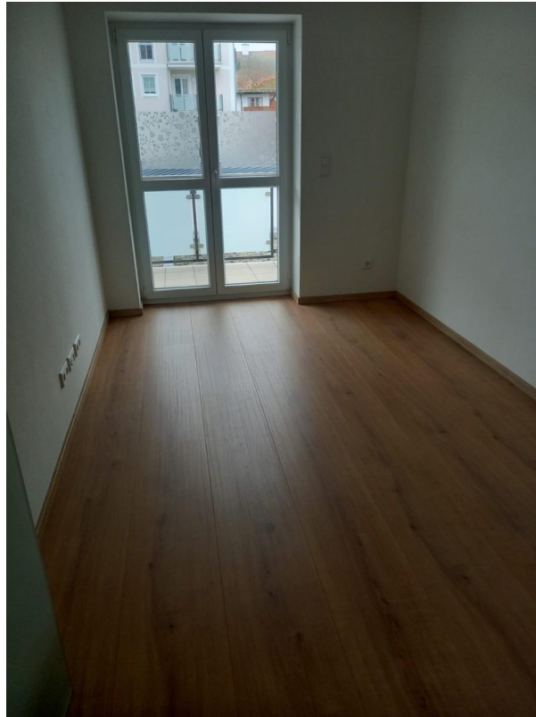
Gästeschlaf- bzw Arbeitszimmer