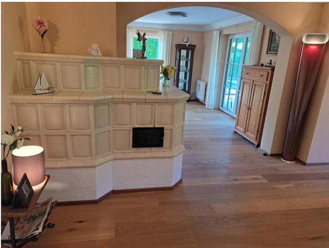
Übergang Ess- zum Wohnbereich