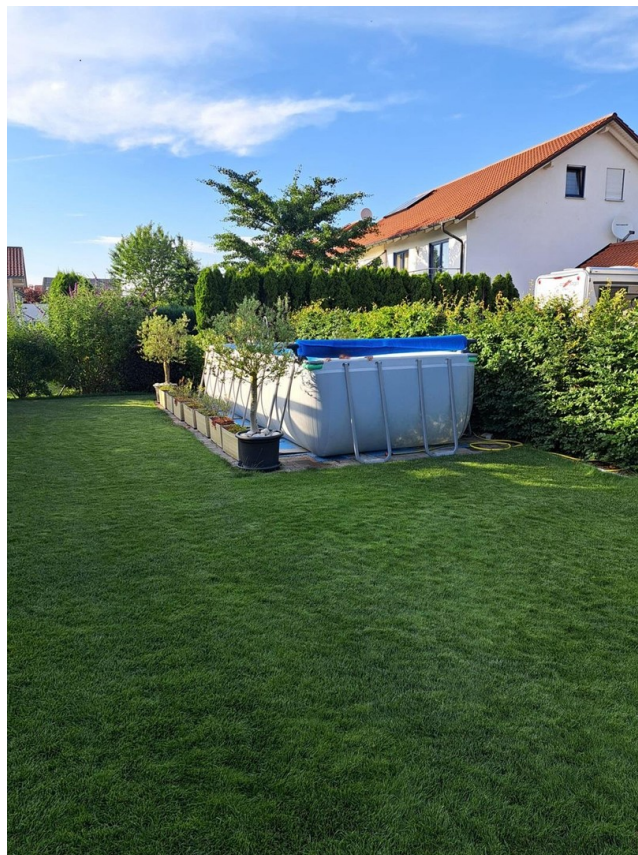
Option Pool statt Loungemöbel