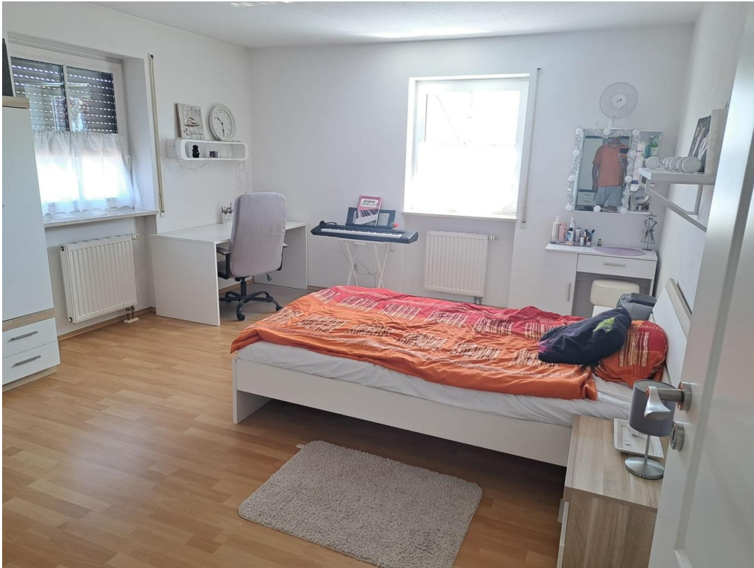
OG Kinderzimmer 1