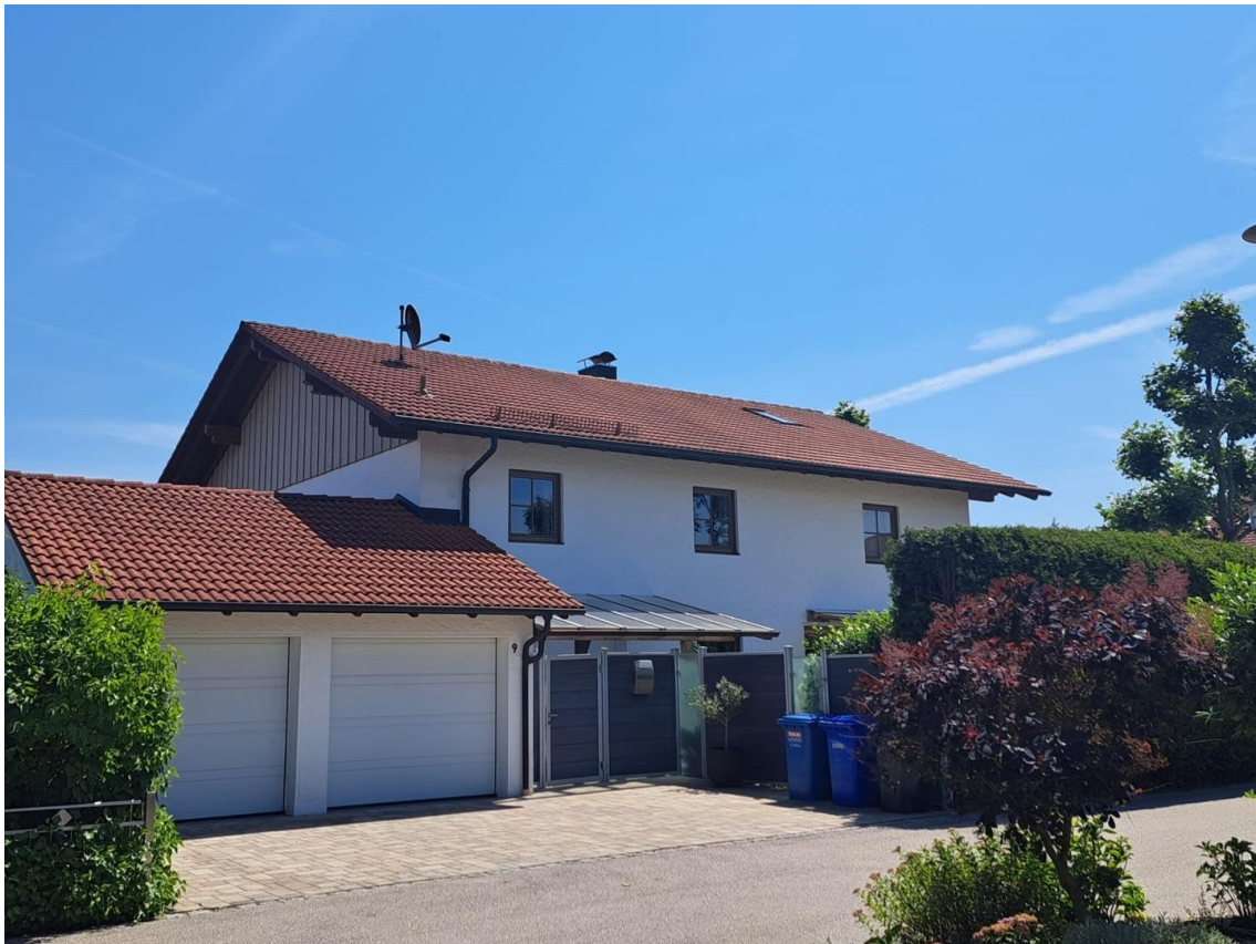
Hausansicht Wasserburger Str.