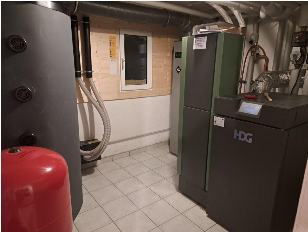
Heizung + Pelletlager