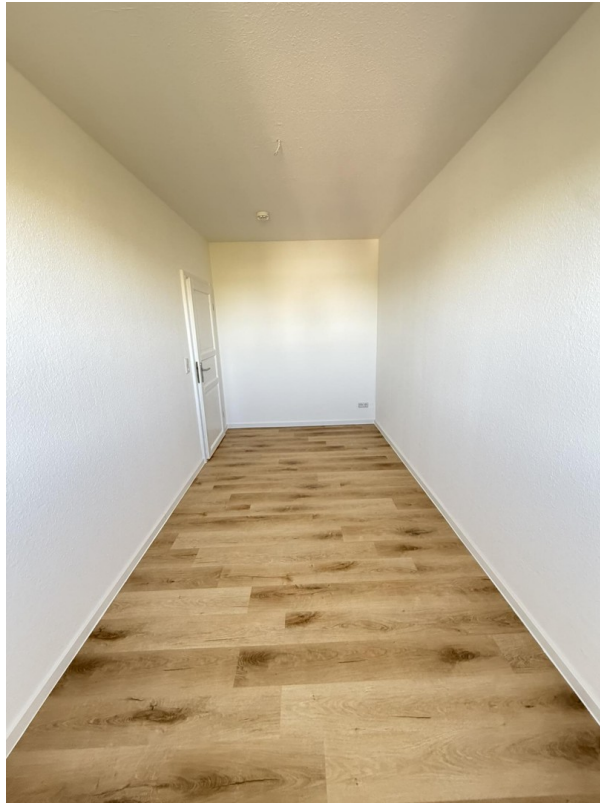
Kinder- / Arbeitszimmer