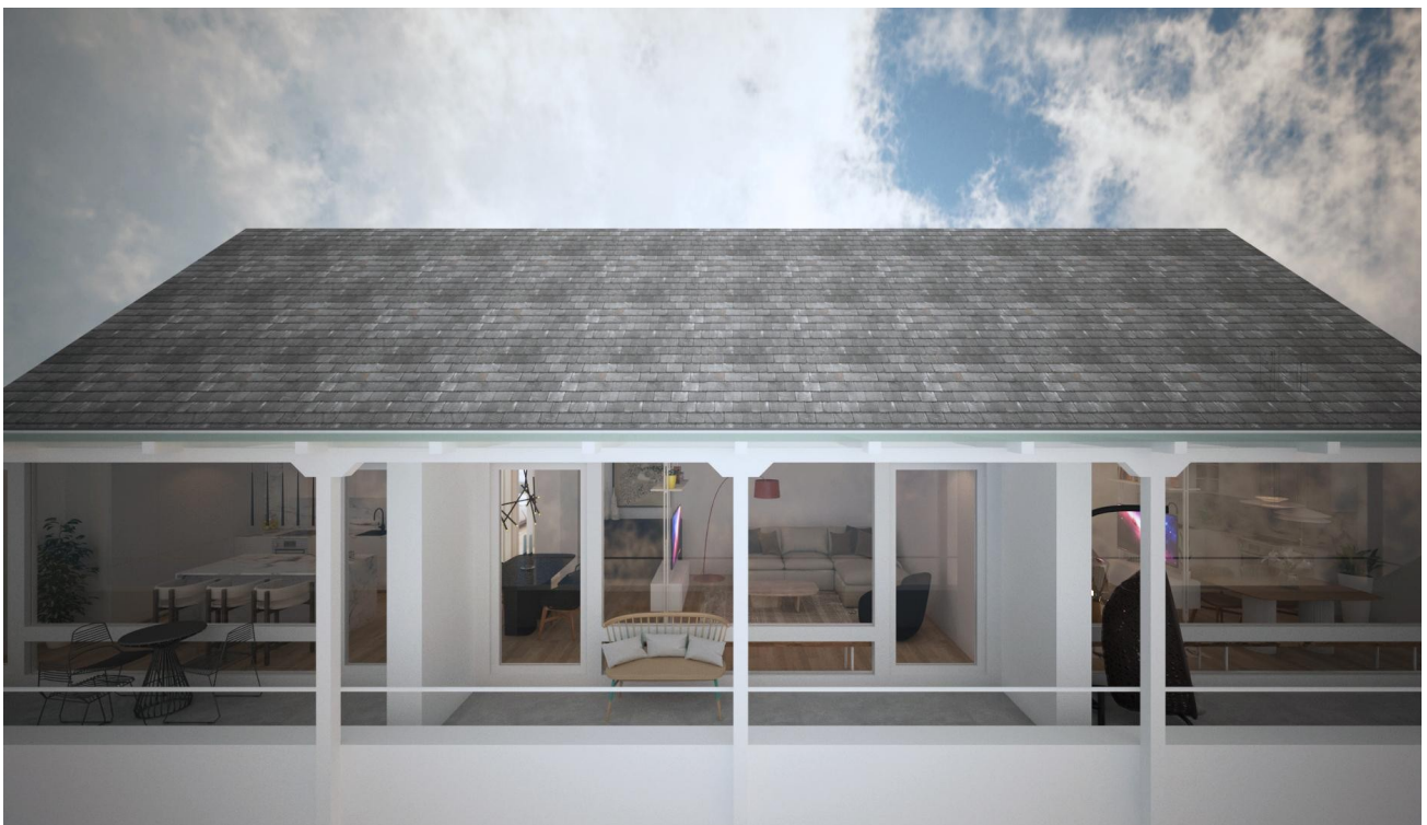
Außenterrasse nach Sanierung