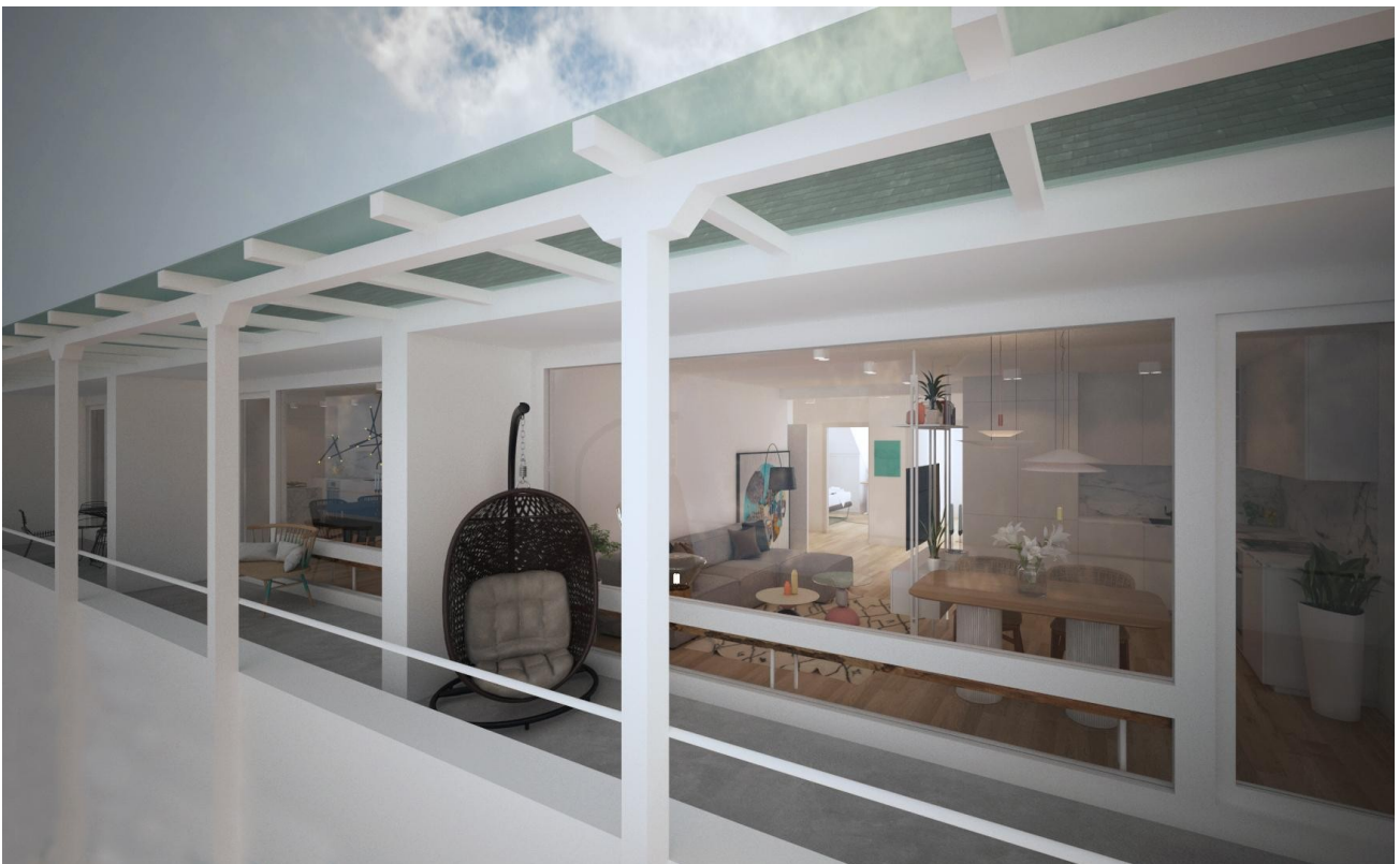
Außenterrasse nach Sanierung