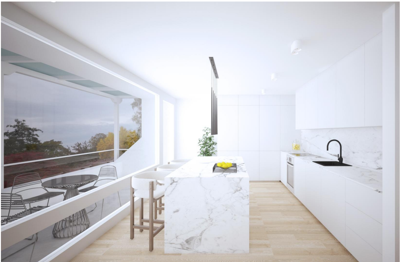
Küche mit Insel