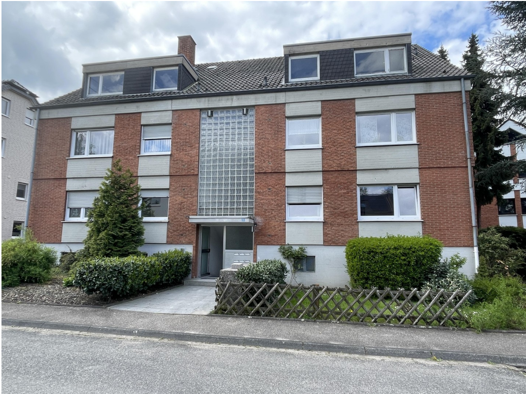
Bestand Außenansicht Straße