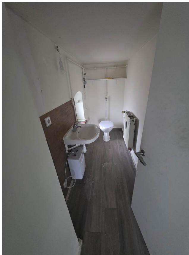
WC + Waschbecken