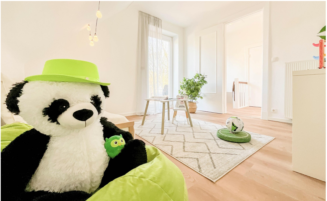
Kinderzimmer 1 OG