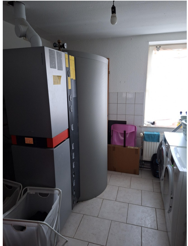
Heizung / Waschraum