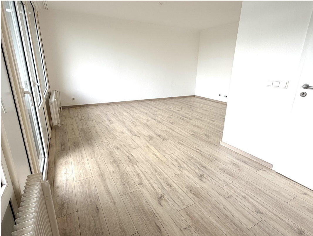
Wohn / Esszimmer