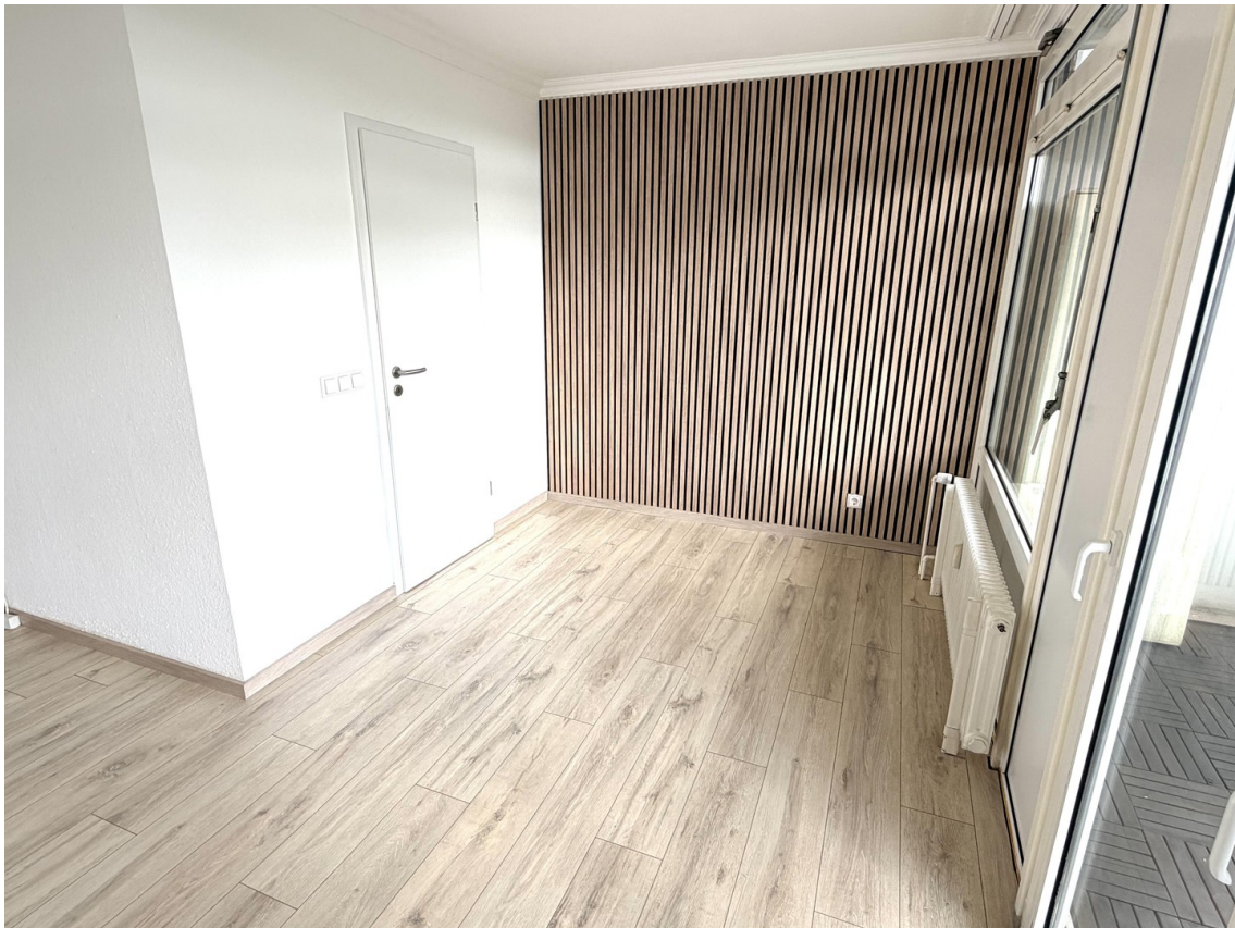
Wohn / Esszimmer