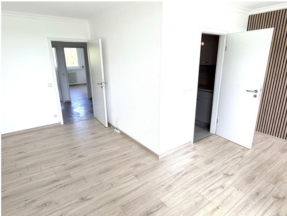
Wohn / Esszimmer