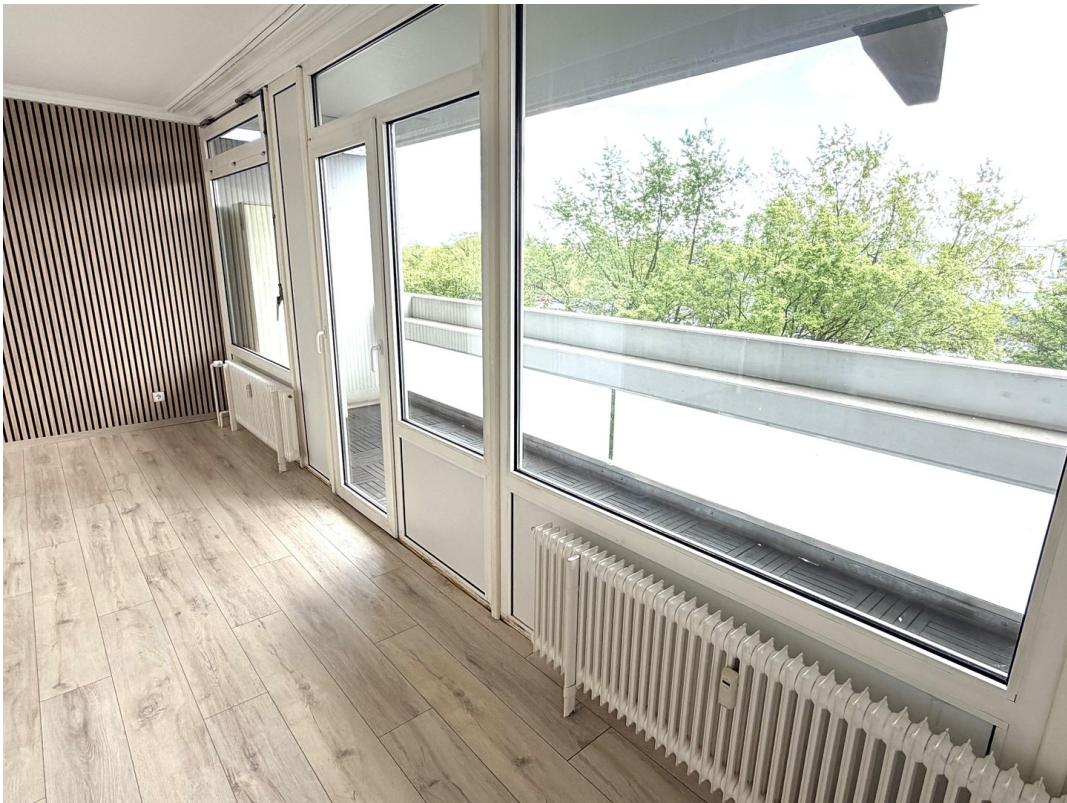
Wohn / Esszimmer