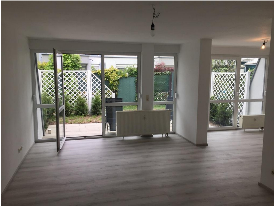
Wohn-/Essbereich ohne Möbel