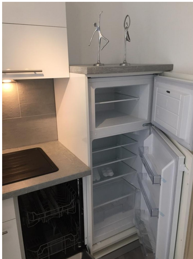
Kühl- und Gefrierschrank