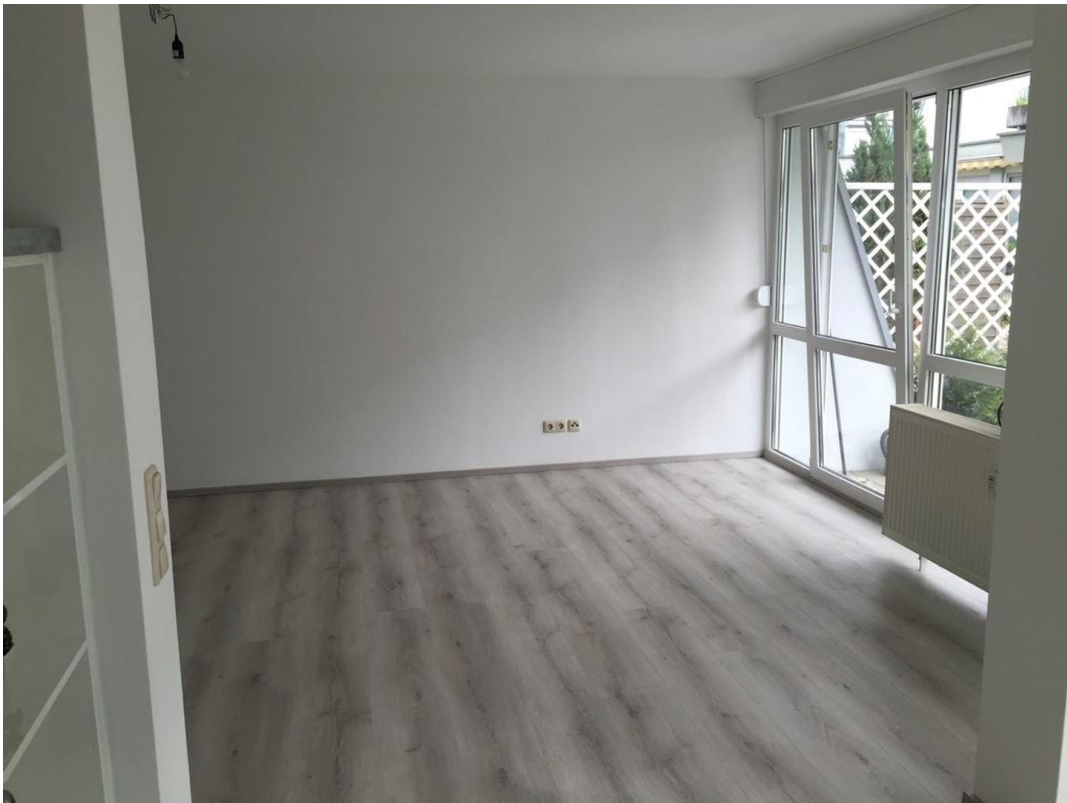
Ess-/Wohnbereich ohne Möbel