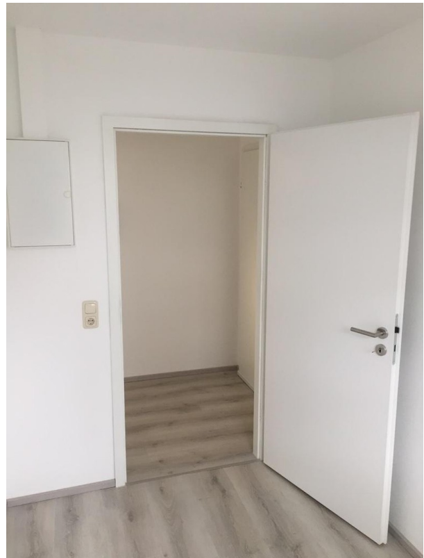
3. kleine Zimmer m. Fenster