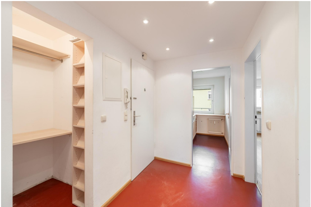
Diele mit Abstellkammer