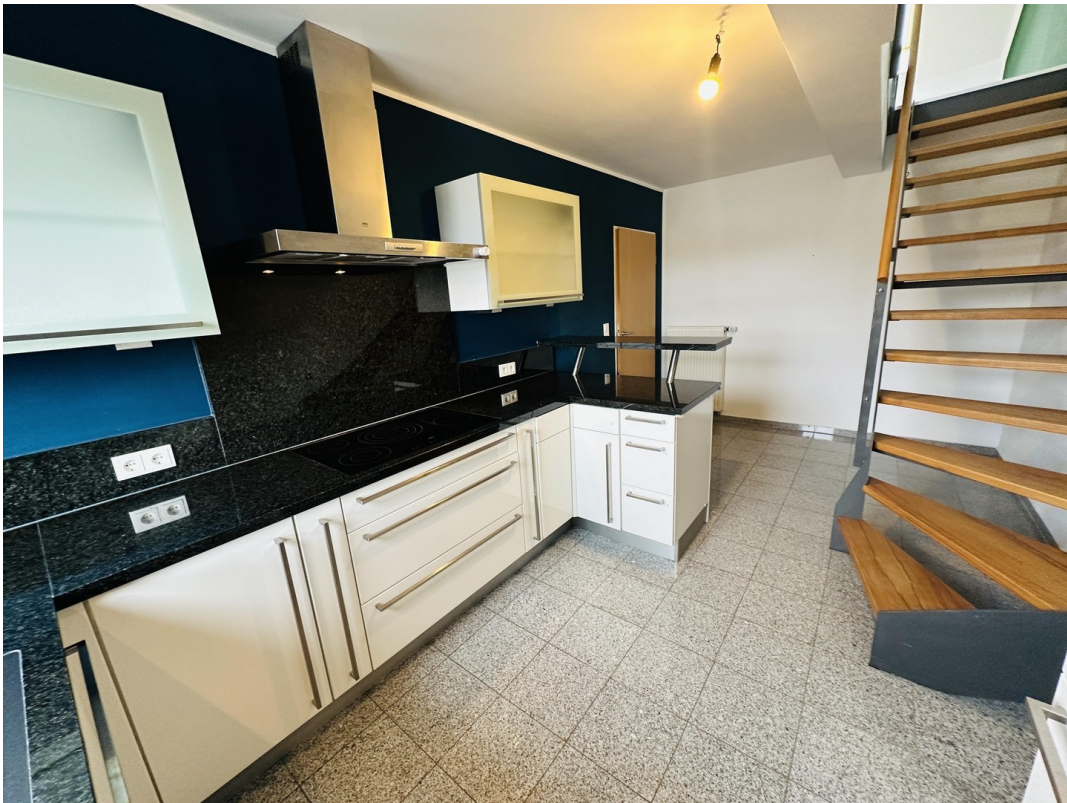
Küche, Aufgang Wohnzimmer