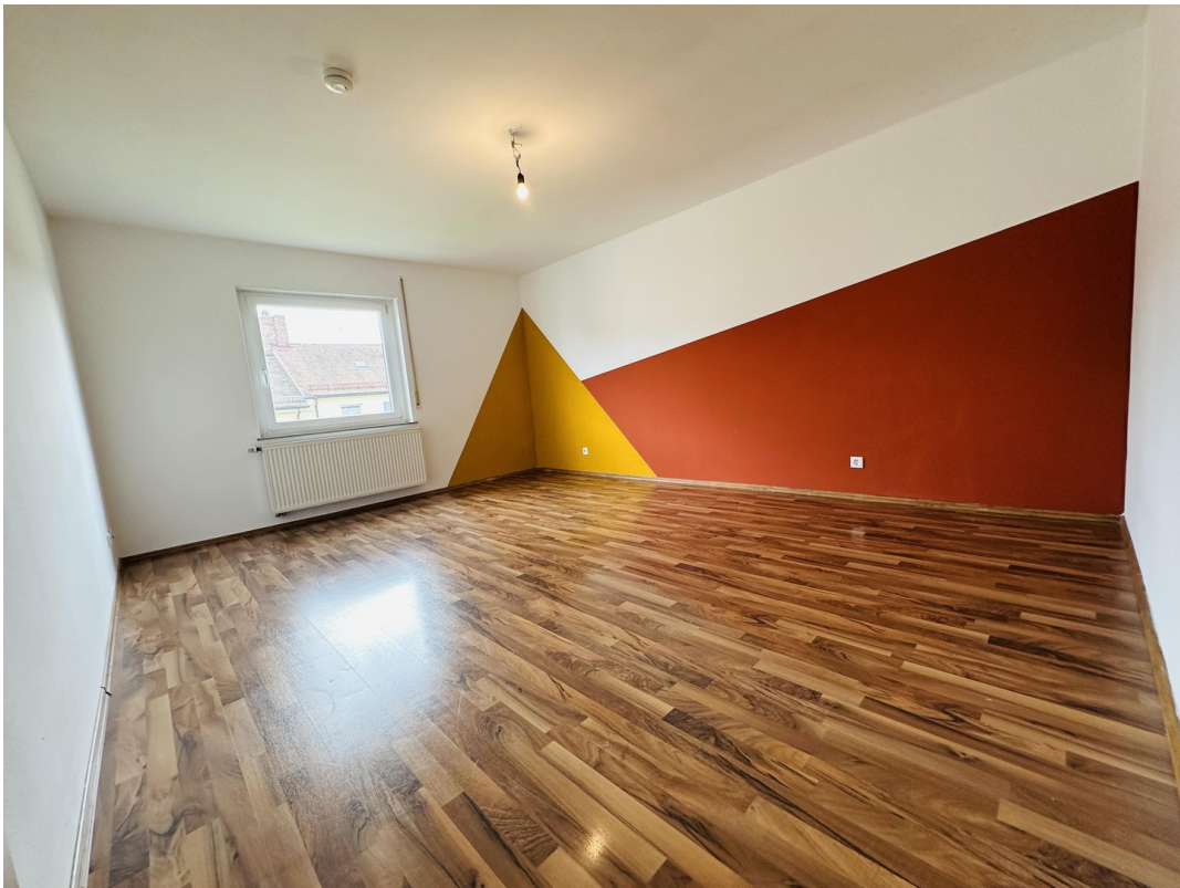
Kinder- o. Arbeiten