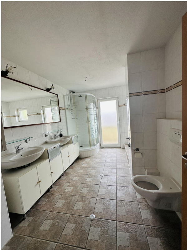
Tageslichtbad mit Dusche