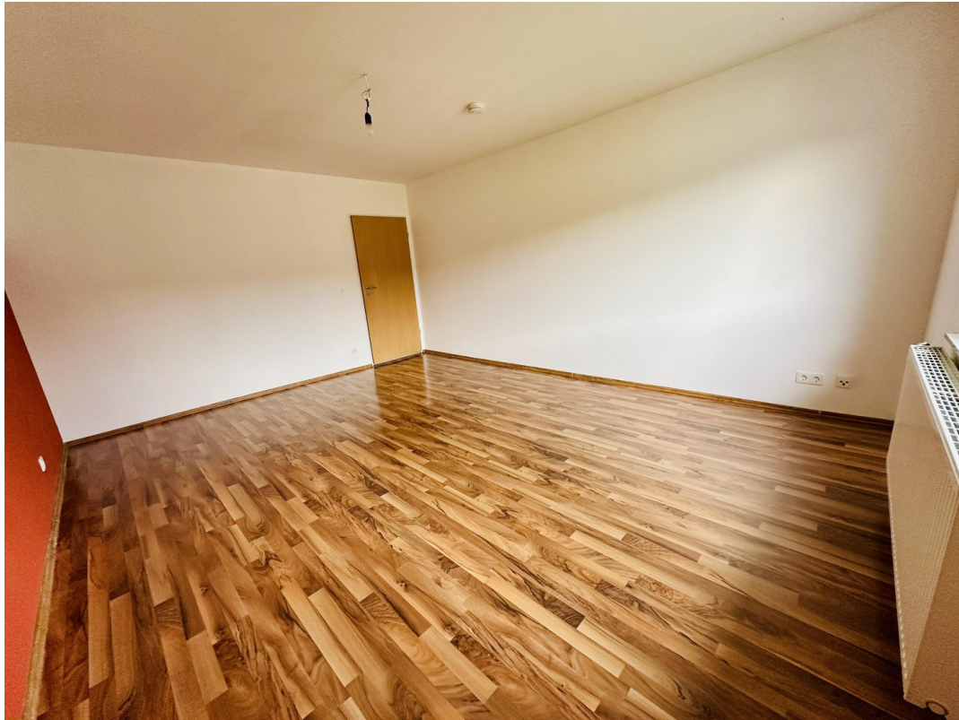
Kinder- o. Arbeiten