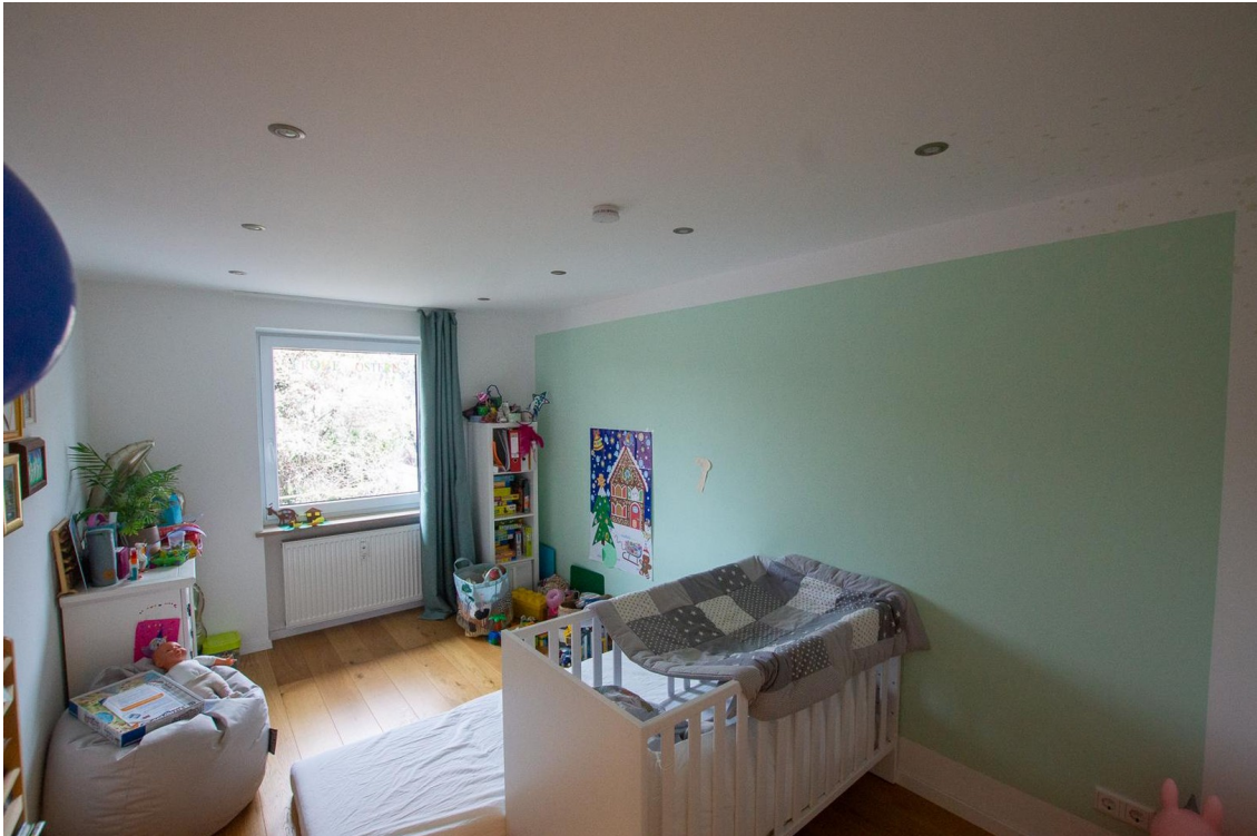
Kleines Schlafzimmer 1