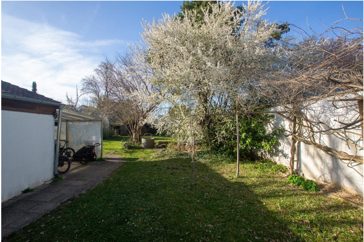
Garten; Blick Richtung Norden