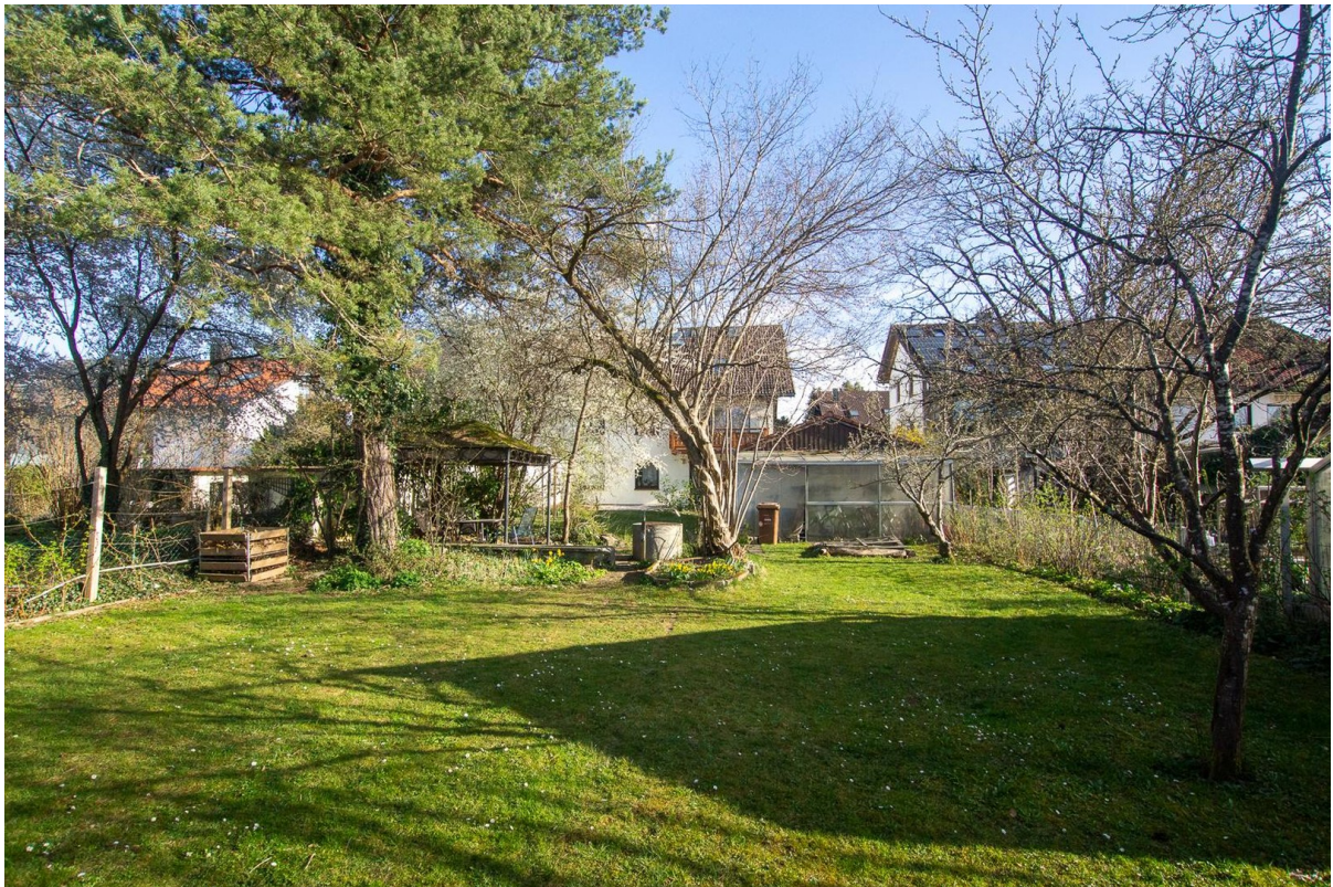
Garten; Blick Richtung Süden