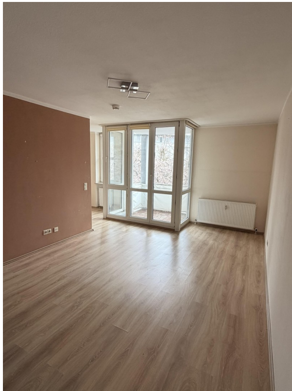
Wohn - und Esszimmer