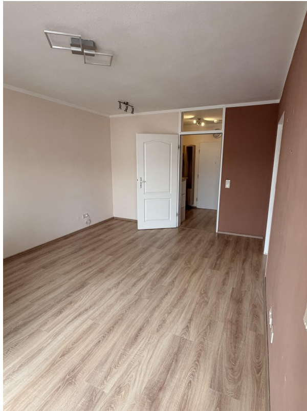
Wohn - und Esszimmer