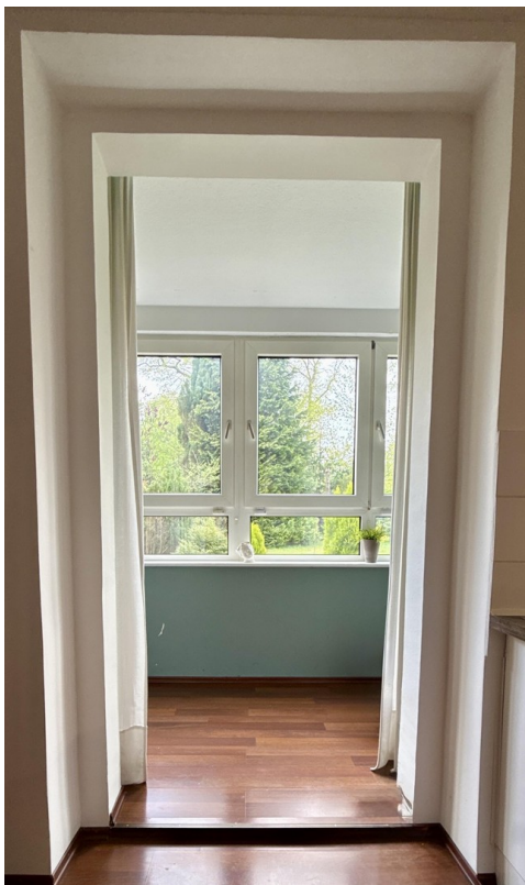
Blick in den Wintergarten