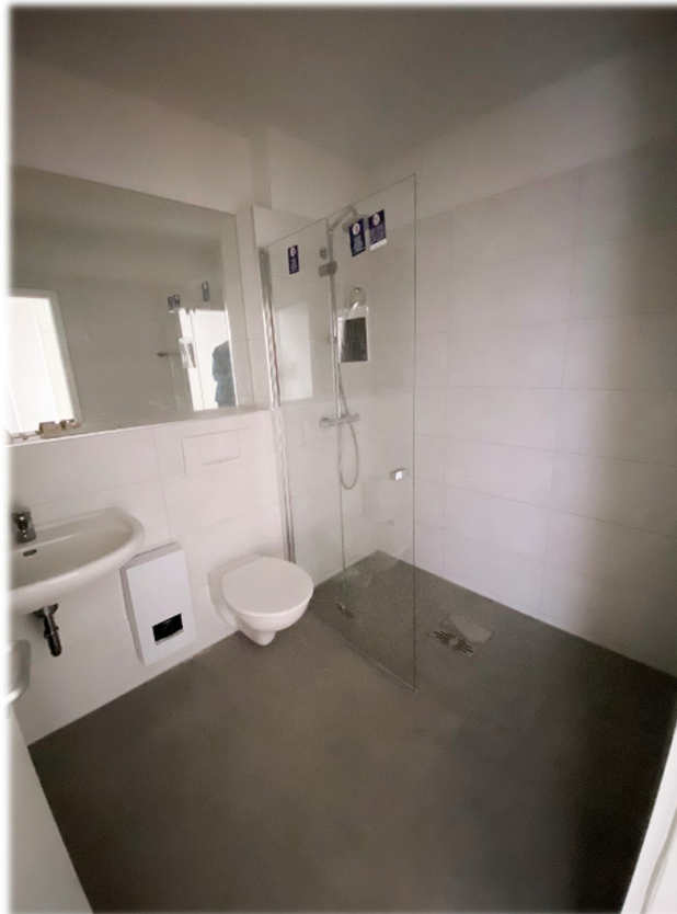
Badezimmer mit Walk In Dusche