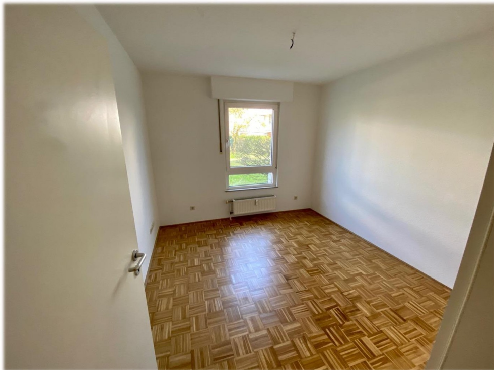
Raum 2 bspw Schlafzimmer