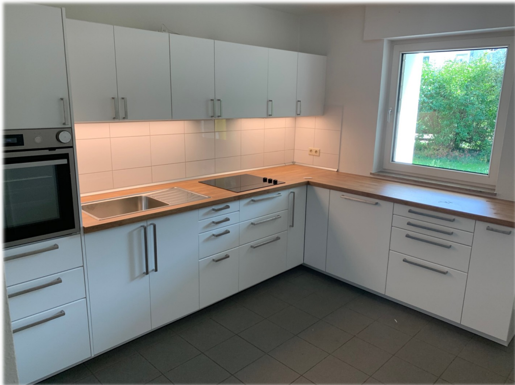
Küche mit Blick auf Garten