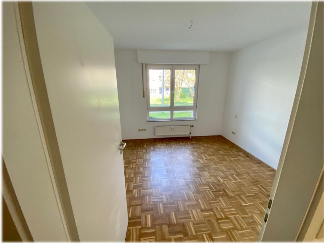
Raum 3 bspw Büro