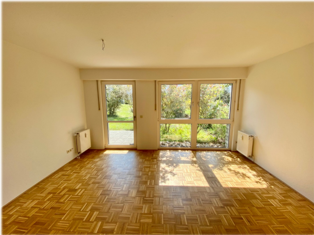
Wohnzimmer mit Terrassenzugang