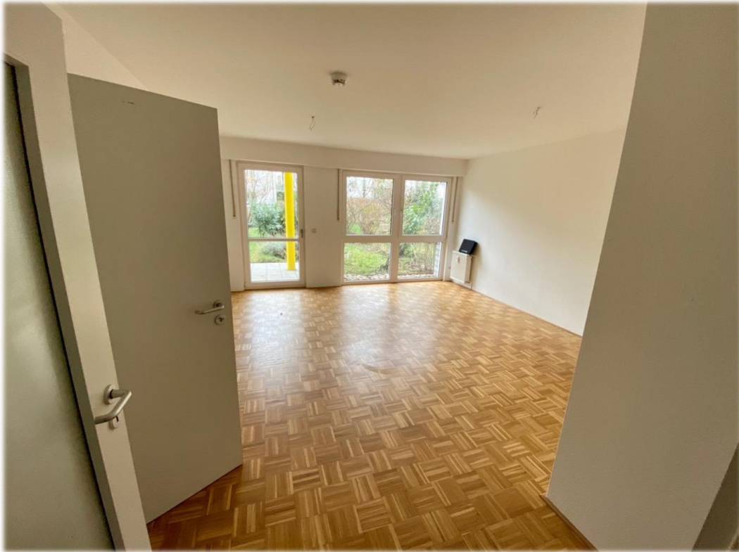
Blick aus Diele ins Wohnzimmer