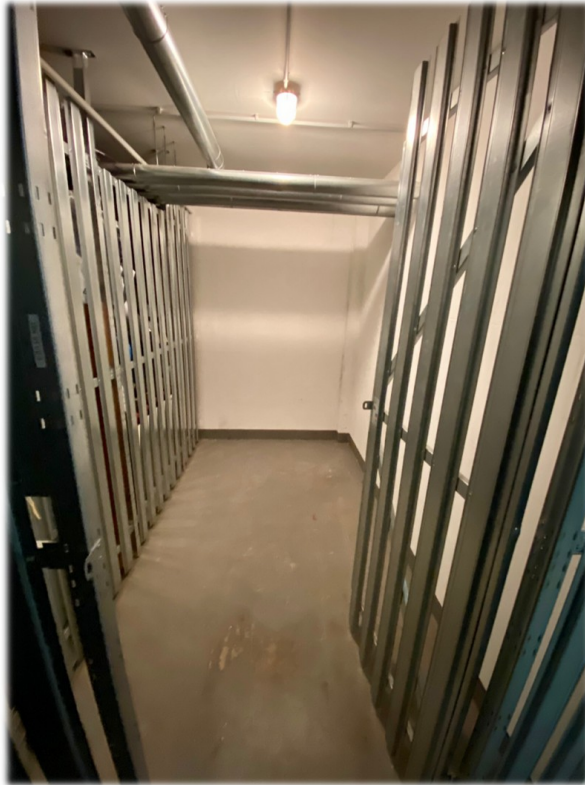
Abstellraum im Keller