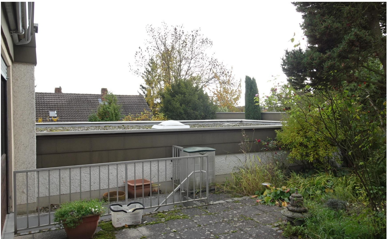
Zugang zum Keller