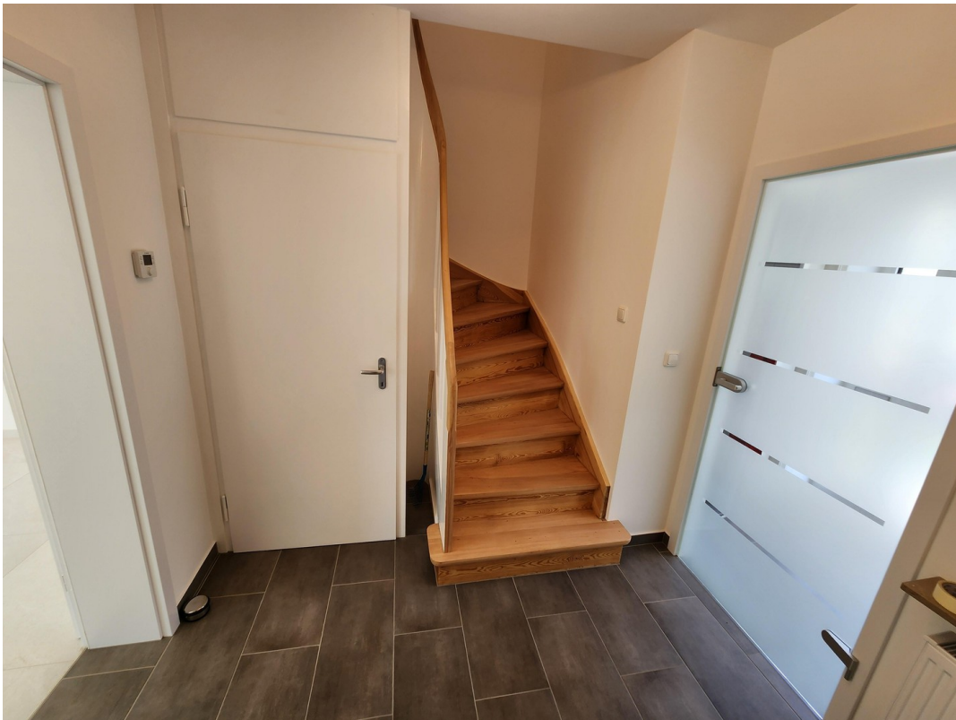
Treppenaufgang zum OG