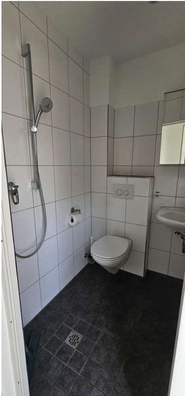
Badezimmer/Gäste WC EG