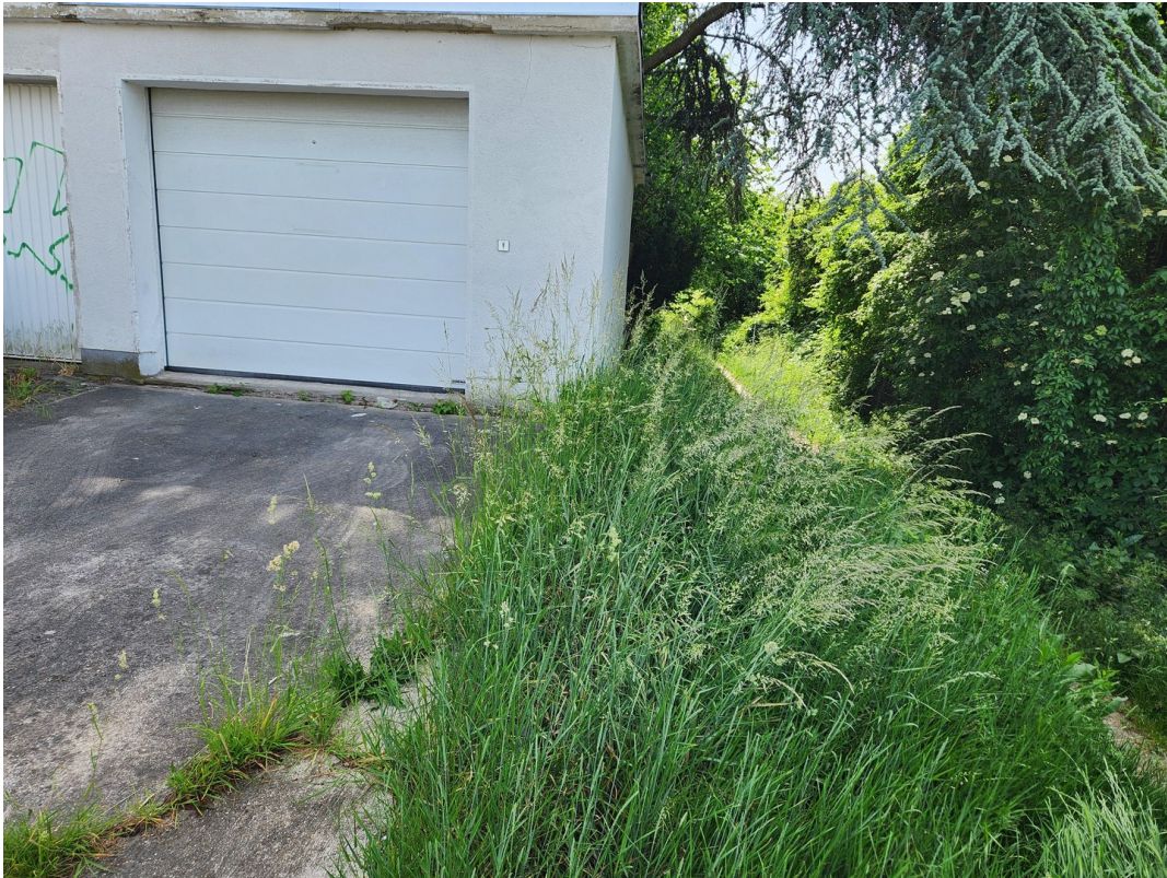
Garage und Stellplatz