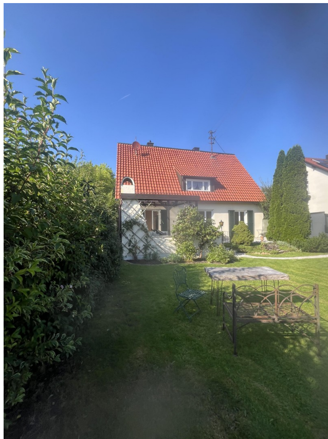
Blick vom Garten aufs Haus