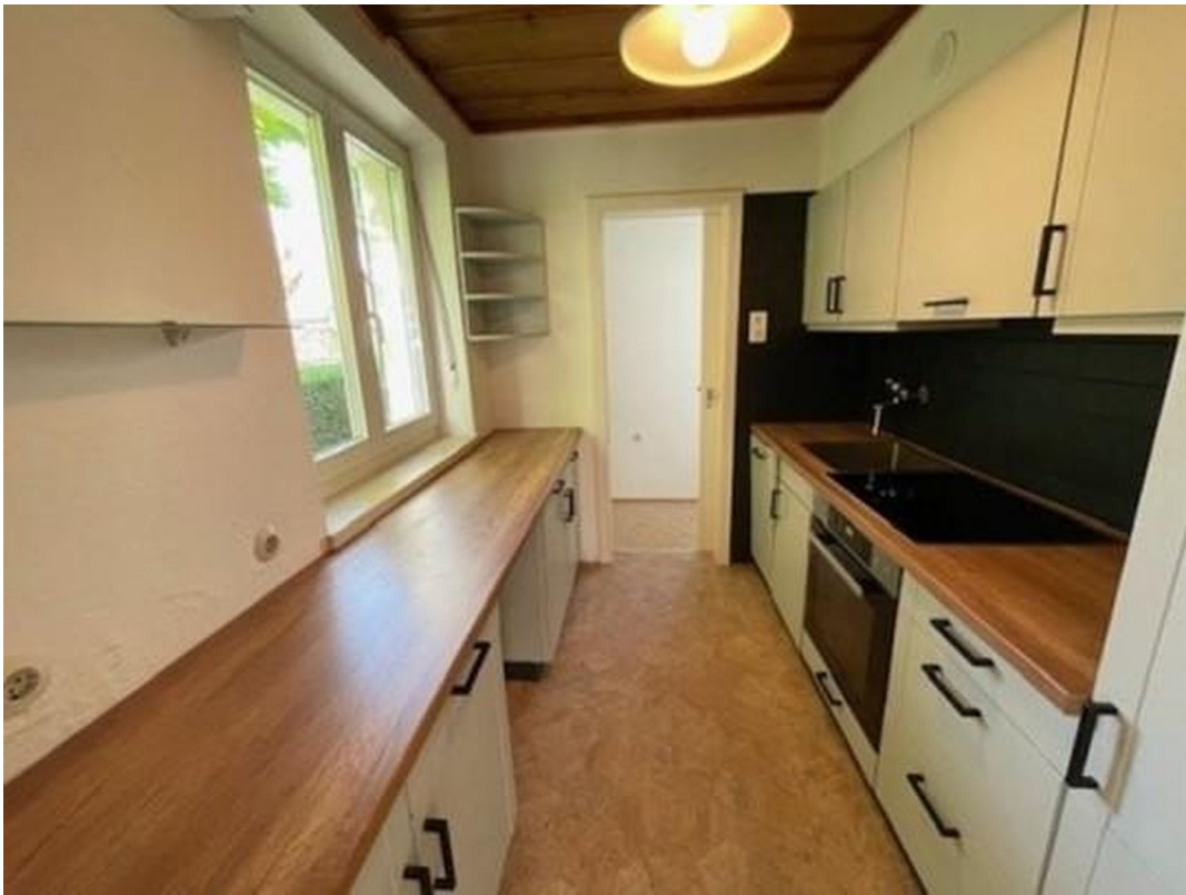
Küche EG + Speisekammer