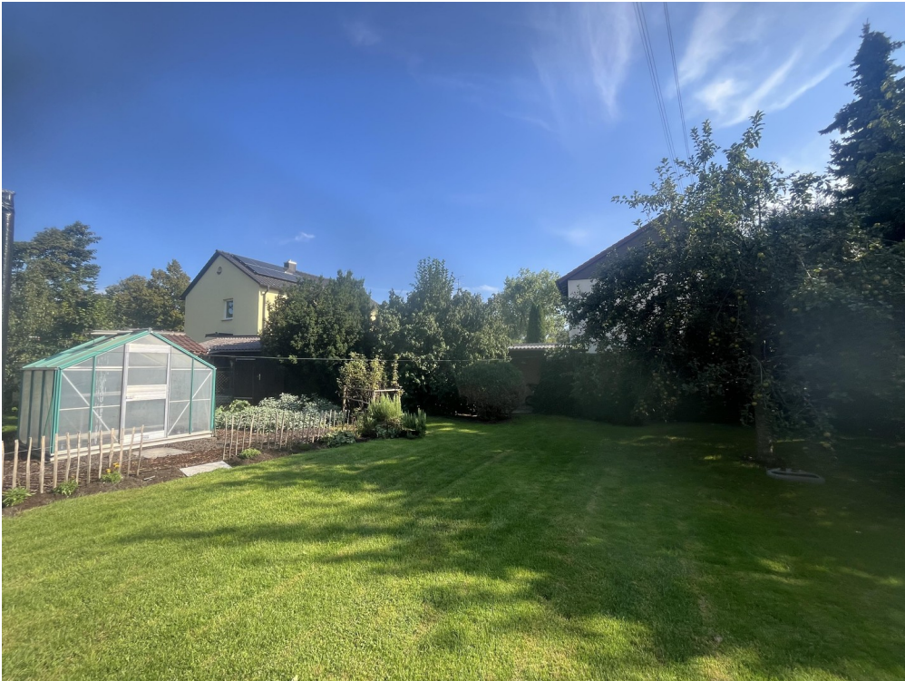
Garten - Südseite