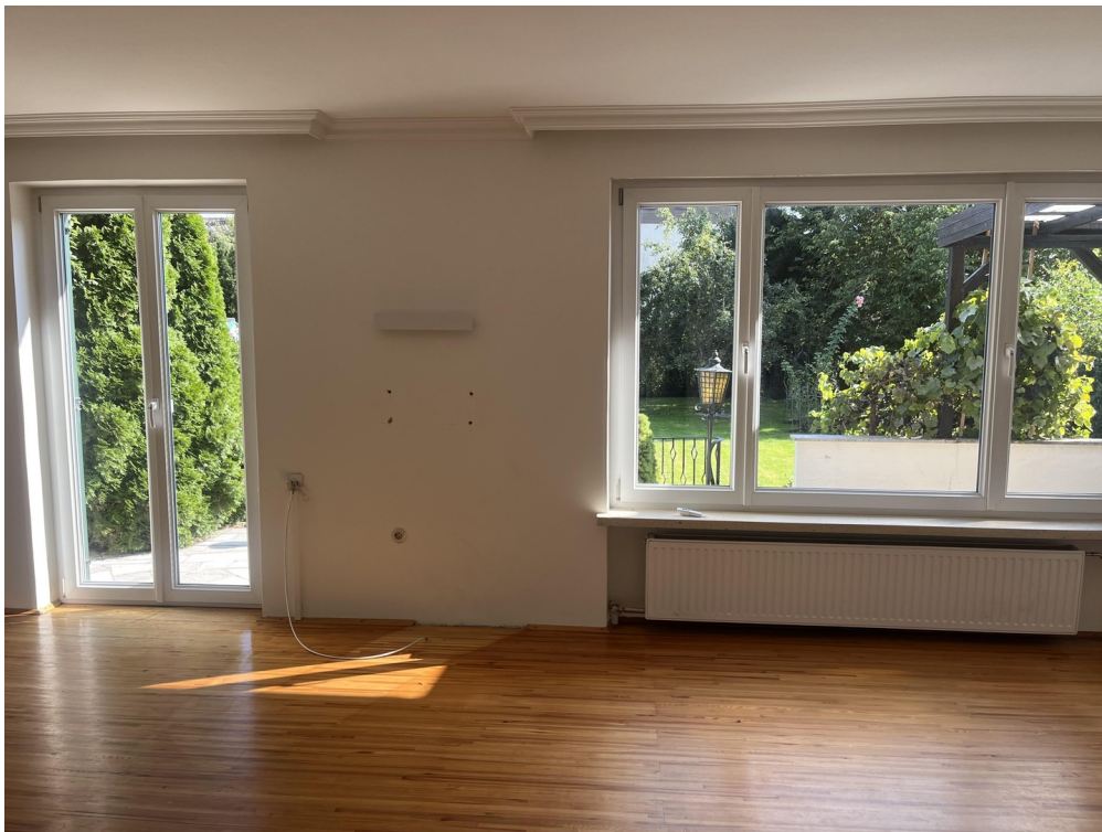
Blick aus dem Wohnzimmer EG