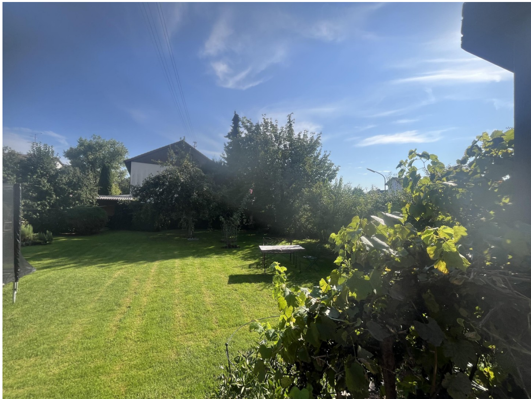
Garten - Südseite