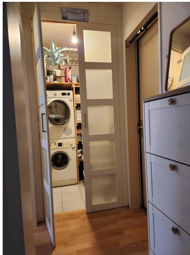
Flur mit Abstellkammer