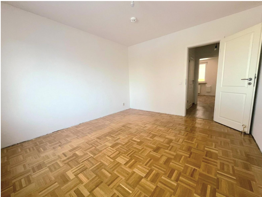
Schlafen ca. 14 m 2