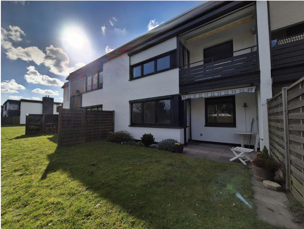
Terrasse mit Blick ins Grüne