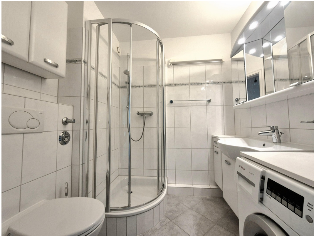
Bad / WC ca. 3,9 m 2