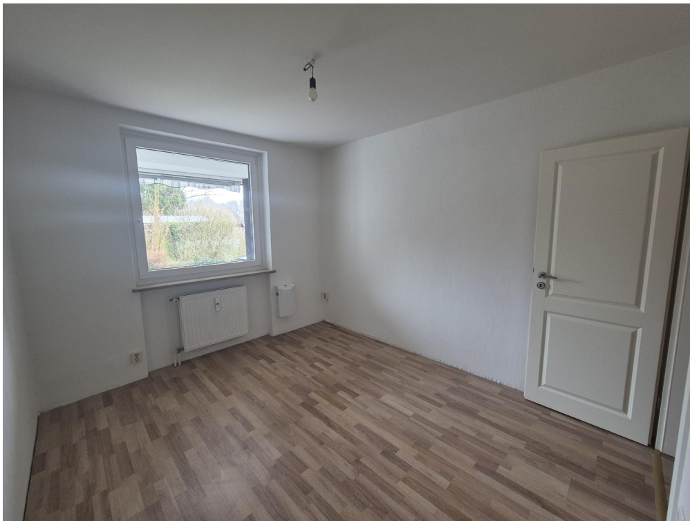
Kind / Büro ca. 10,7 m 2