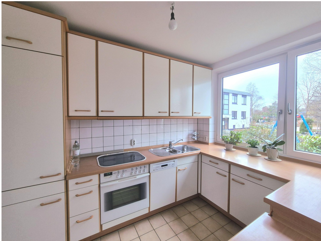
Kochen ca. 7,5 m 2