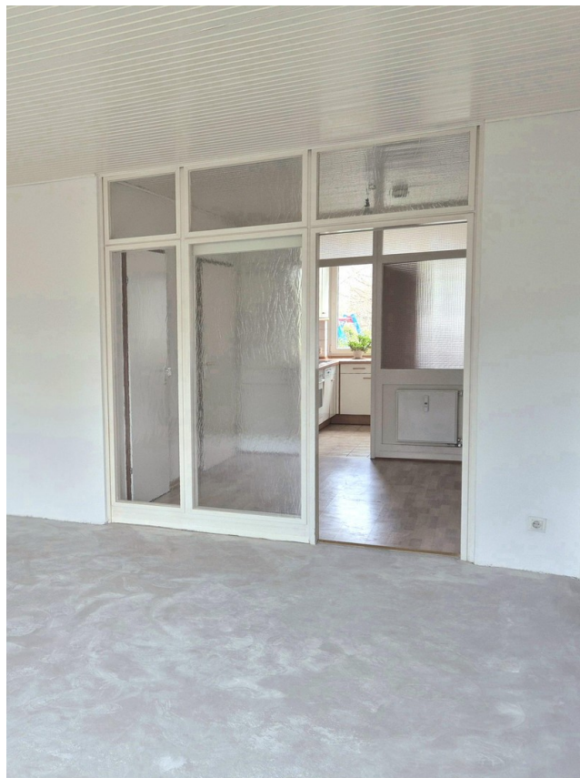
Wohnen, Essen und Kochen