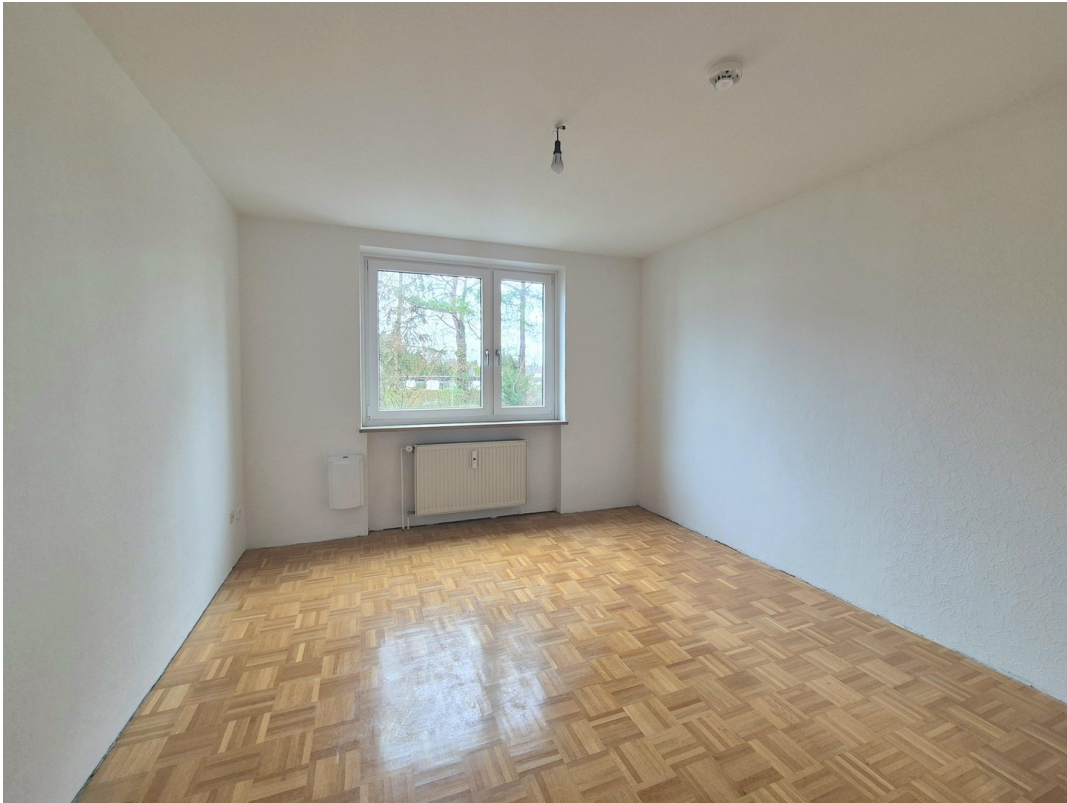
Schlafen ca. 14 m 2