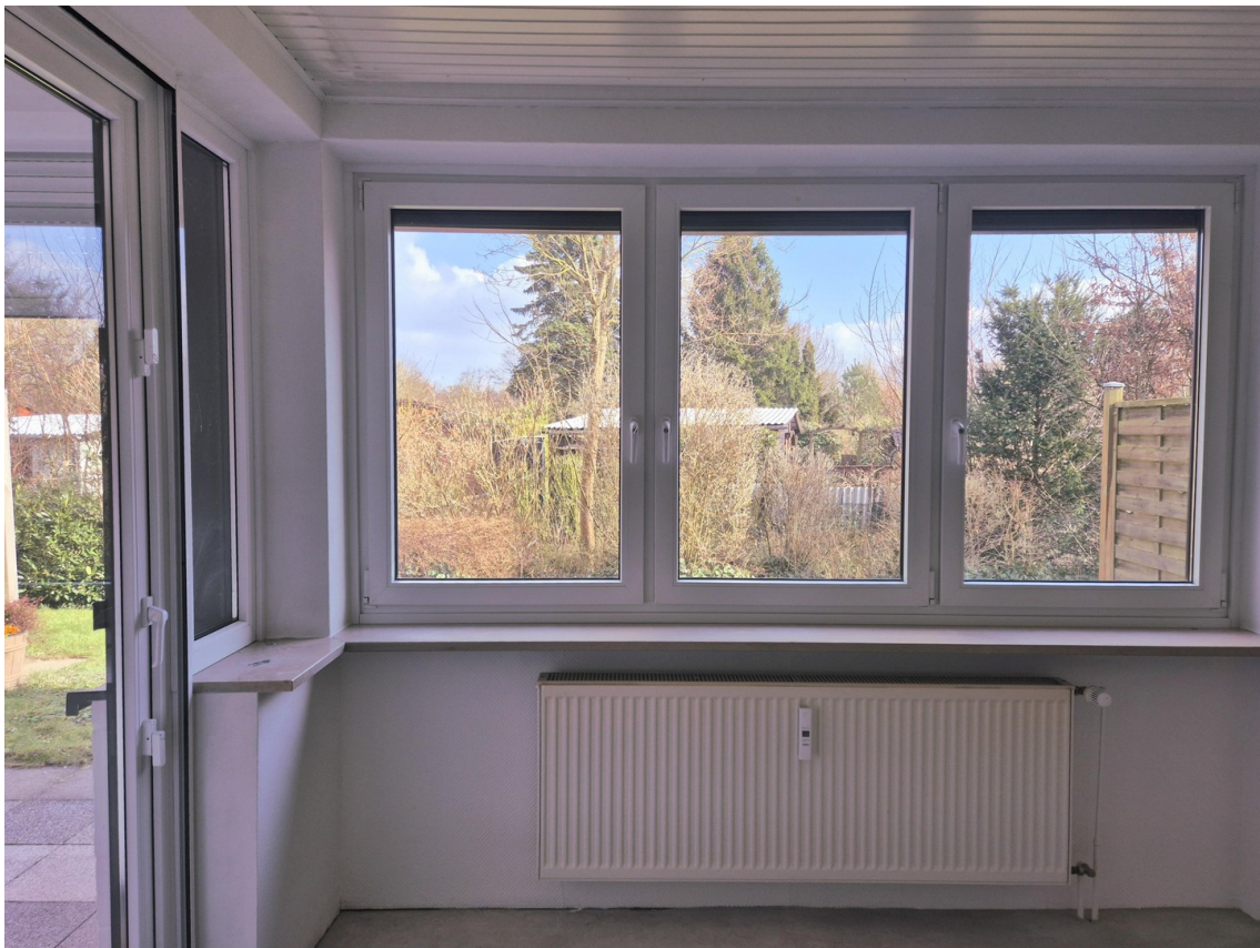
Blick aus dem Wohnzimmer