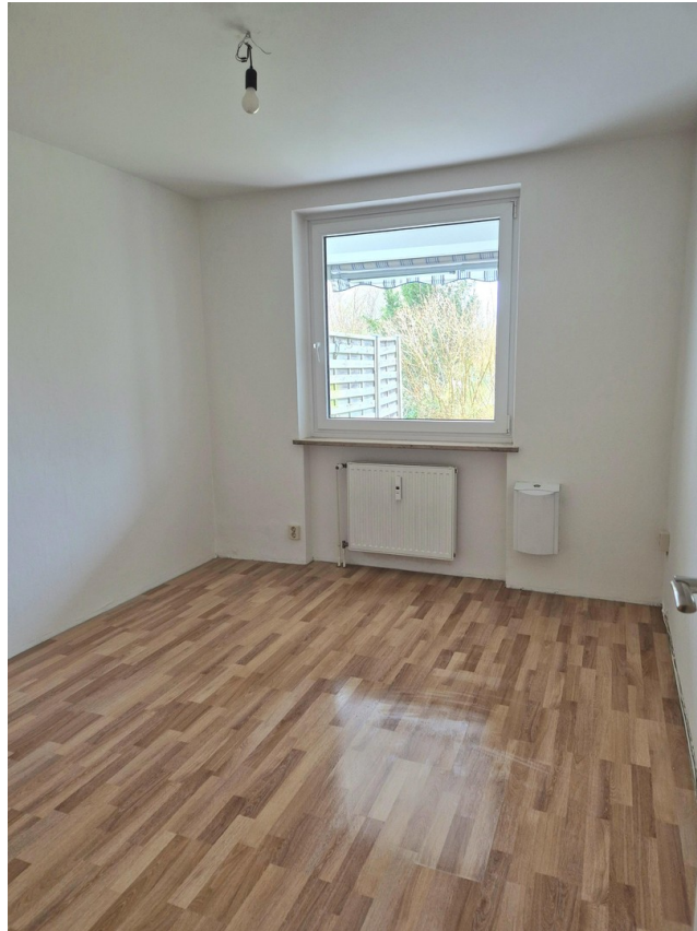
Kind / Büro ca. 10,7 m 2