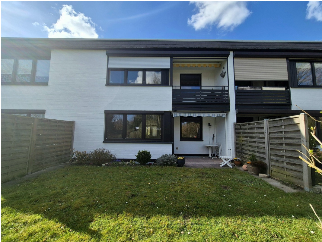
Terrasse mit Blick ins Grüne