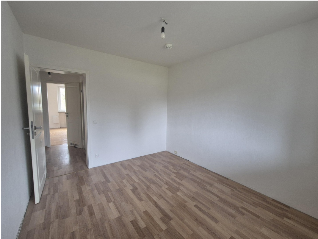
Kind / Büro ca. 10,7 m 2