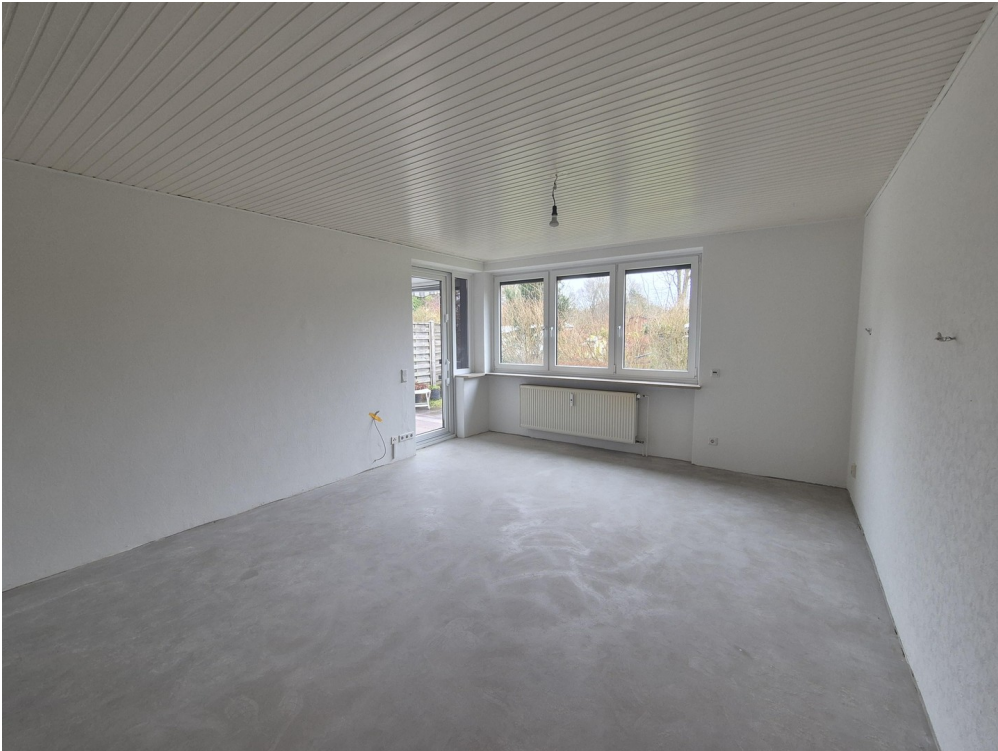
Wohnen ca. 22,6 m 2