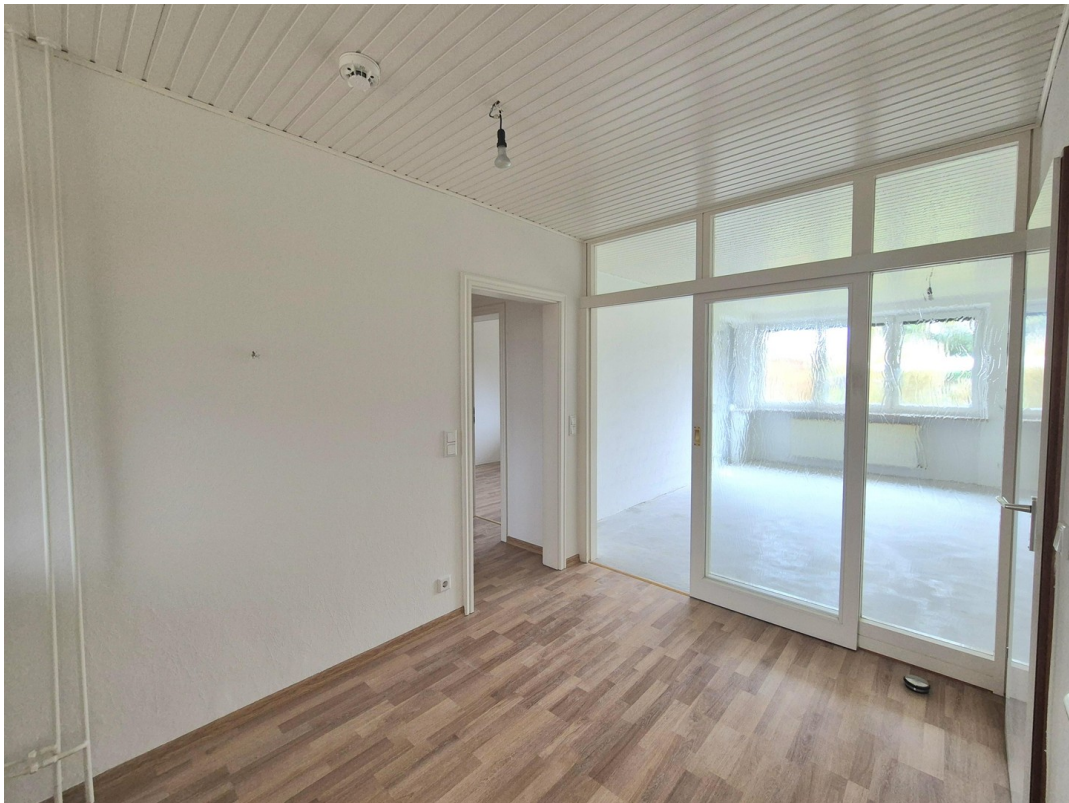
Essen ca. 7,3 m 2