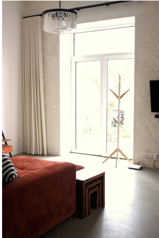
Wohnzimmer mit Balkontür