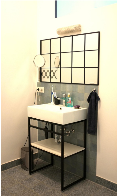
Bad mit Metalltisch