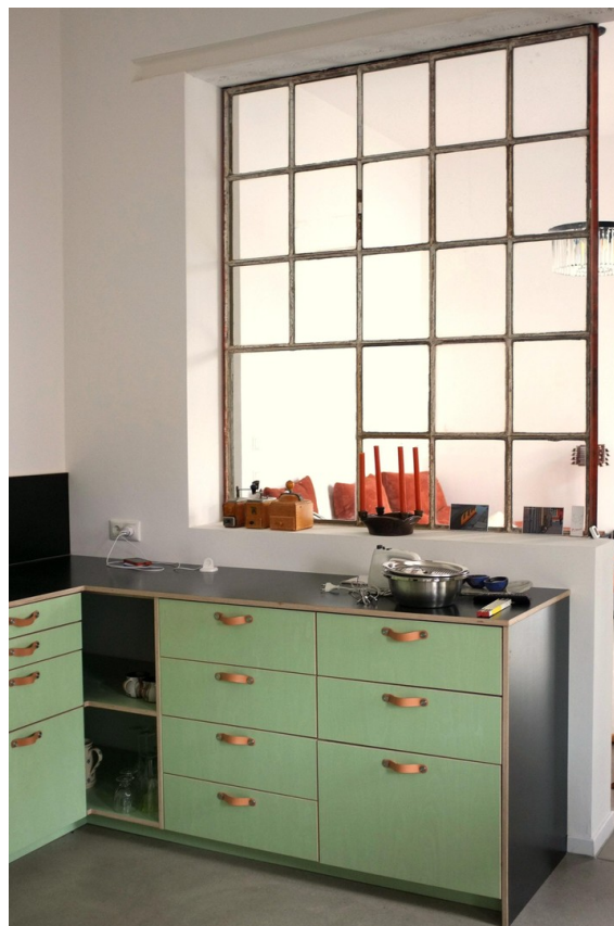
Blick zum Wohnzimmer