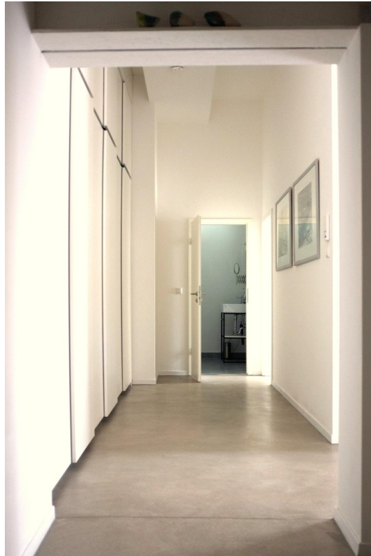
Blick in den Flur