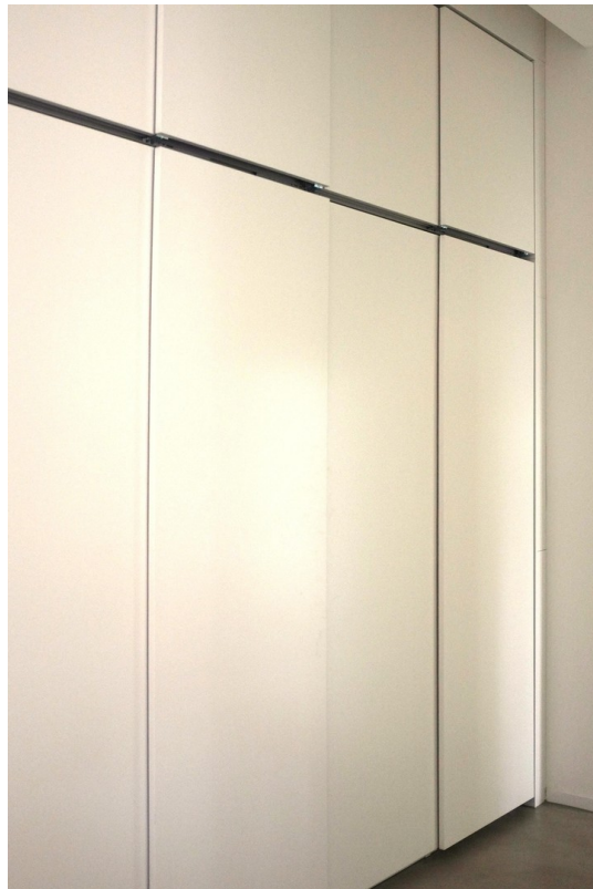
Wandschrank im Flur