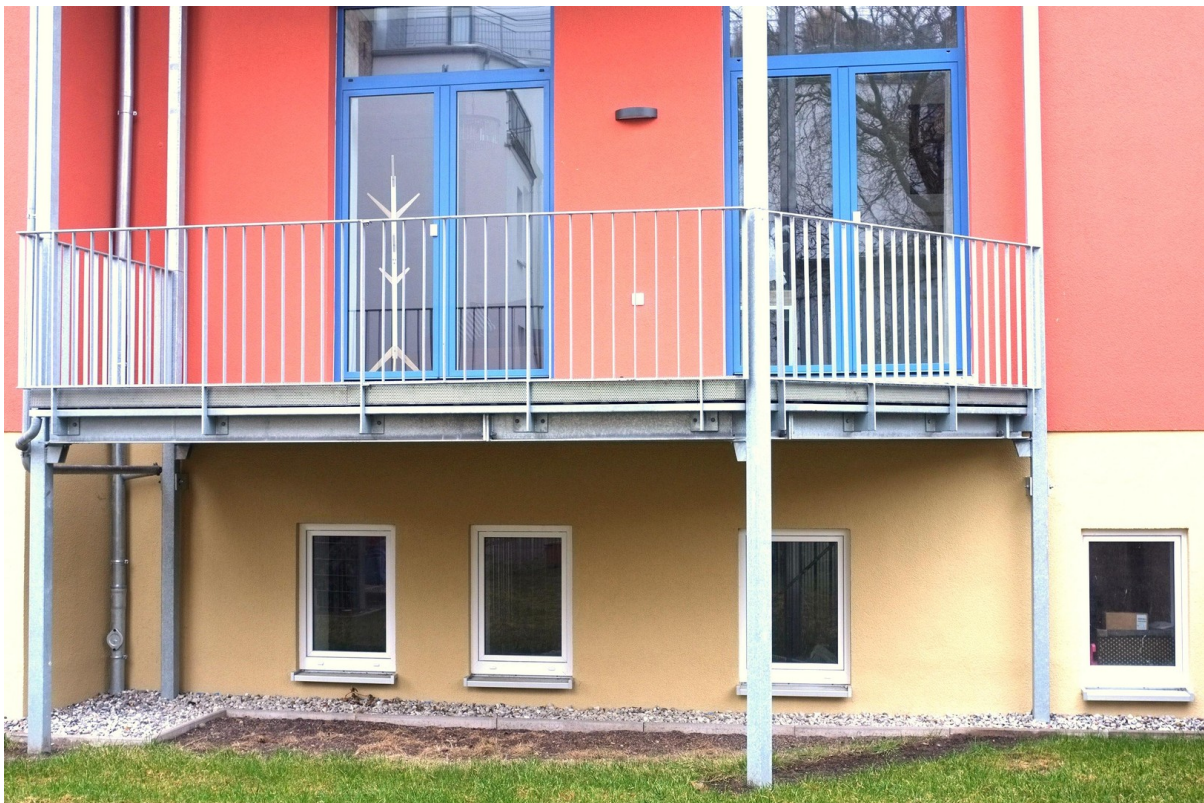
Blick vom Innenhof